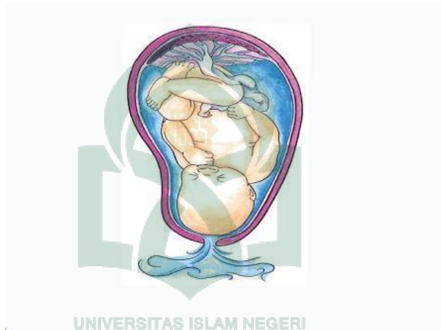
Gambar 2.1 Ketuban Pecah Dini

KPD adalah komplikasi yang terlihat pada kehamilan. Sebagian penyebabnya tidak diketahui dan diikuti oleh PROM sebelumnya. Hal ini terlihat kebanyakan pada ibu rumah tangga. Kelompok usia 20-30 adalah kelompok yang paling sering terjadi KPD (Mishra dan joshy, 2015 : 147).