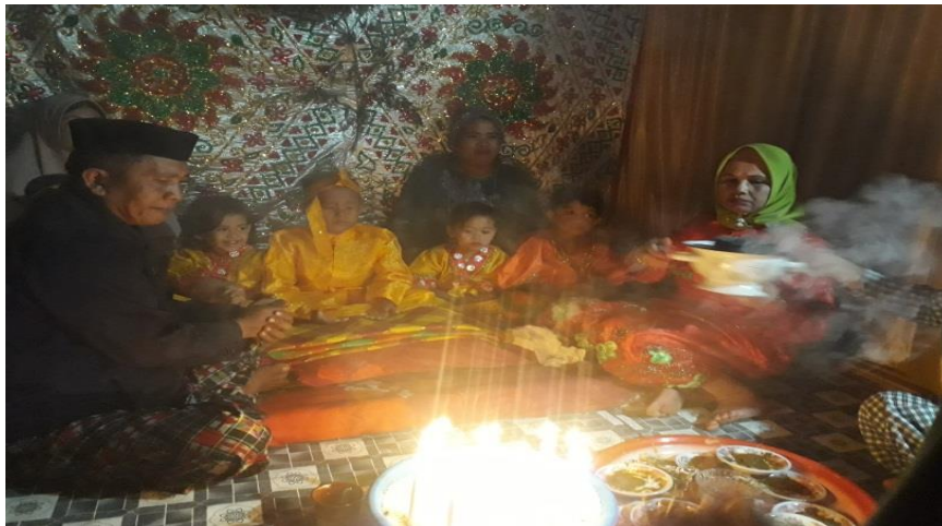
Gambar 7: malam korongtigi

Prose malam Anggalara dilakukan sebelum proses assunna , dilaksanakan selama tiga malam yang diiringi oleh paganrang (gendang) dan didupai selama 7 kali putaran yang diberi wewangi kemenyang. Anak tersebut memakai pakaian adat yang seperti pakaian adat Bugis Makassar, anak duduk diatas kasur yang sudah disiapkan anak duduk sila dan meletakkan tangan diatas bantal yang dialasi daun pisang, didampingi oleh dayang-dayang yang berasal dari keluarganya. Pada malam terakhir biasanya para keluarga pergi annittili (ikut pelaksanaan mapaccing) dan memberikan uang. Malam anggalara yaitu malam passua-suarang agar pesta itu meriah ini adalah kebiasaan-kebiasaan orang dahulu yang dilaksanakan sampai sekarang karena merupakan warisan dari leluhurnya dan masih dijaga dengan baik agar tidak digeser oleh zaman.