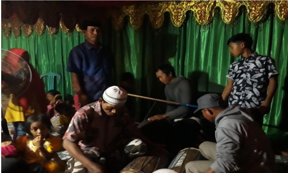
Gambar 1: pagangrang (gendang)