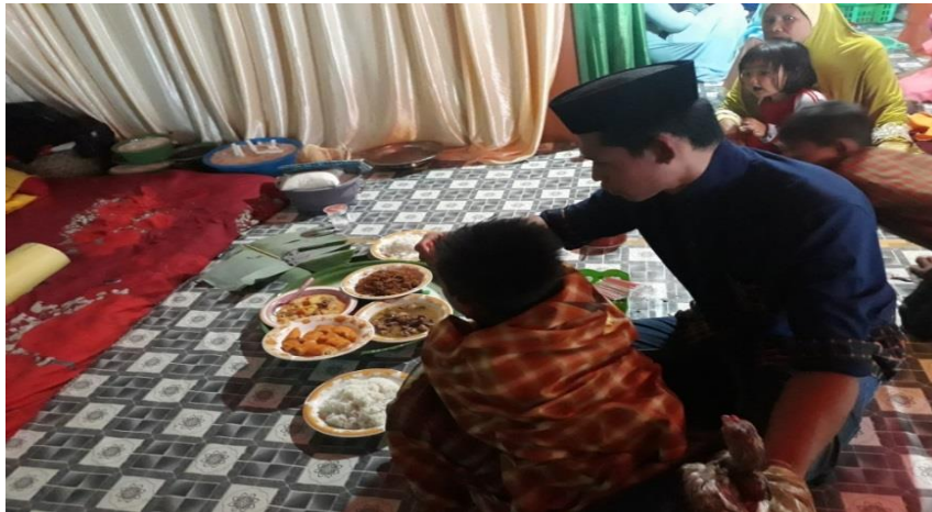
Gambar 5: pemberian makanan pada anak