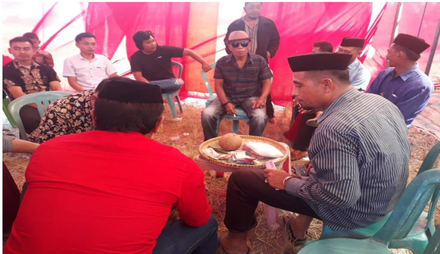
Gambar 10: ammuang (memberikan uang