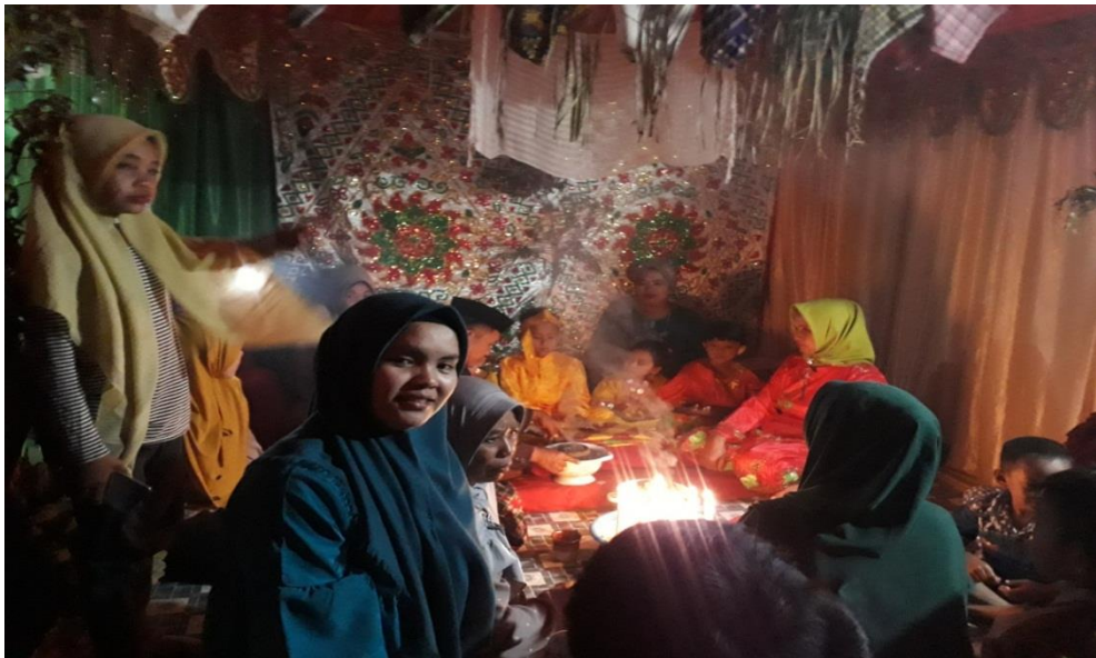
Gambar 2: Malam Mappacing