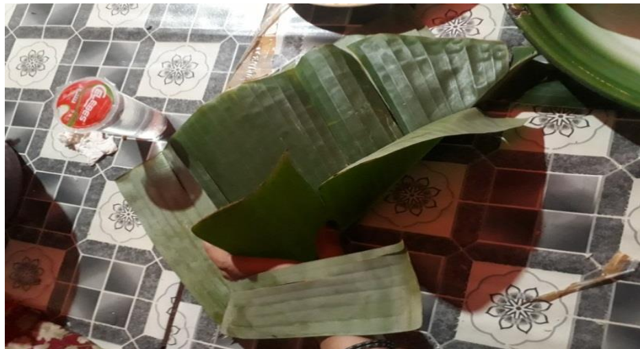
Gambar 6: ujung daung pisang

Dau pisang ini dipake pada saat proses pelaksanaan assunna yang diatas daun ini di taburkan abu. Daun pisang ini berfungsi sebagai pembungkus darah dan dan hasil potongan dari kelamin yang sudah dibersihkan, ketika sudah daun pisang dibungkus dan diikat dibawah anak tangga yang pertama ini adalah adat orang terdahu yang masih dilaksanakan sampai sekarang.