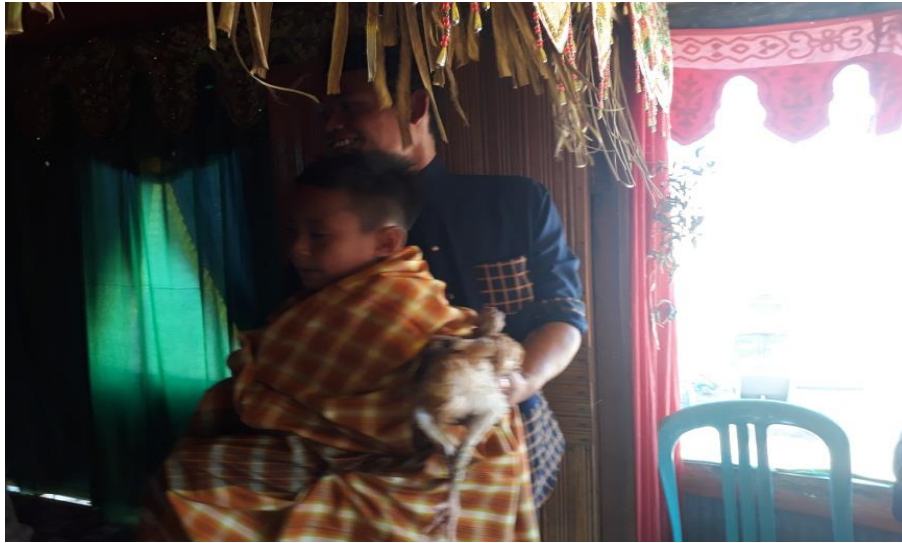
Gambar 9: anak diangkat 3 kali kea tap rumah