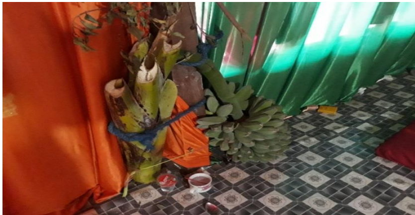
Gambar 1: pisang satu pohong