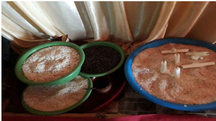
Gambar 3: beras empat macam

Beras empat macam ini juga disiapkan pada saat proses anggalara (Malam mapaccing) dan proses hari assunna' beras ini disebut kanre jajjakkang (makanan untuk sanro passunna') setelah proses assunna' beras empat macam ini dibawah kerumah anrong sanro kalau proses assunna sudah selesai. Beras ini ada empat macam yaitu beras ketang putih, beras ketang hitam, beras bakka (biasa) dan beras merah.