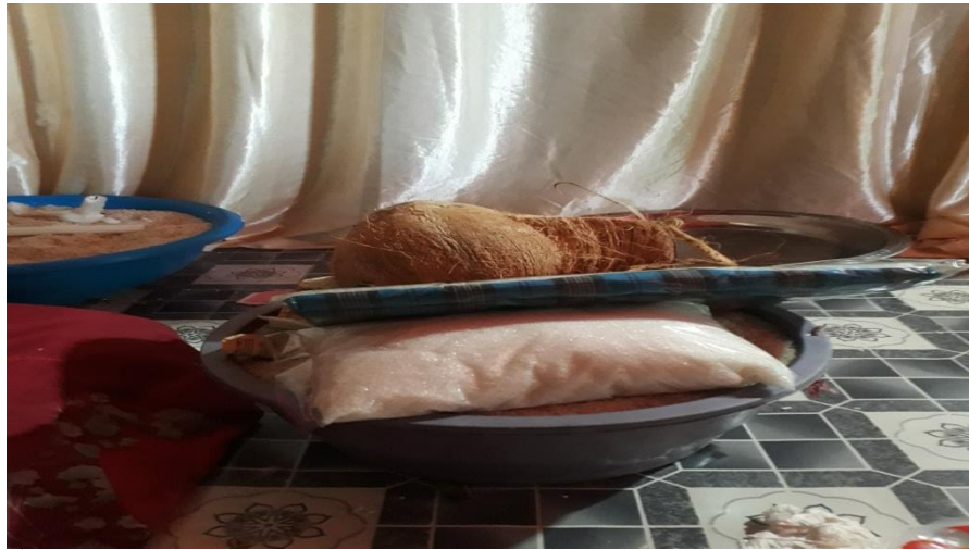
Gambar 4: Gula Beras Sarung dan Gula

Pada saat proses pelaksanaan assunna disiapkan juga seperti beras, kelapa, sarung dan gula ini juga jajjakang untu anrong sanro yang melakukan proses assunna atau malam anggalará' (malam mapaccing). Ini juga sebuah syarat-syarat proses pelaksanaannya ini diberikan untuk anrong sanro apabila proses pelaksanaan assunna sudah selesai.