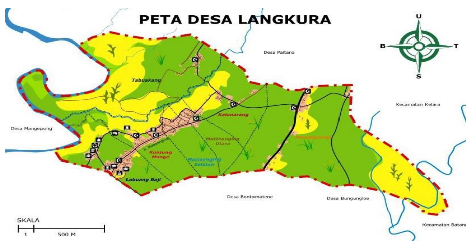
Gambar 1: Peta Desa Langkura

Kabupaten Jeneponto Memiliki 13 Kecamatan, salah satunya Kecamatan Turatea yang terbagi lagi menjadi 10 Desa yakni Desa Langkura, Desa Bontomate'ne, Desa Jombe, Desa Bungung Loe, Desa Parasangang Beru, Desa Tanjonga, Desa Jene Tallasa, Desa Bulu Loe, Desa Paitana.