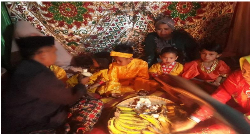
Gambar 2: Pisang empat macam

Sebelum proses anggalara ' (malam mapaccing) kita siapkan pisang empat macam yaitu unti manurung , unti te'ne , unti labbu , unti sanggarang . Empat pisang mengandung makna yaitu semoga umurnya lebih panjang dan dan rejekinya lebih mudah. Pisang ini diberikan pada anak untuk dimakan pada saat proses malam anggalara .