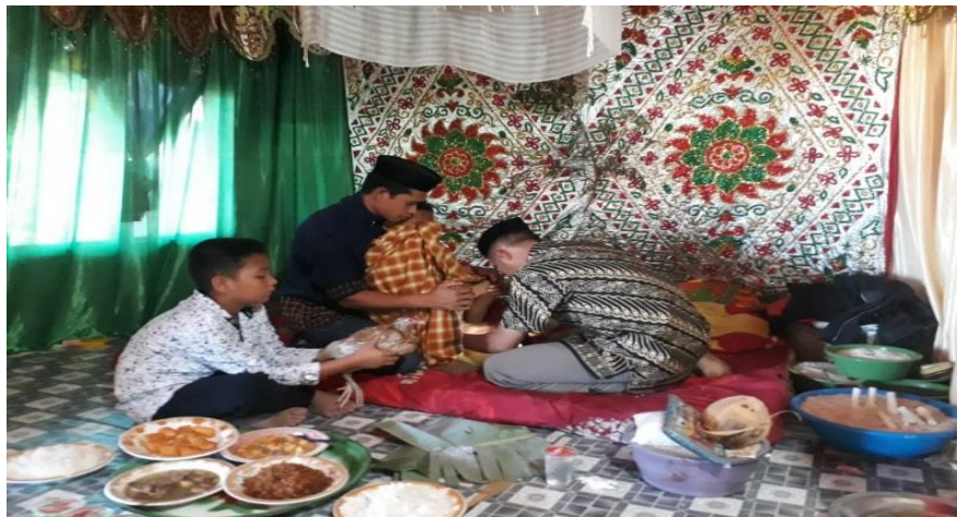
Gambar 8: proses pemotongan

Assunna tindakan pemotongan pada kelamin anak laki-laki dan perempuan pada saat usia sudah baliq dan pada saat pelaksanaan anak ini disuruh membaca dua kalimat syahadat sebelum melakukan proses assunna karena anak diajarkan bahwa sudah mengenal tuhan dan bisa menghargai orang yang lebih tua maupun teman sebayanya. Pada saat proses assunna banyak yang disiapkan seperti batang pisang, silet kedua alat ini berfungsi sebagai tempat duduk anak dan alat pemotong.