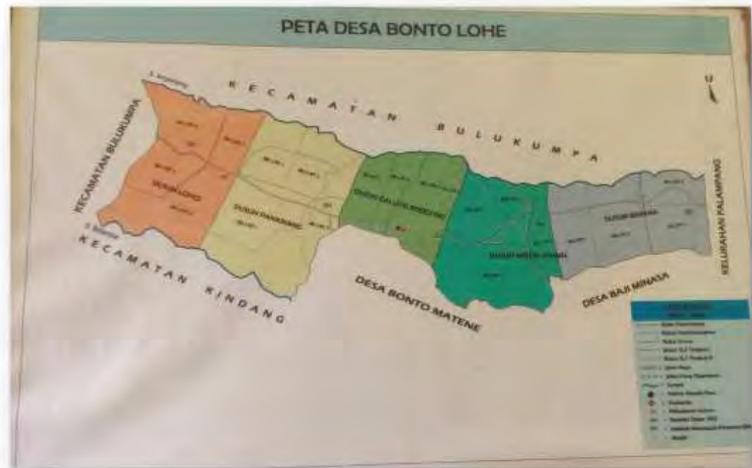
Peta Desa Bontolohe

Sumber data: Buku profil Desa Bontolohe Tahun 2018