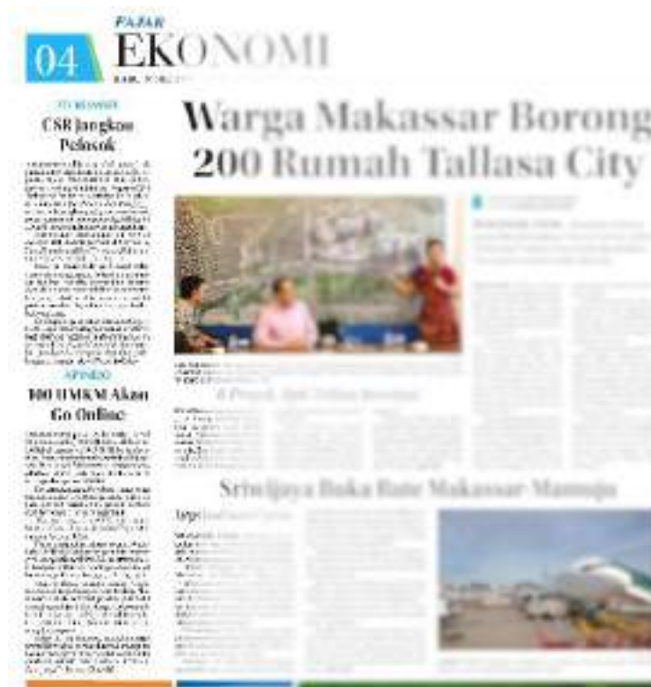
Gambar 2: Contoh berita kiri pada Rubrik Ekonomi

Seperti berita yang kiri pada gambar rubrik ekonomi berikut: (Lihat gambar 2).