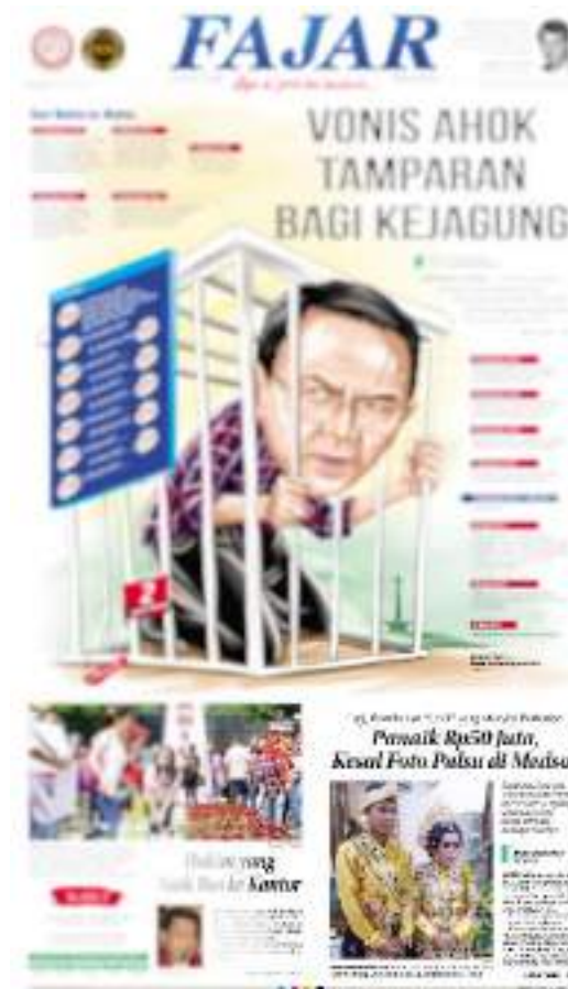
Gambar 3: Contoh Berita Box Pada Halaman Satu