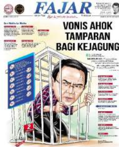
Gambar 4: Tampilan halaman satu Harian Fajar dengan menggunakan ilustrasi

Berikut adalah salah satu contoh halaman satu Harian Fajar dengan menggunakan ilustrasi: (Lihatgambar 4)