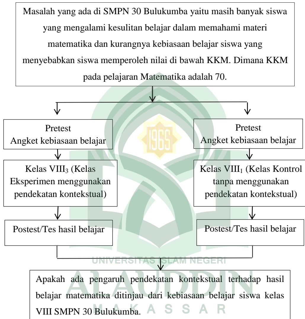
Gambar 1: Skema Hubungan Antar Variabel Penelitian

dengan menggunakan pendekatan kontekstual. Adapun kerangka pikir dalam penelitian ini sebagai berikut: