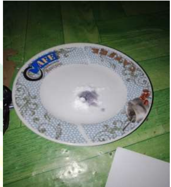
Hasil pengecekan garam menggunakan iodina test.