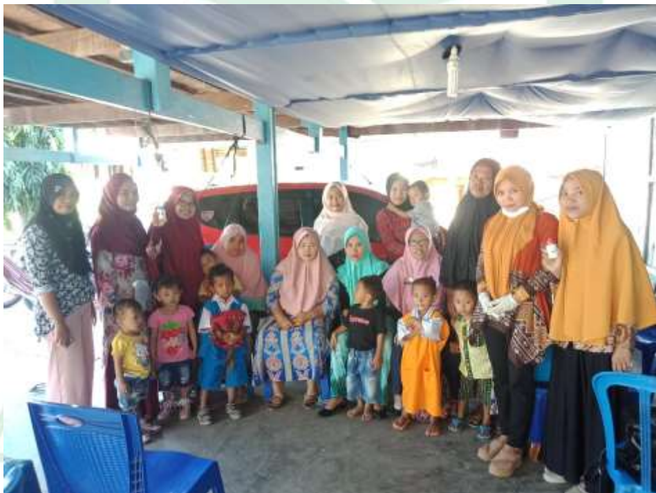
Foto bersama balita dan responden setelah balita diberikan kapsul vitamin A oleh petugas kesehatan setempat