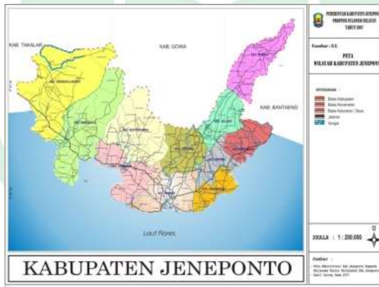
Gambar 4.1 Peta Kabupaten Jeneponto