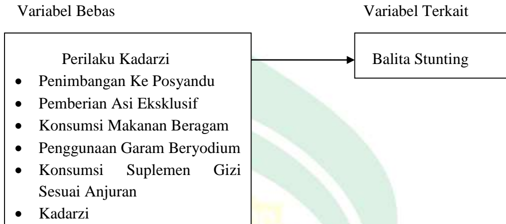
Gambar 2. Kerangka Konsep