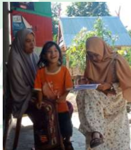
Peneliti sedang melakukan wawancara dengan ibu dari balita selaku Responden setelah anaknya diukur tinggi badannya.