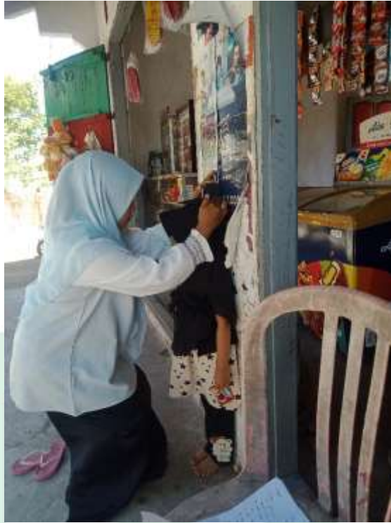
Tampak di atas kegiatan penelitian, peneliti sedang melakukan pengukuran tinggi badan pada balita di salahsatu rumah warga di desa Tarowang.