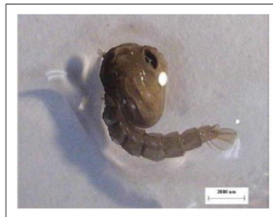
Gambar. 2.4 Pupa nyamuk Aedes aegypti

vertikal setengah lingkaran. Pupa bernafas melalui tabung pernafasan yang berbentuk seperti segitiga, tabung pernafasan ini merupakan ciri khas nyamuk Aedes aegypti (Christophers 1960). Lama stadium pupa menjadi nyamuk dewasa adalah satu sampai dua hari (Endang, 2008).