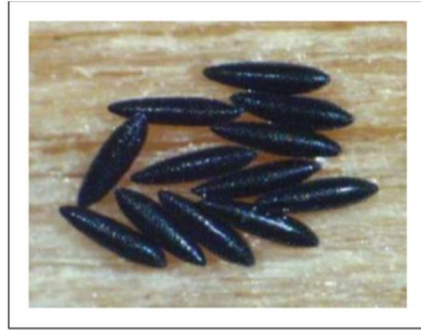
Gambar. 2.2 telur Nyamuk Aedes aegypti