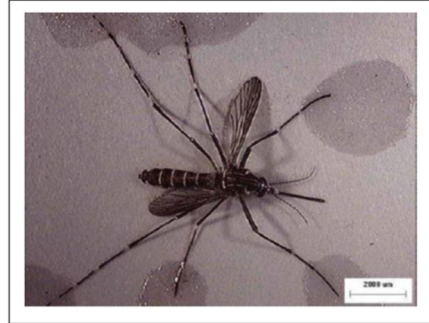
Gambar. 2.5 Nyamuk dewasa Aedes aegypti

antena terdapat diantara sepasang dua bola mata, yang pada nyamuk jantan berbulu lebat ( Plumose ) dan pada nyamuk betina berbulu jarang ( pilose ) (Aradilla, 2008)