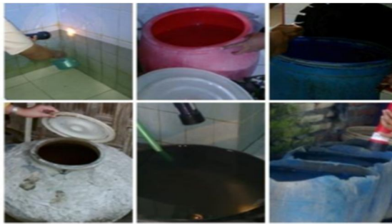
Gambar 2.1. Tempat hidup nyamuk Aedes aegypti

alami seperti lubang pohon, bambu, ketiak daun, dan tempurung kelapa merupakan habitat utama larva Aedes aegypti (WHO 2004). Perbedaan habitat antara Ae.aegypti tersebut menunjukkan adanya pemisahan ekologi, Aedes aegypti Asia lebih bersifat domestik dan endophagik daripada Aedes albopictus (Ishak, 2007).