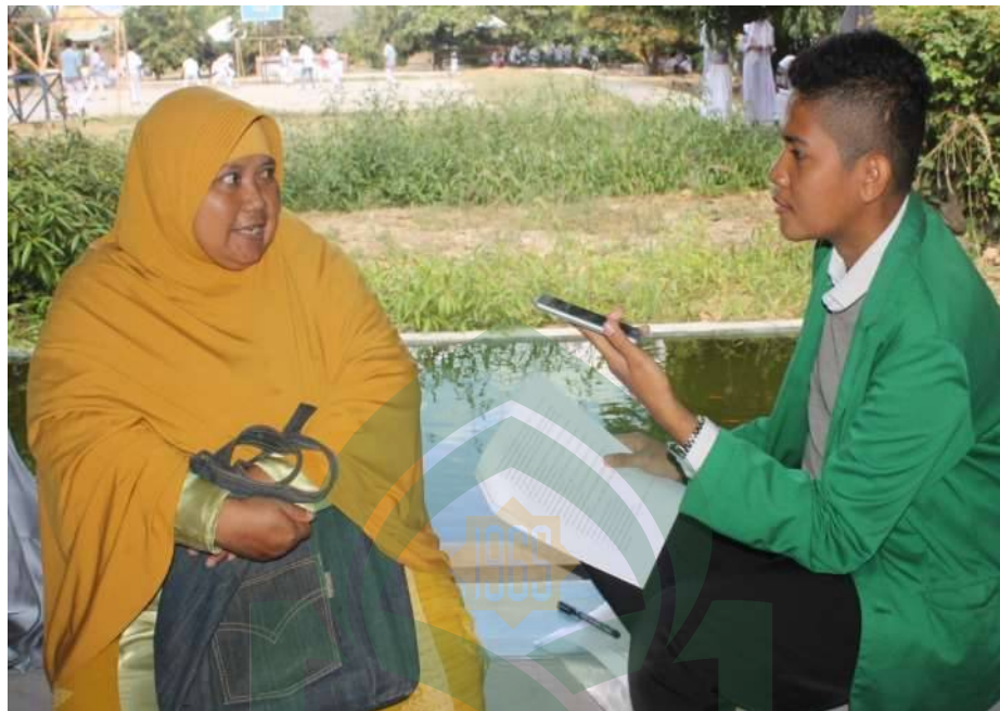
Wawancara dengan guru Pendidikan Agama Islam SMAN 1 Sape Kabupaten Bima