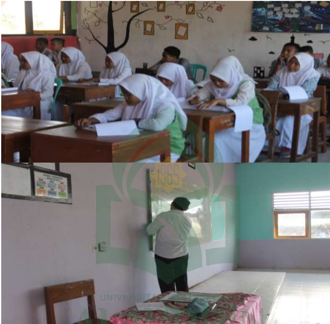
Dokumentasi Proses KBM Peserta Didik SMAN 1 Sape Kabupaten Bima