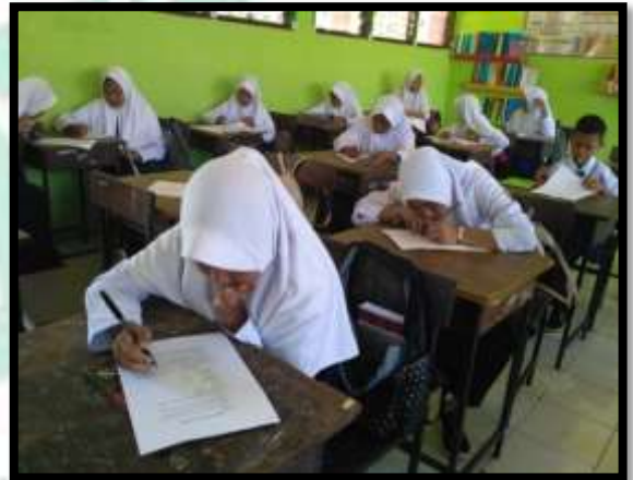
Gambar Pengisian Angket