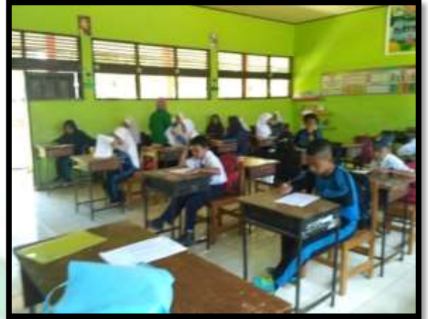
Gambar Pembagian Angket