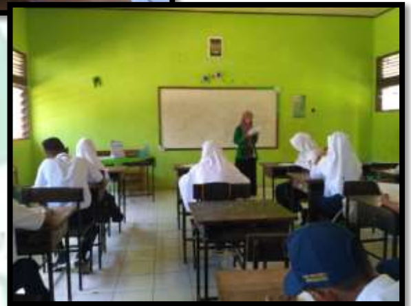
Menjelaskan Maksud Angket