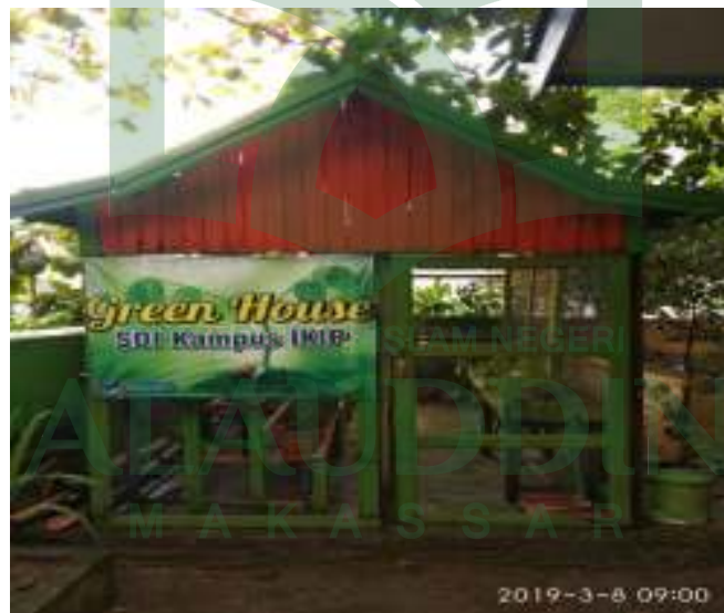
Green House SD Inpres Kampus IKIP