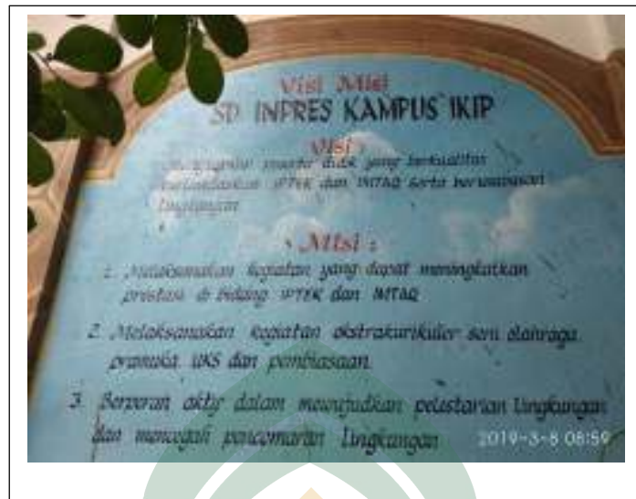
Visi misi SD INPRES KAMPUS IKIP Tidung Kota Makassar