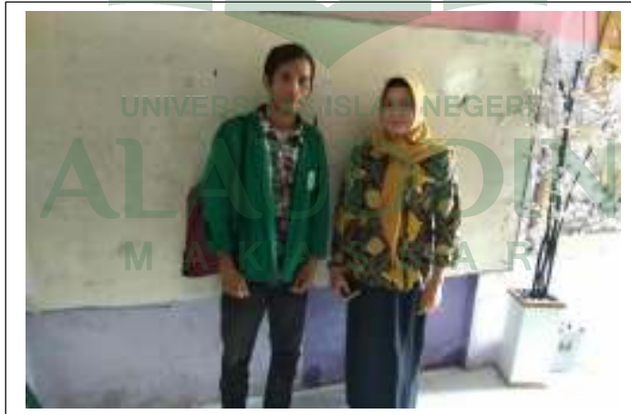
Foto bersama guru kelas III

Sebagian Peserta didik sedang mengerjakan tugas kelompok mereka di saat waktu istirahat, dan sebagian sementara bermain.