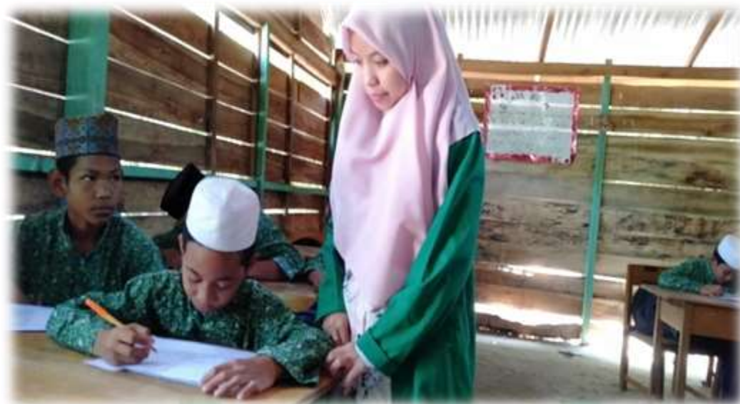
(Menjelaskan Maksud Angket dan Cara Mengisi Angket)