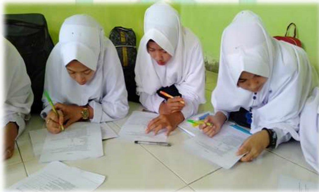
(Peserta Didik Mengisi Angket)