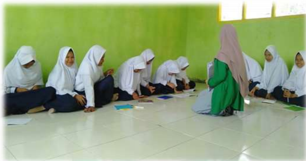
(Menjelaskan Maksud Angket dan Cara Mengisi Angket)