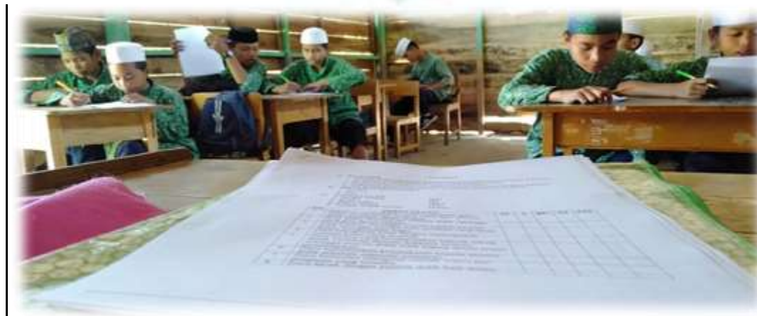
(Peserta Didik Mengisi Angket)