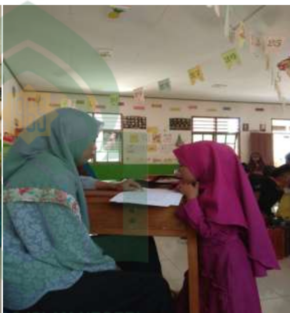
Dokumentasi Kegiatan Peserta Didik