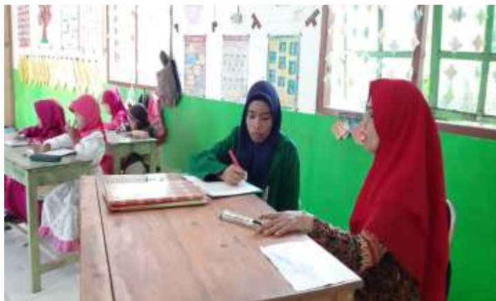
Dokumentasi Tes Peserta didik Kelas I