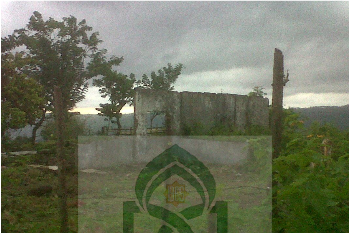
Tempat Ibadah Umat Kristen Di Sicihi Sekarang