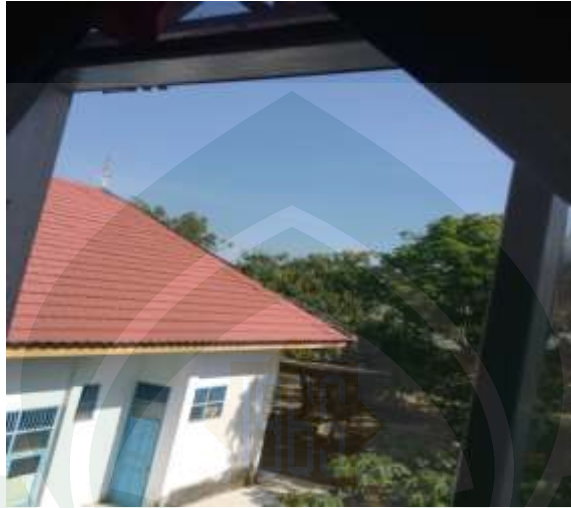
Rusaknya sarana perpustakaan yang menyebabkan perlu dilakukan preservasi (Jendela tampak dekat)