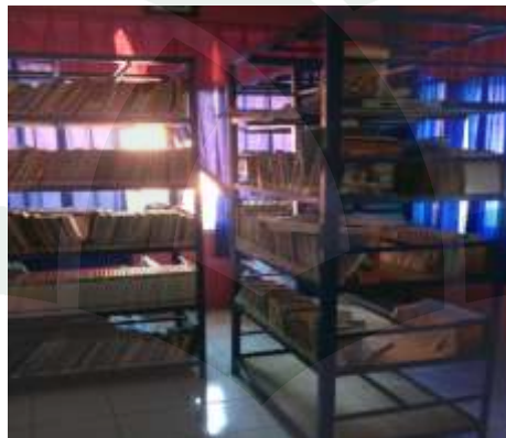
UNIVERSITAS ISLAM NEGERI Koleksi Bahan Pustaka di Ruang Layanan Baca