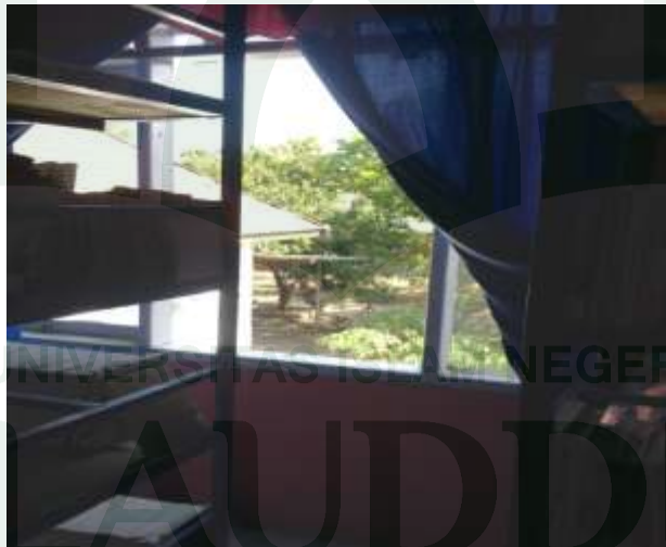
Jendela tampak dari jauh