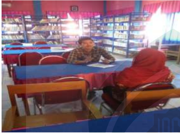
Penulis saat mewawancarai informan (petugas)