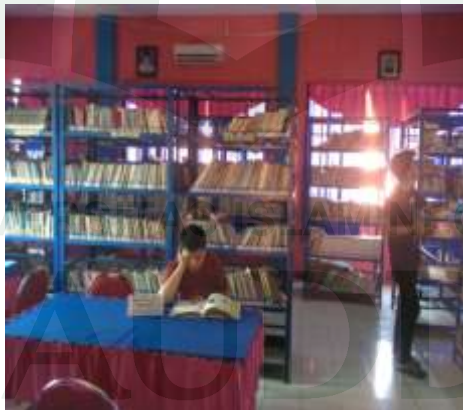
Pemustaka sedang memanfaatkan koleksi