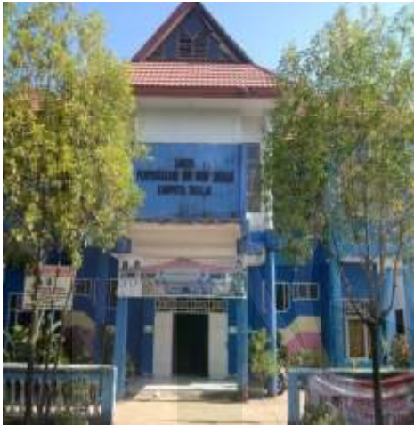
Kantor Perpustakaan dan Arsip daerah (tampak depan)