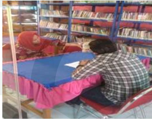
Informan saat menjelaskan kegiatan preservasi