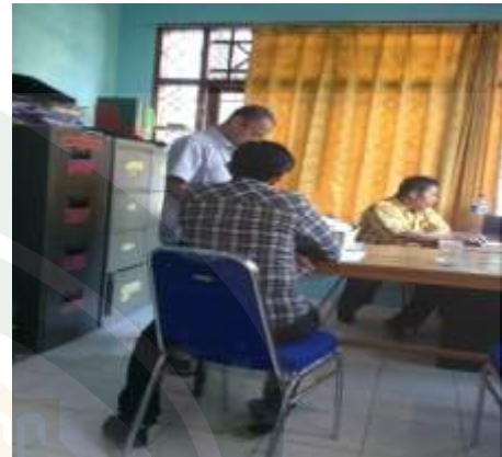
Informan saat diwawancarai