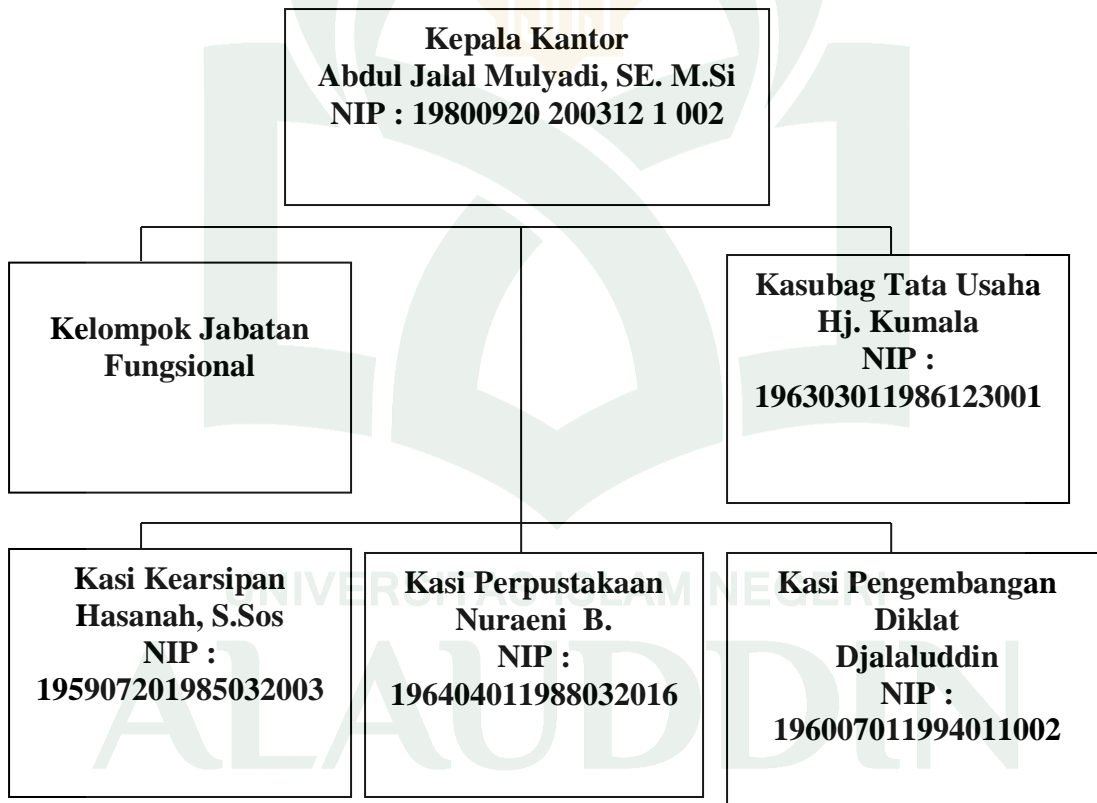
Gambar 4.1. Struktur Organisasi Kantor Perpustakaan dan Arsip Daerah Kab. Takalar

Struktur organisasi adalah pola formal tentang bagaimana orang dan pekerjaan dikelompokkan. Adapun Struktur Organisasi Kantor Perpustakaan dan Arsip Daerah Kab. Takalar periode 2016 sebagai berikut: