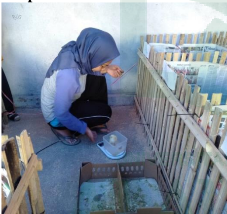
7.3 Penimbangan Bobot Badan Doc Hari Pertama