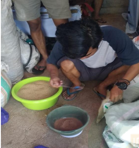
7.1 Pengukuran Bubuk Daun Cengkeh untuk ditambahkan pada Pakan