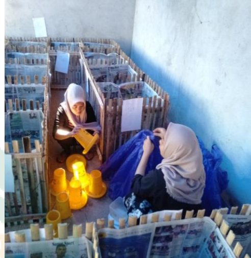
7.2 Pencampuran Pakan dengan Bubuk Daun Cengkeh