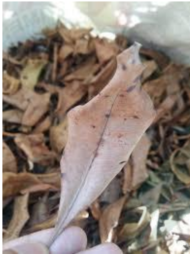
8.1 Daun Cengkeh Kering