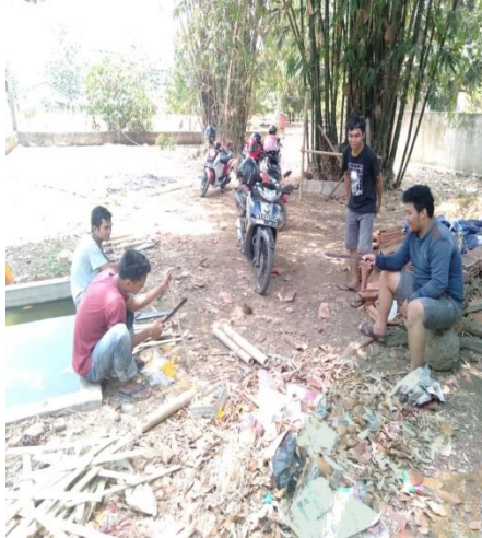
6.1 Pembuatan Sekat kandang