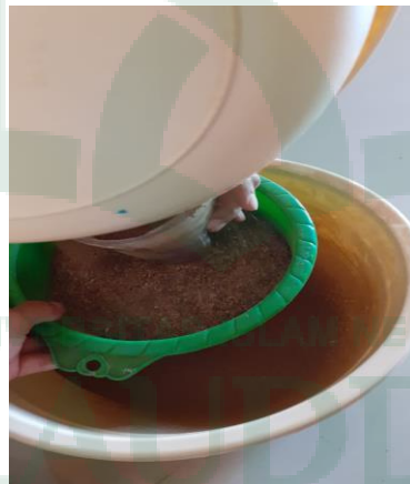
8.3 Pengayakan Bubuk Daun Cengkeh