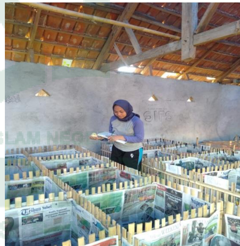
6.4 Pemberian Koran pada Dinding Sekat Kandang