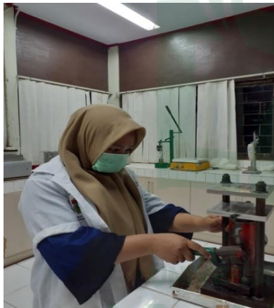
9.3 Uji Daya Ikat Air