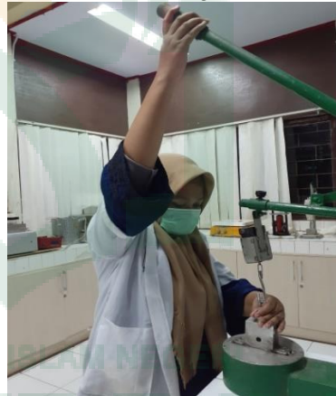
9.4 Uji Keempukan (Daya Putus Daging)