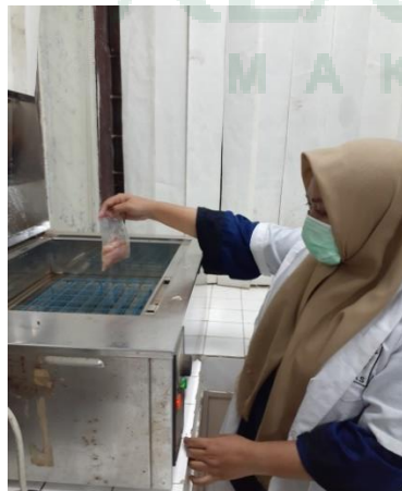
9.5 Uji Susut Masak