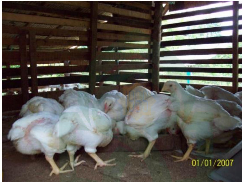
Gambar 2. Broiler

Ayam pedaging adalah jenis ternak bersayap dari kelas aves yang telah didomestikasikan dan cara hidupnya diatur oleh manusia dengan tujuan untuk memberikan nilai ekonomis dalam bentuk daging yang umumnya dipanen pada umur 4-5 minggu (Yuwanta, 2004).