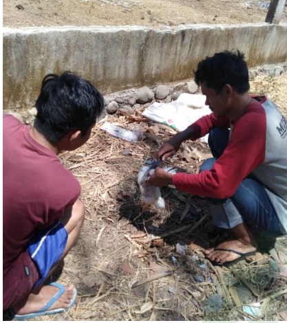
9.1 Penyembelihan Ayam Broiler