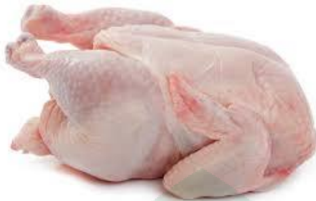
Gambar 3. Daging Broiler

Prosedur pemotongan yang sesuai diikuti dengan pengkarkasan yang tepat dan dilanjutkan dengan “ aging ” (maturasi) yang layak dengan waktu yang optimal merupakan salah satu rangkaian yang seharusnya tak terpisahkan dalam penanganan pascapanen. Pascapanen yang tepat sesuai dengan yang seharusnya pada pengadaan daging segar dan produk olahannya akan meningkatkan mutu produk tersebut sekaligus nilai jual yang lebih tinggi.