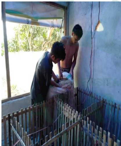
6.3 Pemberian Sekam setiap Sekat Kandang