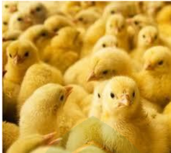
Gambar. 1. DOC Broiler

Untuk bibitnya (DOC), berbagai macam strain ayam ras pedaging yang telah beredar di pasaran, sehingga peternak tidak perlu risau dalam menentukan pilihannya. Sebab semua jenis strain yang telah beredar memiliki daya produktifitas relatif sama. Artinya seandainya terdapat perbedaan, perbedaannya tidak menyolok atau sangat kecil sekali. Dalam menentukan pilihan strain apa yang akan dipelihara, peternak dapat meminta daftar produktifitas atau prestasi bibit yang dijual di Poultry Shop. Adapun jenis strain ayam ras pedaging yang banyak beredar di pasaran adalah: Super 77, Tegel 70, ISA, Kim cross, Lohman 202, Hyline, Vdett, Missouri, Hubbard, Shaver Starbro, Pilch, Yabro, Goto, Arbor acres, Tatum, Indian river, Hybro, Cornish, Brahma, Langshans, Hypeco-Broiler, Ross, Marshall”m”, Euribrid, A.A 70, H&N, Sussex, Bromo, CP 707 (Pramudyati, 2009). Ayam ras pedaging disebut juga Broiler, yang merupakan jenis ras unggulan hasil persilangan dari bangsa-bangsa ayam yang memiliki daya produktivitas tinggi, terutama dalam memproduksi daging ayam.