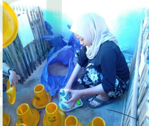
7.4 Pemberian Pakan yang ditambahkan Bubuk Daun Cengkeh