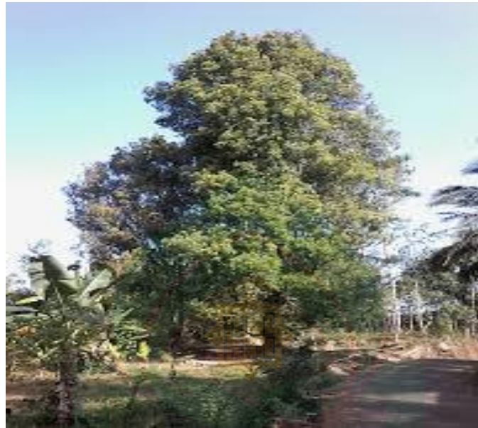
Gambar 4. Pohon Cengkeh

khas dihasilkan oleh senyawa eugenol , yang merupakan senyawa utama (72-90%).