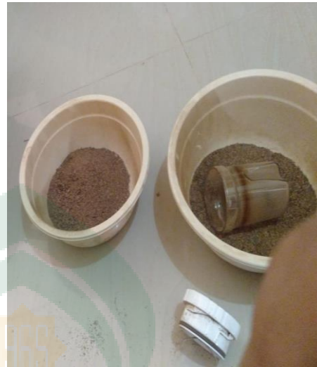
8.2 Penepungan Bubuk Daun Cengkeh dengan Blender