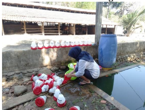
7.5 Pemberian Air Minum