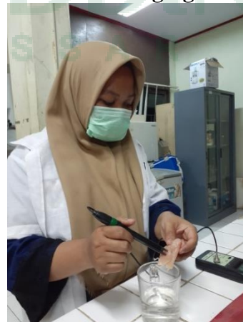
9.6 Uji pH