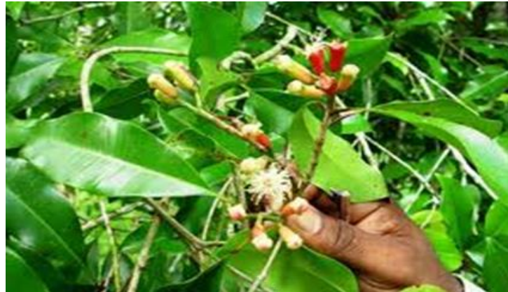
Gambar 5. Daun Cengkeh

Cengkeh termasuk suku Myrtaceae yang banyak ditanam di beberapa negara termasuk Indonesia. Tanaman ini berpotensi sebagai penghasil minyak atsiri. Minyak cengkeh dapat diperoleh dari bunga cengkeh ( Clove Oil ), tangkai atau gagang bunga cengkeh ( Clove Steam Oil ) dan dari daun cengkeh ( Clove Leaf Oil ). Kandungan minyak atsiri di dalam bunga cengkeh mencapai 21,3% dengan kadar eugenol antara 78-95%, dari tangkai atau gagang bunga mencapai 6% dengan kadar eugenol antara 89-95%, dan dari daun cengkeh mencapai 2-3% dengan kadar eugenol antara 80-85%. Kandungan terbesar minyak cengkeh adalah eugenol , yang bermanfaat dalam pembuatan vanili, eugenil metil eter , eugenil asetat , dll. Vanili merupakan bahan pemberi aroma pada makanan, permen, coklat dan parfum. Bunga cengkeh juga digunakan sebagai bahan baku pembuatan rokok (Saiful, 2012).