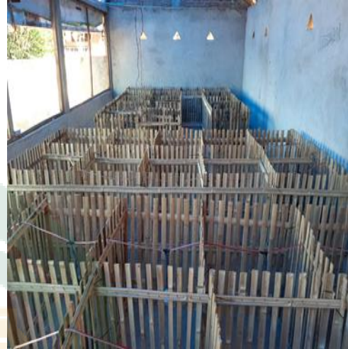
6.2 Kandang Persekat dan Lampu setiap Sekat