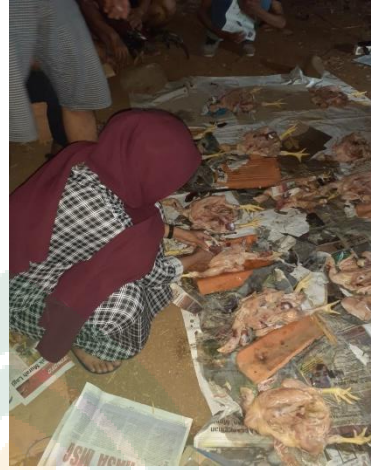
9.2 Pengambilan Daging Dada untuk diuji Kualitas