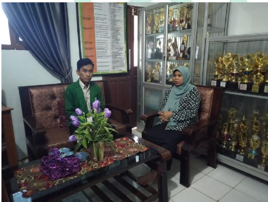
Kepalasekolah MTs As'adiyahPuteri 1 Sengkang