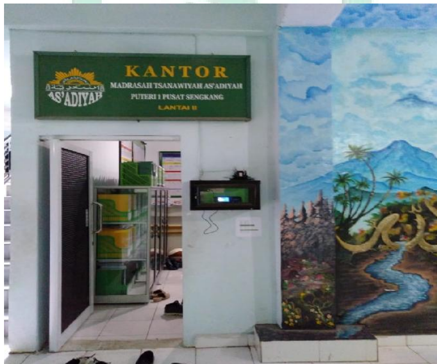
Kantor MTs As'adiyah Puteri 1 Sengkang