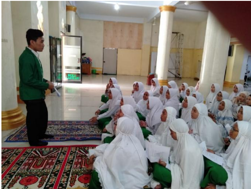
Menjelaskan cara pengisian angket