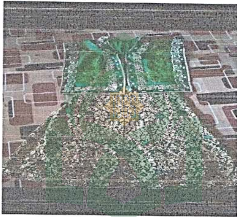
Gambar 1 : Pakaian Adat Pengantin Mempelai Wanita