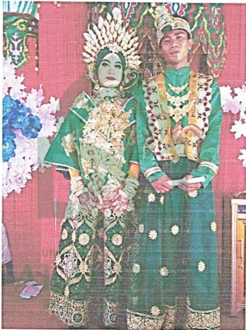
Gambar 22 : Kedua Mempelai Dengan Pakaian Adat Modern