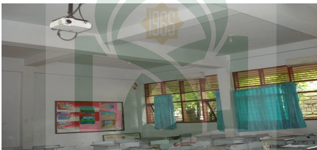
RUANGAN KELAS SMP NEGERI 6 KOTA MAKASSAR