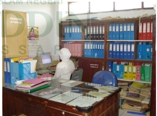
RUANGAN TATA USAHA SMP NEGERI 6 KOTA MAKASSAR