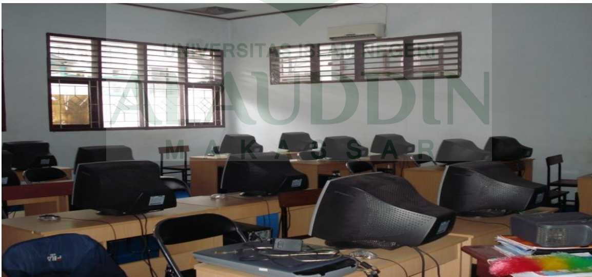
LABORATORIUM KOMPUTER DI SMP NEGERI 6 KOTA MAKASSAR