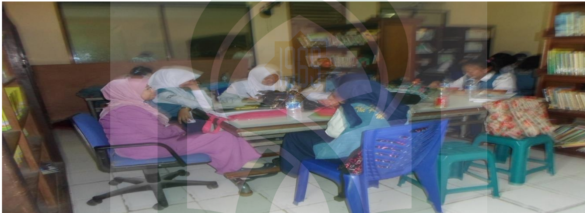
PERPUSTAKAAN DI SMP NEGERI 6 KOTA MAKASSAR