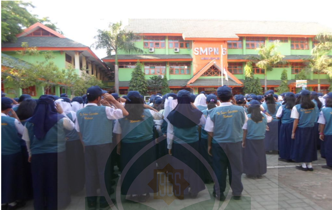
Kegiatan upacara Bendera rutin dilaksanakan setiap hari senin di SMP Negeri 6 Kota Makassar