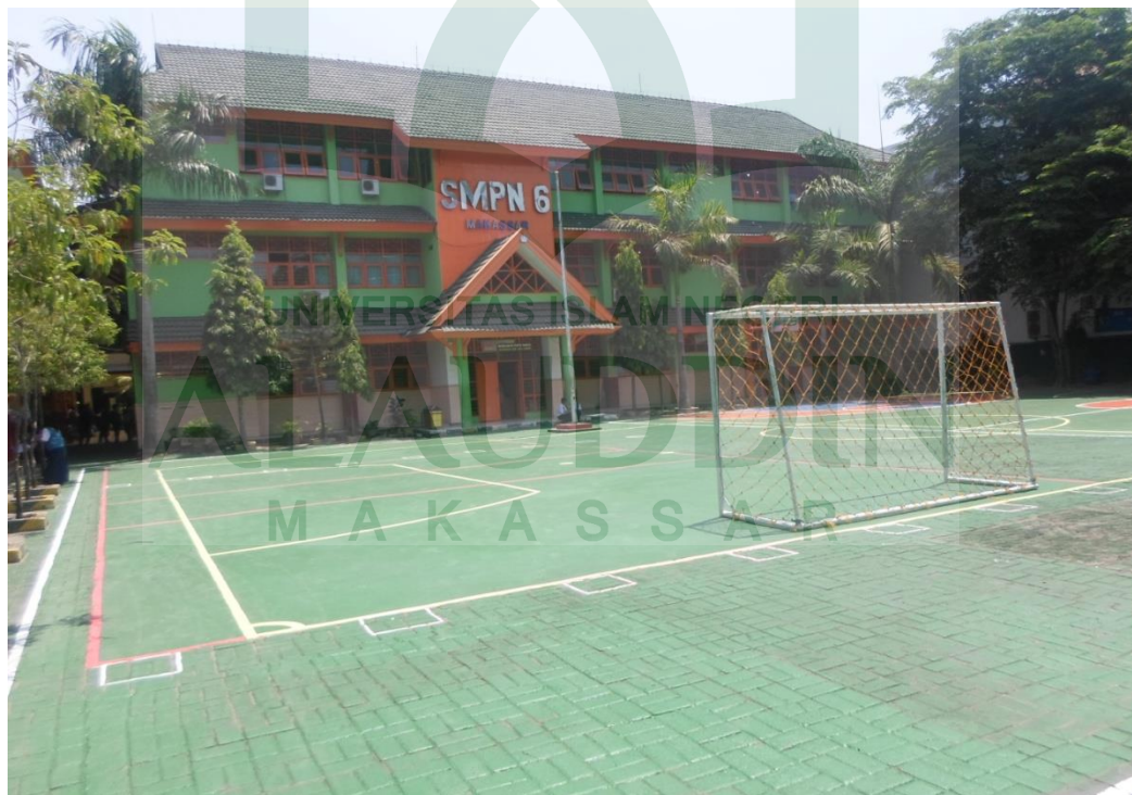
Halaman depan SMP Negeri 6 Kota Makassar