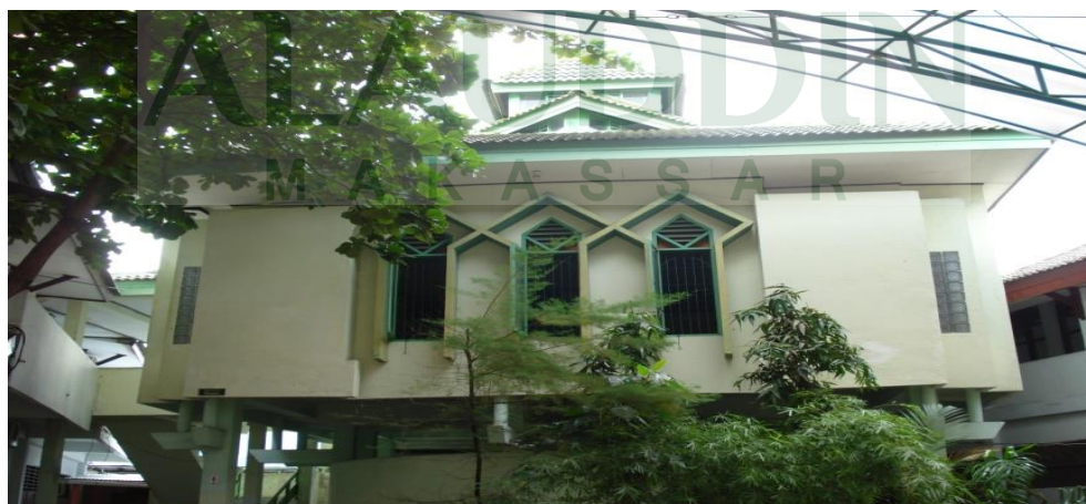
MUSHALLAH DI SMP NEGERI 6 KOTA MAKASSAR