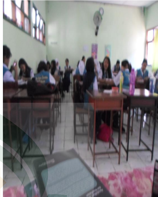
Proses Pembelajaran Pendidikan Agama Islam dan Budi Pekerti dalam ruang kelas VII F dan Idi SMP Negeri 6 Kota Makassar