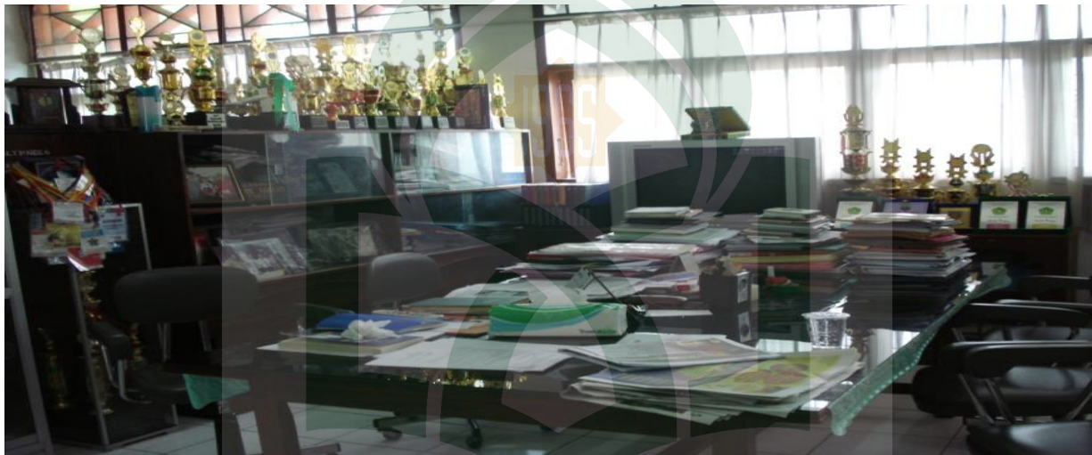
RUANGAN KEPALA SEKOLAH SMP NEGERI 6 KOTA MAKASSAR