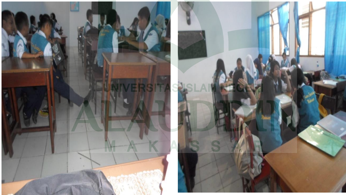
Proses pembelajaran Pendidikan Agama Islam dan Budi pekerti dalam ruang kelas VII A di SMP Negeri 6 Kota Makassar