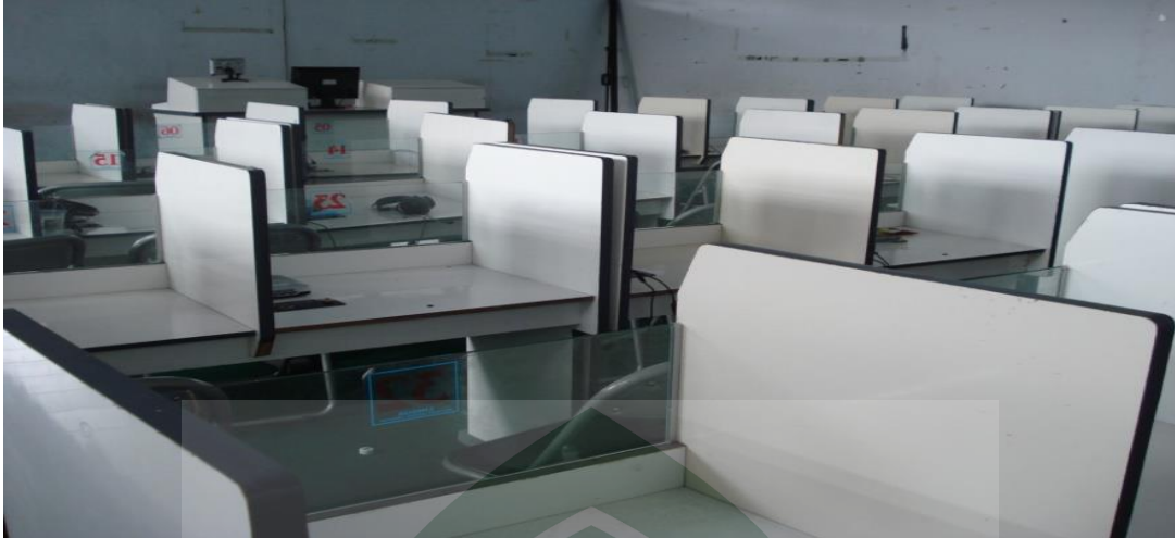
LABORATORIUM BAHASA DI SMP NEGERI 6 KOTA MAKASSAR