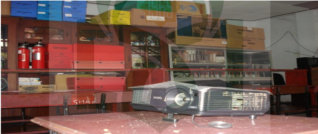
LABORATORIUM MIPA DI SMP NEGERI 6 KOTA MAKASSAR