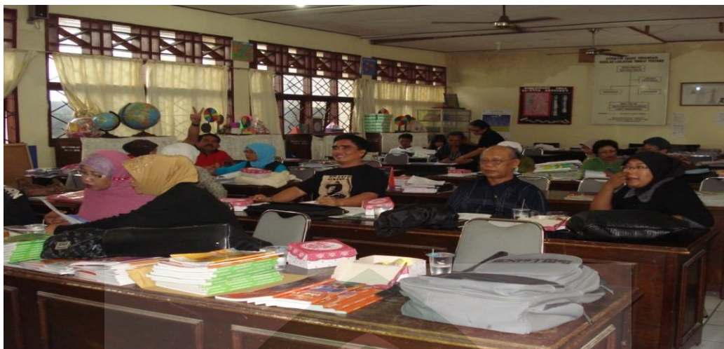
RUANGAN GURU SMP NEGERI 6 KOTA MAKASSAR