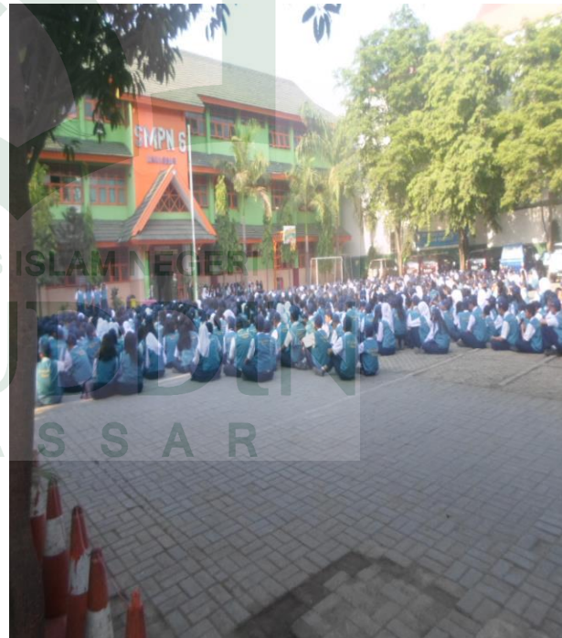
Penyampaian beberapa pengumuman dilakukan oleh pihak SMP Negeri 6 Kota Makassar