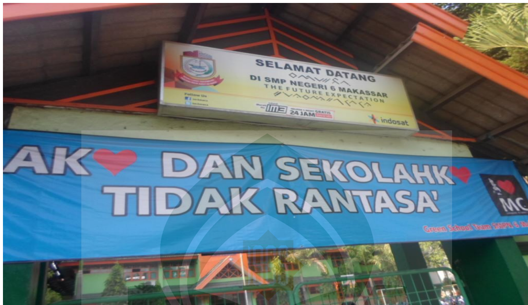
Gerbang SMP Negeri 6 Kota Makassar