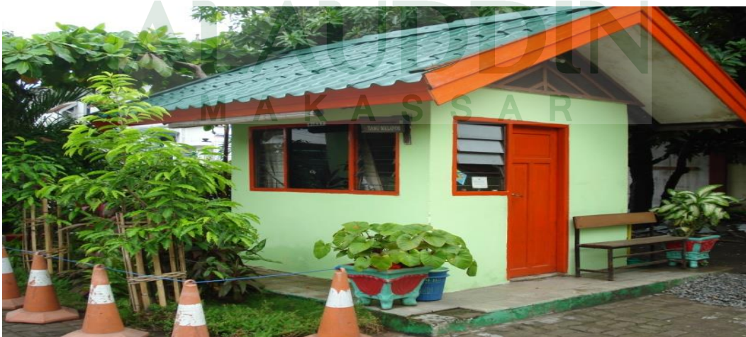
POS JAGA/SECURITY DI SMP NEGERI 6 KOTA MAKASSAR