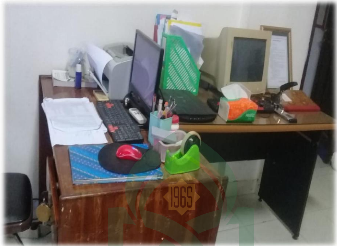
Gambar 10 : Tempat Sirkulasi