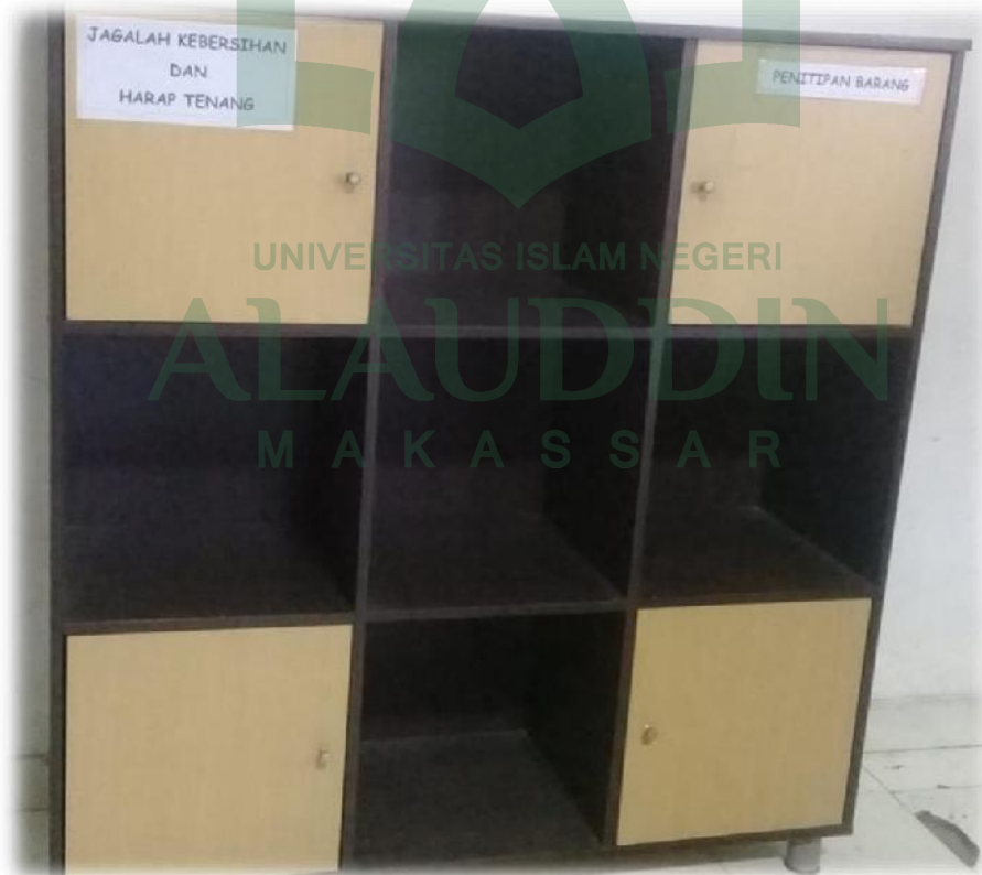
Gambar 9 : Tempat Penitipan Tas