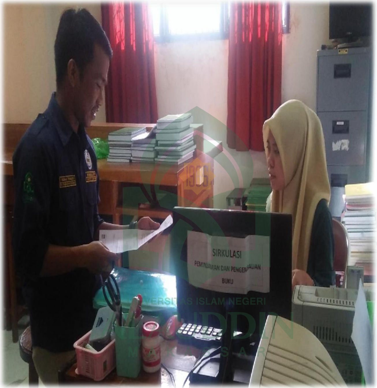
Gambar 3 : Penulis Bersama Dengan Pengelola Perpustakaan Sekolah Tinggi Ilmu Kesehatan Gema Insan Akademik Makassar