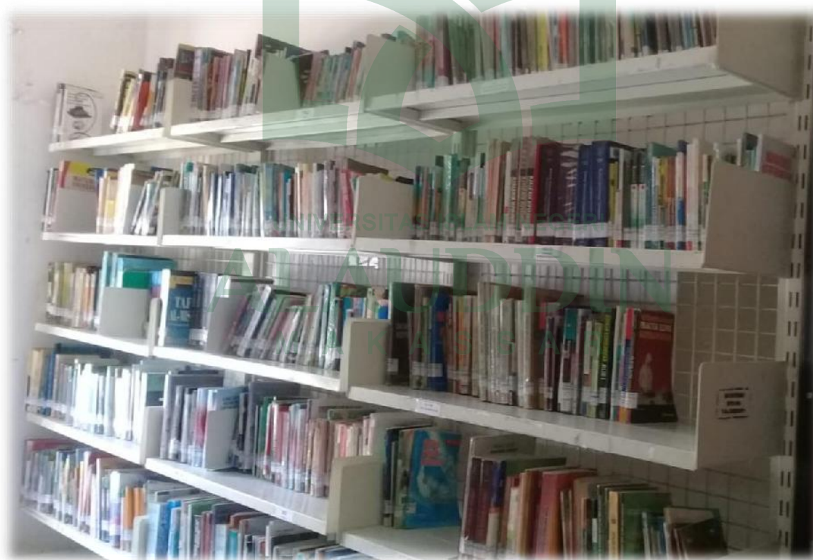
Gambar 6 & 7 : Koleksi Umum