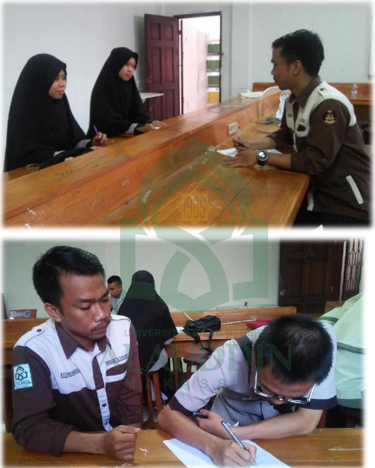
Gambar 1 & 2 : Proses wawancara dengan beberapa pemustaka