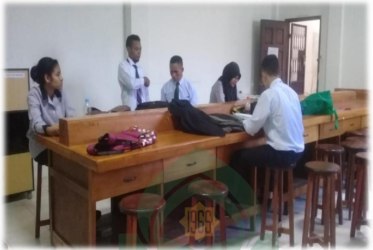
Gambar 8 : Pemustaka