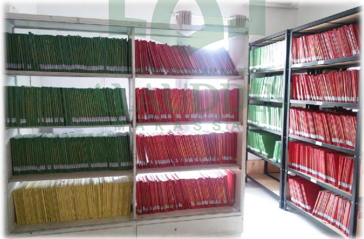
Gambar 4 & 5 : Koleksi Khusus