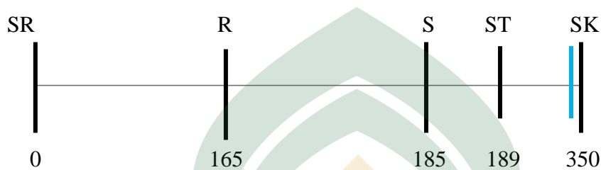
Bagan rentang skor tingkat pemanfaatan jurnal oleh mahasiswa STKIP Muhammadiyah Bulukumba

Berdasarkan rentang skor tersebut diperoleh tingkatan jawaban responden terhadap tingkat pemanfaatan jurnal oleh mahasiswa STKIP Muhammadiyah Bulukumba. Hal ini dapat dibuat kategori sebagai berikut: