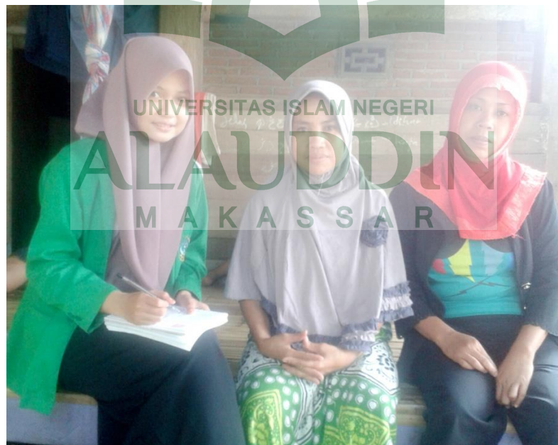
Wawancara dengan anggota bimbingan.