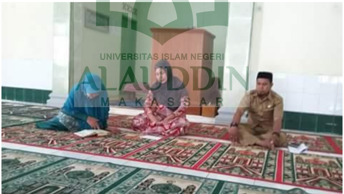
Pengajian sekaligus bimbingan kelompok