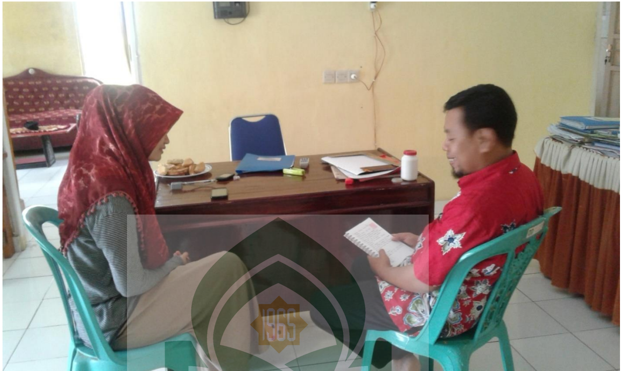
Wawancara dengan fungsional penyuluh