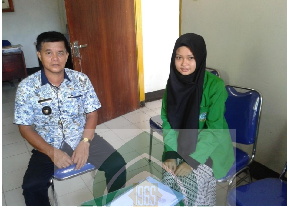
Setelah wawancara dengan kepala Desa Manjalling