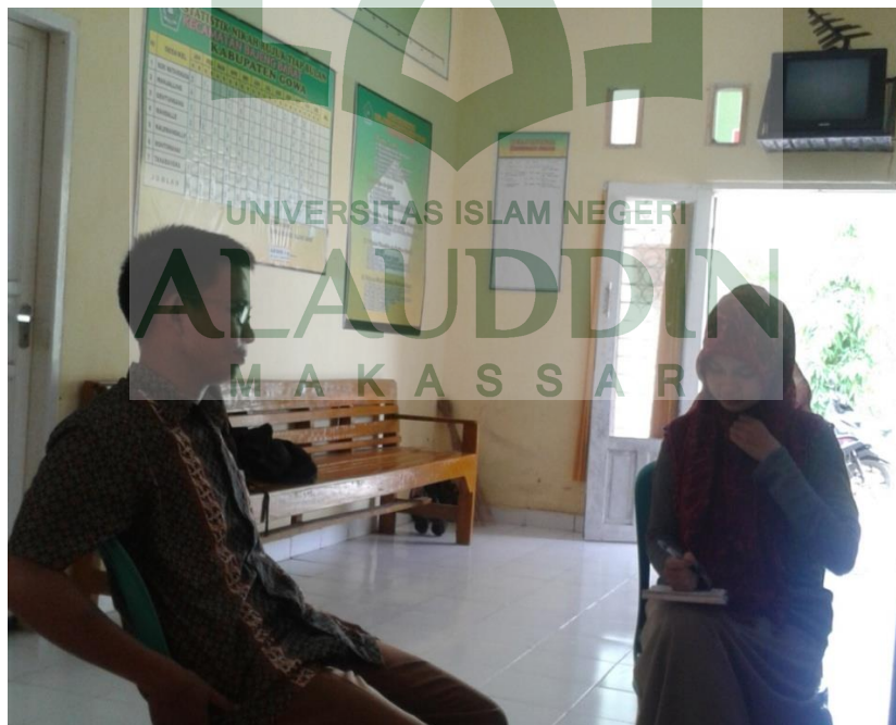
Wawancara dengan fungsional penyuluh