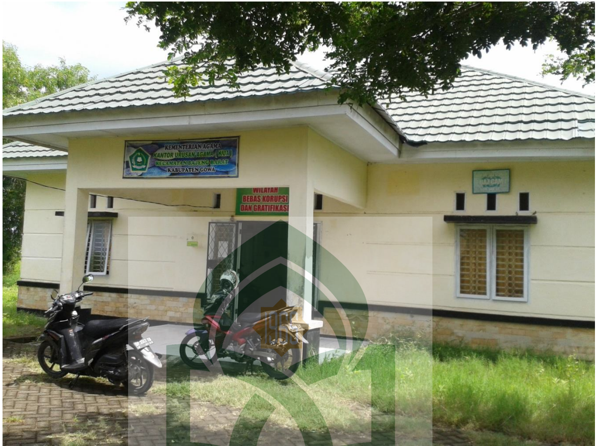
Tampilan depan Kantor Urusan Agama (KUA) Kecamatan Bajeng Barat