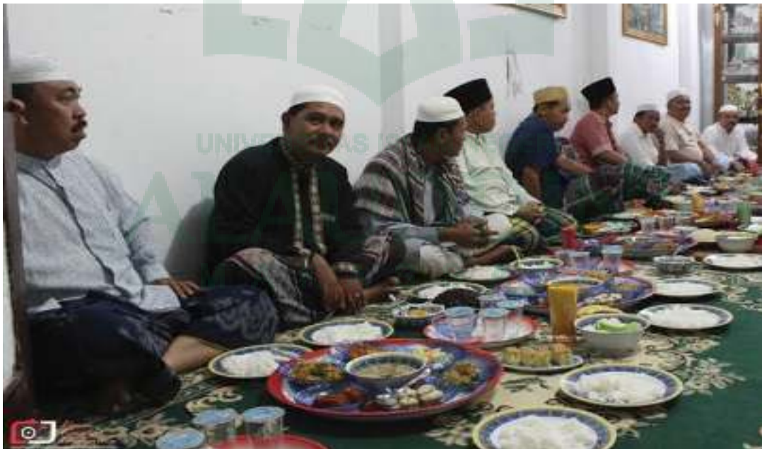
setelah pembacaan do'a dan makan bersama