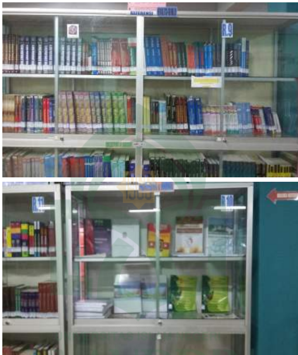
Gambar 4, Koleksi Referensi