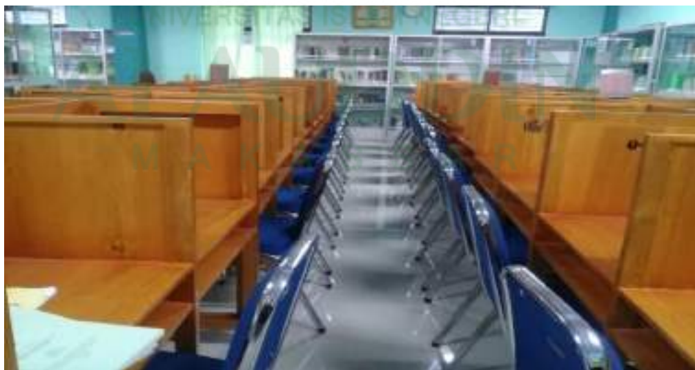
Gambar 1, Ruang Baca Perpustakaan STIKES Mega Rezky Makassar