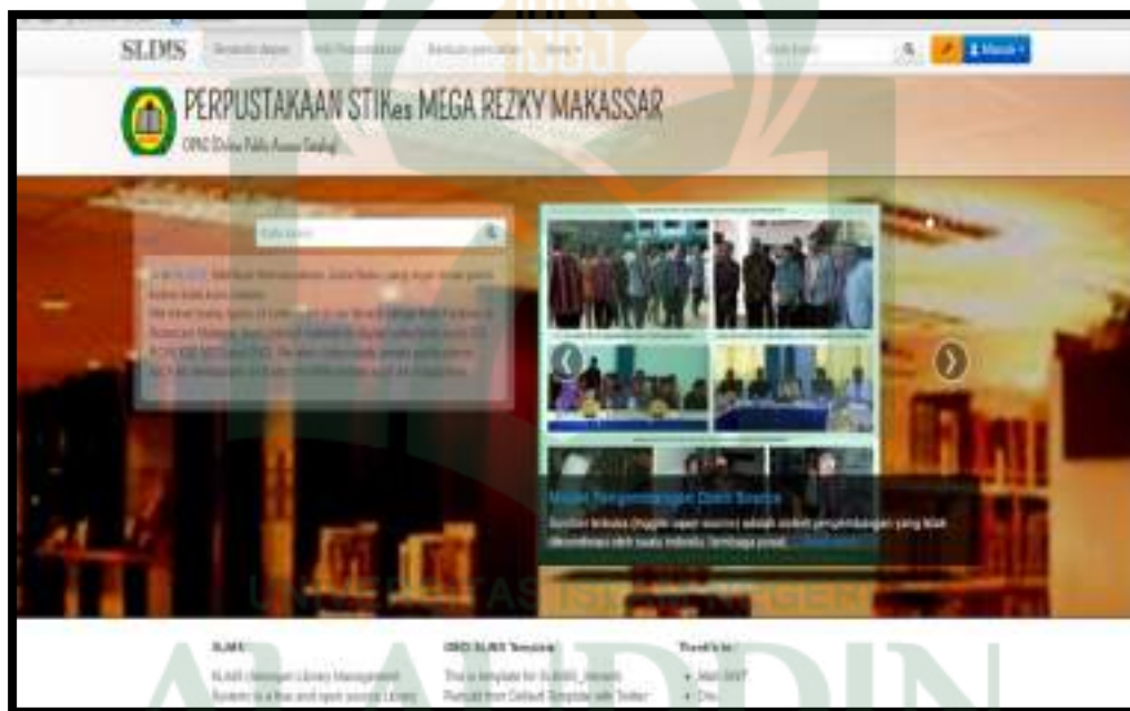
Gambar 2. Penelusuran informasi menggunakan fasilitas internet

Pada perpustakaan STIKES Mega Rezky, komputer digunakan sebagian besar untuk sistem layanan penelusuran informasi, baik secara online maupun yang masih bersifat terbatas komputer sebagian besar digunakan untuk pengolahan data, baik data teks, angka maupun informasi lengkap. Namun demikian, tampaknya pada bidang pengolahan data penelusuran informasi di perpustakaan-perpustakaan ialah program-program paket pengolah data.