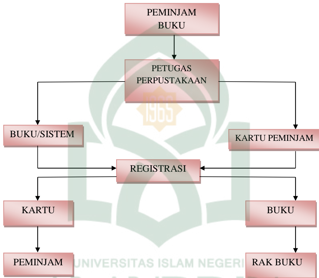
Tabel 2: Prosedur pengembalian buku

Sumber data: perpustakaan Stikes Mega Rezky makassar