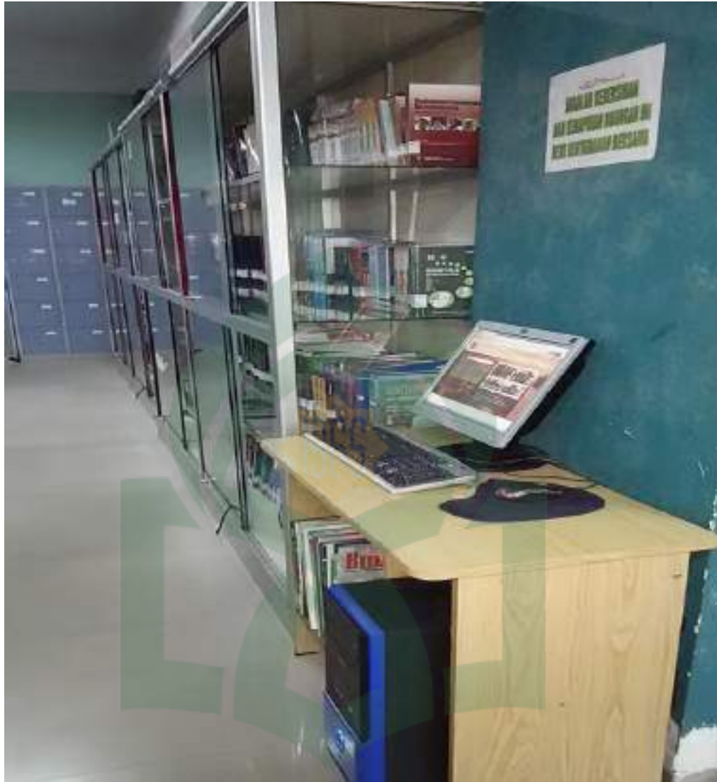
Gambar 5, OPAC ( Online Public Accesses Catalog )

UNIVERSITAS ISLAM NEGERI ALAUDDIN M A K A S S A R