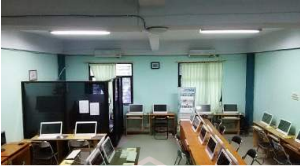
Gambar 2, Lab. Komputer