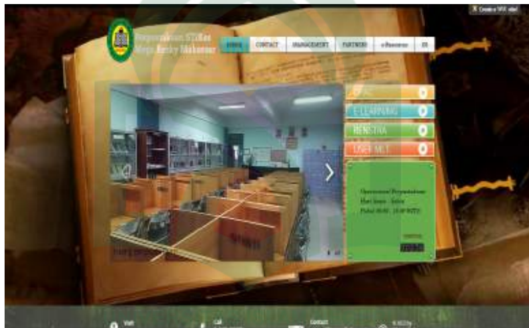
Gambar 6, Website perpustakaan Stikes Mega Rezeky Makassar