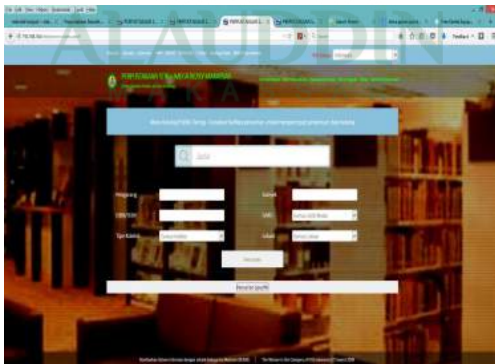
Gambar 1. Interface OPAC (Online Public Access Catalog)

Untuk membantu penelusuran informasi, perpustakaan menyediakan 2 unit komputer sebagai fasilitas OPAC yang terletak dua di bagian sirkulasi. Untuk menemukan koleksi di rak, pemustaka sebaiknya menggunakan OPAC agar dapat menemukan informasi dengan cepat, tepat dan efisien. Pada penelusuran lewat OPAC pemustaka dapat memasukkan judul buku, nama pengarang, kata kunci atau subjek dari dokumen yang sedang dicari lewat kotak pencarian yang telah disediakan dalam OPAC.