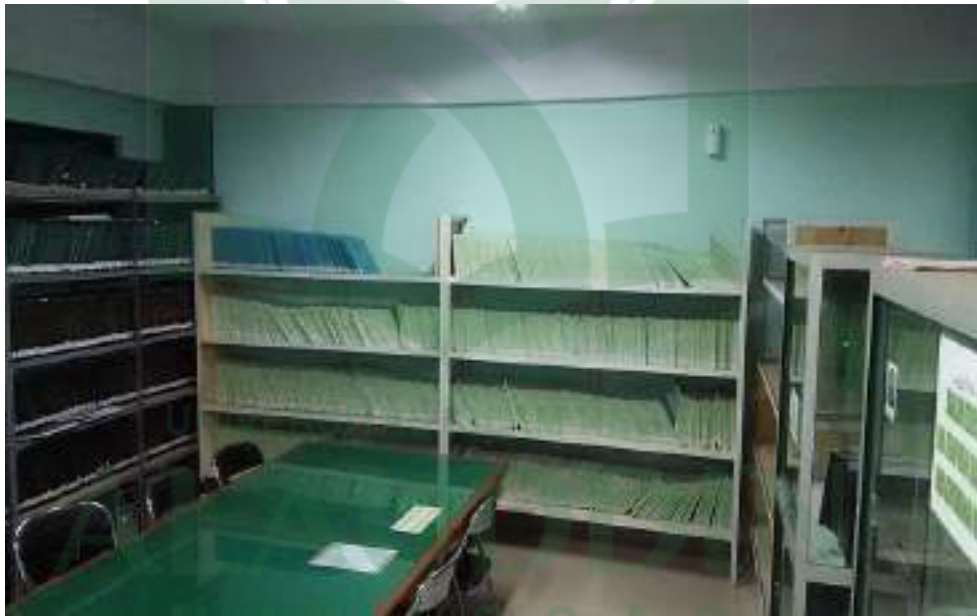
Gambar 3, Ruang Karya Tulis Ilmiah/Skripsi