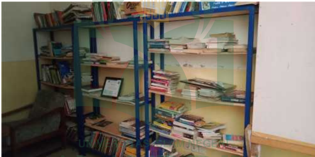
4. Perpustakaan di kantor PerDIK Sulsel