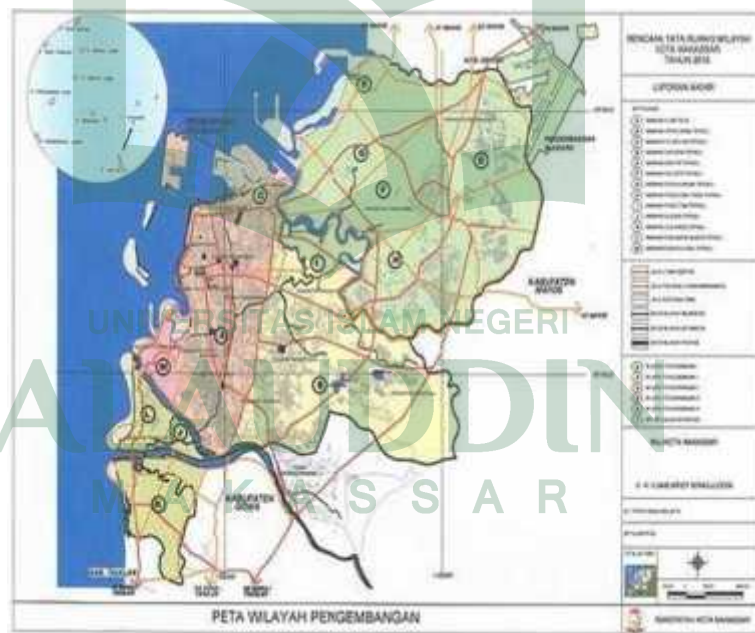
Gambar 1: Peta Administrasi kota Makassar