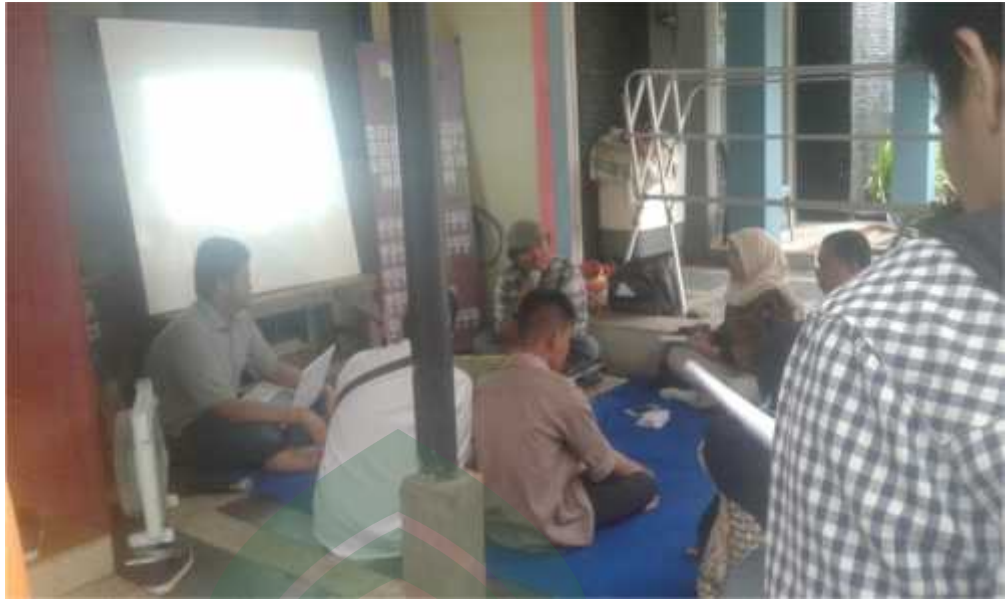
11. Diskusi yang diselenggarakan oleh Pustak@bilitas dengan tema “kemiskinan dan disabilitas”