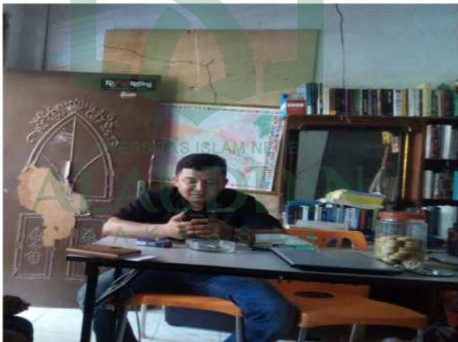
10. Wawancara bersama Gusdur