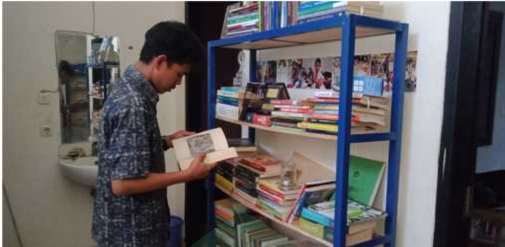
5. Sekretariat kantor PerDIK Sulsel