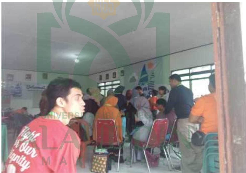
8. Dokumentasi kegiatan PerDIK Sulsel yaitu pemberian materi perjuangan difabel