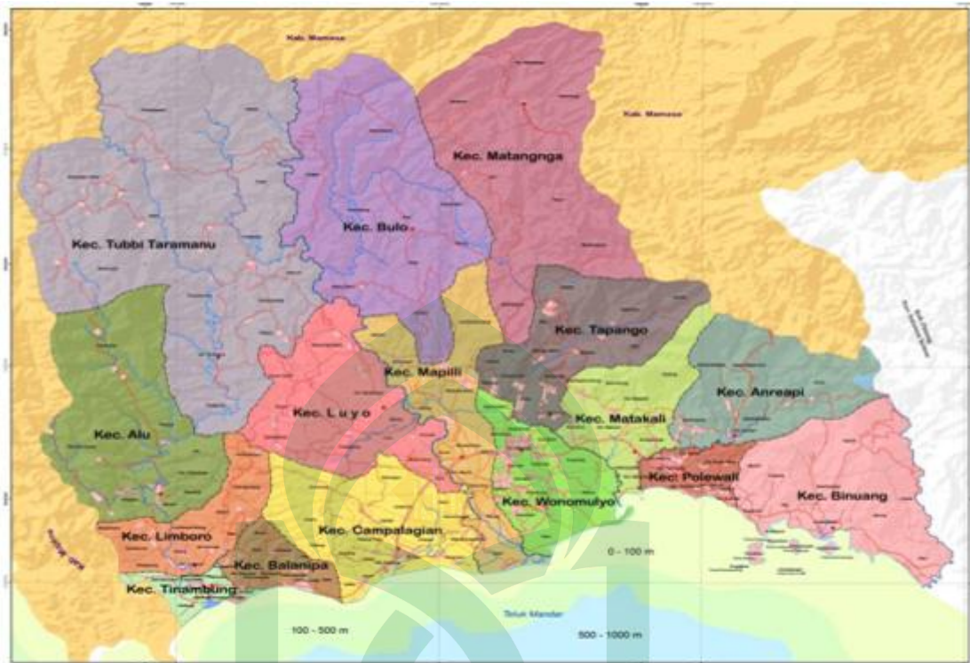
Gambar 4.1 Peta Administrasi kabupaten Polewali Mandar