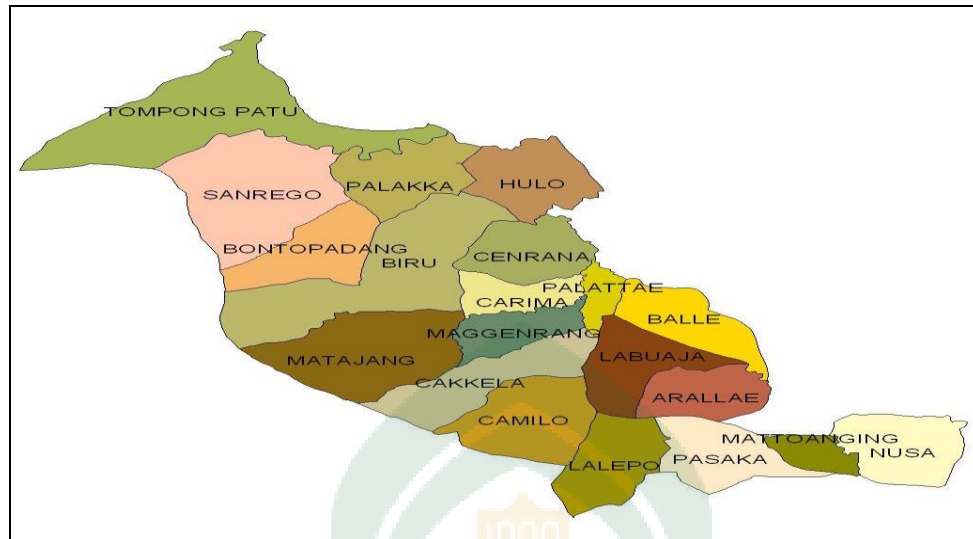
Gambar 1. Peta Kecamatan Kahu Kabupaten Bone