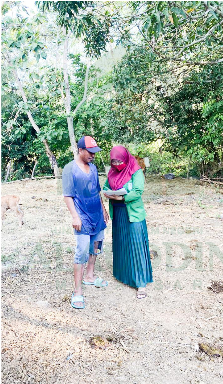
Lampiran 7. Foto