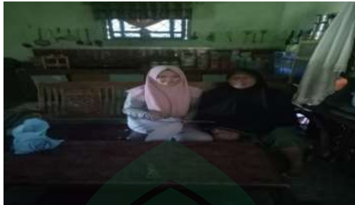
Gambar 5: Wawancara kepada Hasnawati di dusun Kaju, pemilik Arajang , pada tanggal 15 Mei 2019