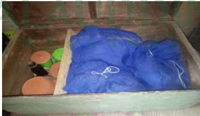
Gambar 13 Benda Arajang yang dipercaya masyarakat, yang biru adalah Sangiang Ase (induk padi)