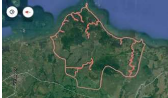
Gambar 2 Peta Kecamatan Sibulue

Di Kecamatan Sibulue terdapat beberapa Desa salah satu diantaranya yang menjadi lokasi penelitian yaitu Dusun Kaju yang terletak di Desa Tunreng Tellue. Untuk mencapai Desa Tunreng Tellue Kecamatan Sibulue Kabupaten Bone ditempuh selama 17 km dari jalan poros pattiro bajo. Sedangkan dari Kota Kabupaten dapat melalui jalanan darat dengan menempuh waktu sekitar 45 menit dengan Jarak 25 km.