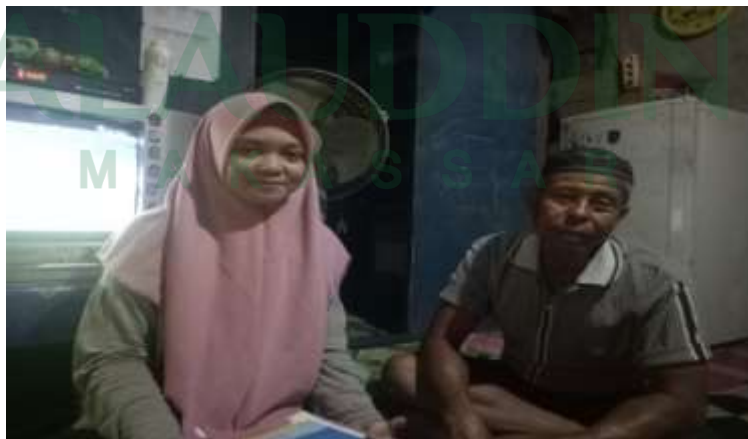
Gambar 4: Wawancara kepada Kepala RT Dusun Sijelling, tidak mempercayai Arajang , pada tanggal 15 Mei 2019.