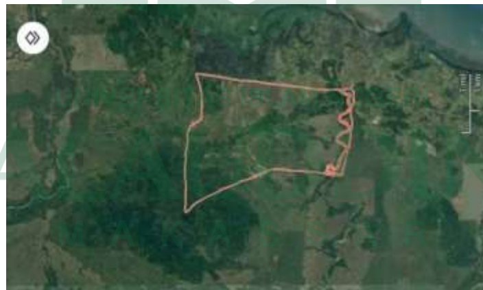
Gambar 3 Peta Desa Tunreng Tellue

Di Kecamatan Sibulue terdapat beberapa Desa salah satu diantaranya yang menjadi lokasi penelitian yaitu Dusun Kaju yang terletak di Desa Tunreng Tellue. Untuk mencapai Desa Tunreng Tellue Kecamatan Sibulue Kabupaten Bone ditempuh selama 17 km dari jalan poros pattiro bajo. Sedangkan dari Kota Kabupaten dapat melalui jalanan darat dengan menempuh waktu sekitar 45 menit dengan Jarak 25 km.