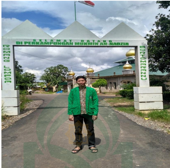
Gerbang Perkampungan Mukmin An-Nadzir