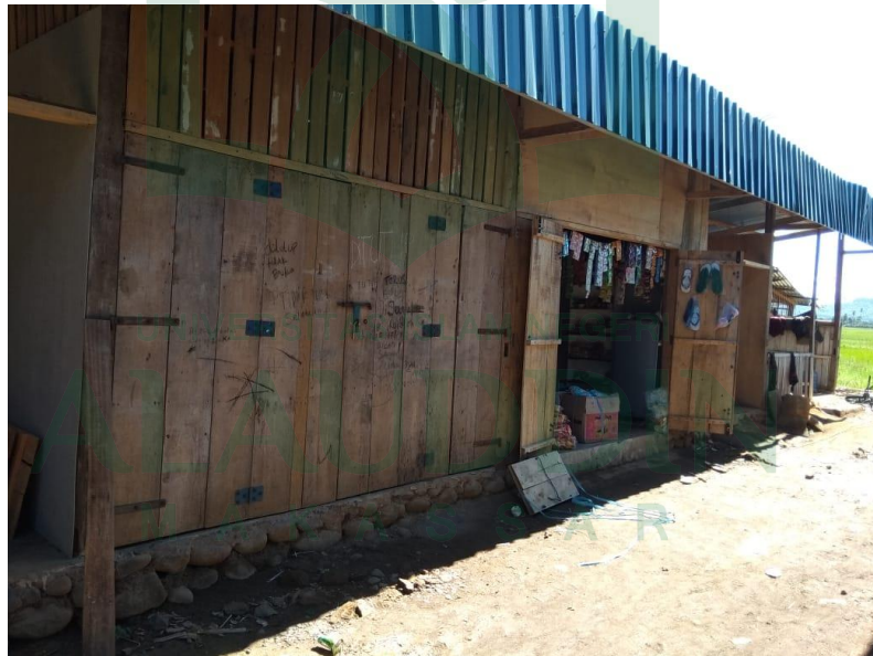
Pasar Tradisional Komunitas An-Nadzir