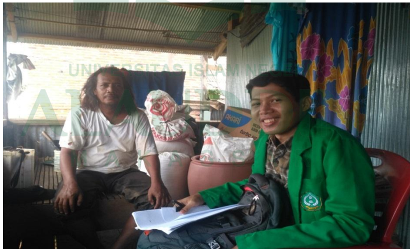
Wawancara Allung ketua departemen pertanian dan perikanan