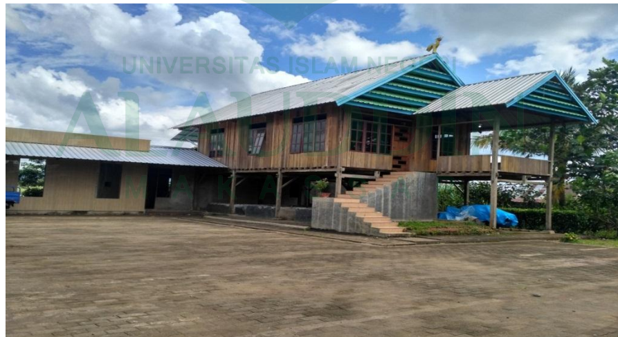
Rumah tempat meneirma tamu dan tempat menginap tamu