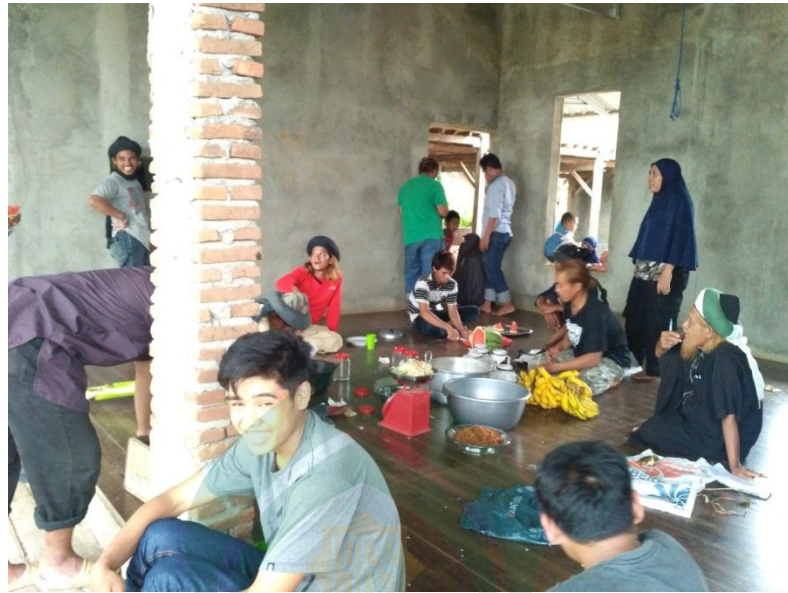
Pembuatan pupuk organik