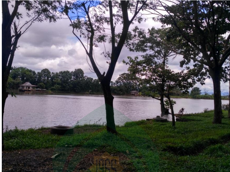
Danau STTP Gowa yang dikelola An-Nadzir