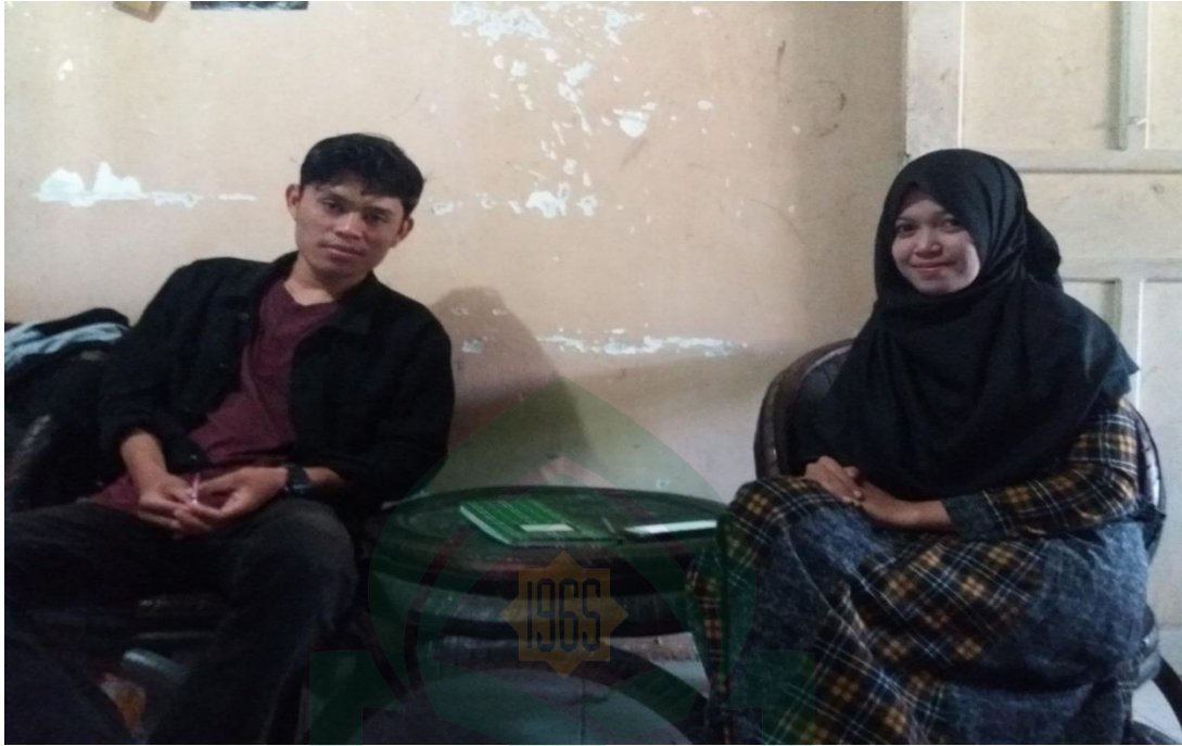
Gambar 4.3 Sesudah wawancara dengan masyarakat desa besoangin utara.