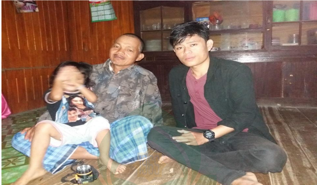
Gambar 4.1 sesudah wawancara dengan masyarakat desa besoangin utara