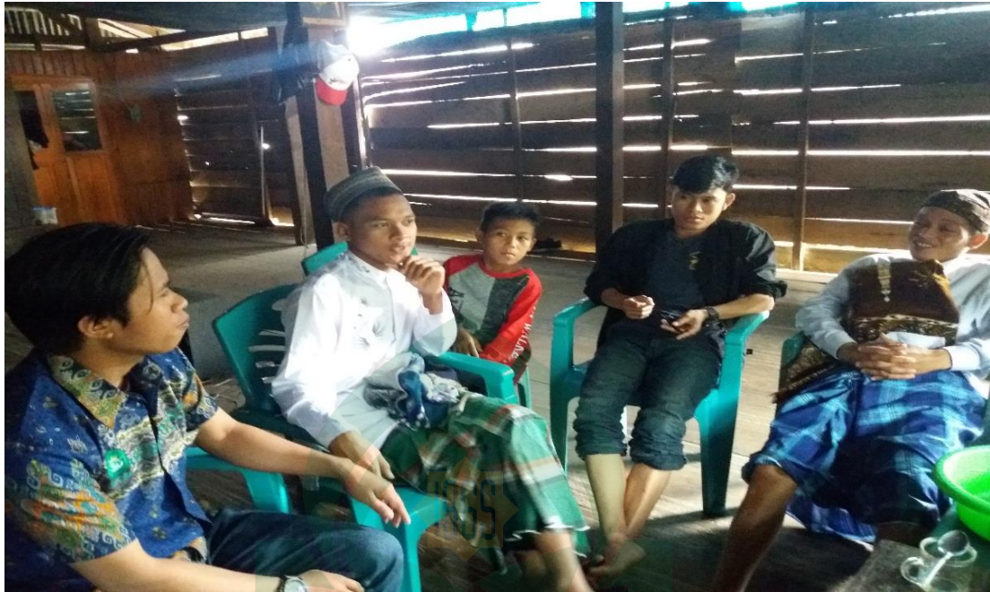
Gambar 4.7 sementara wawancara masyarakat desa Besoangin Utara