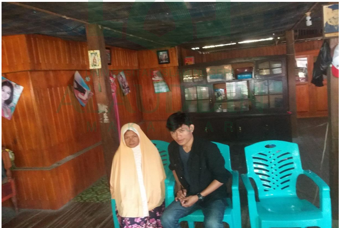
Gambar 4.6 sesudah wawancara penduduk desa Besoangin utara