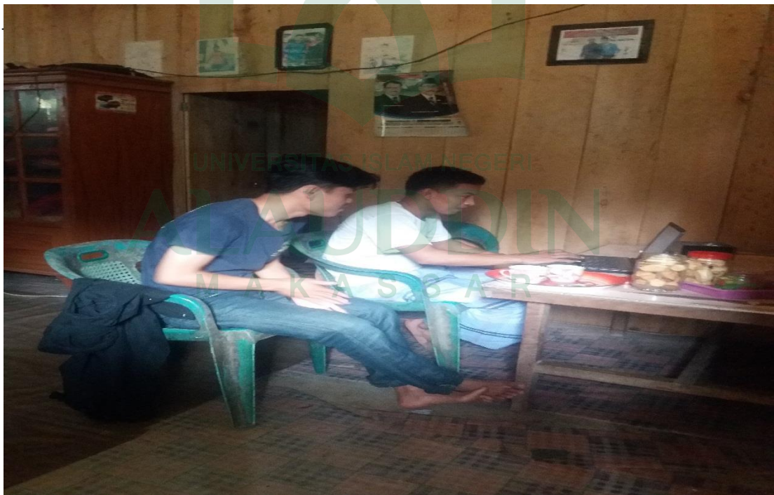
Gambar 4.8 sesudah wawancara desa Besoangin Utara