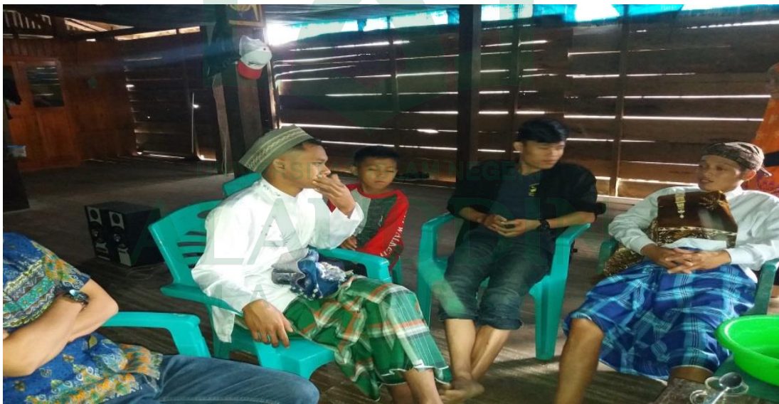
Gambar 4.2 Sementara wawancara bersama masyarakat besoangin utara