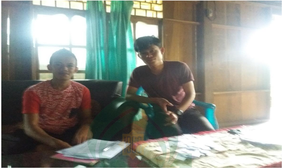
Gambar 4.5 setelah wawancara dengan masyarakat dusun Besoangin utara.