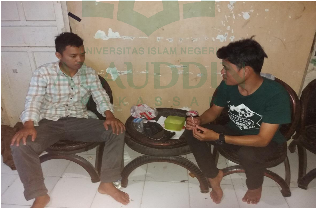
Gambar 4.4 sementara wawancara dengan penduduk desa Besoangin utara.