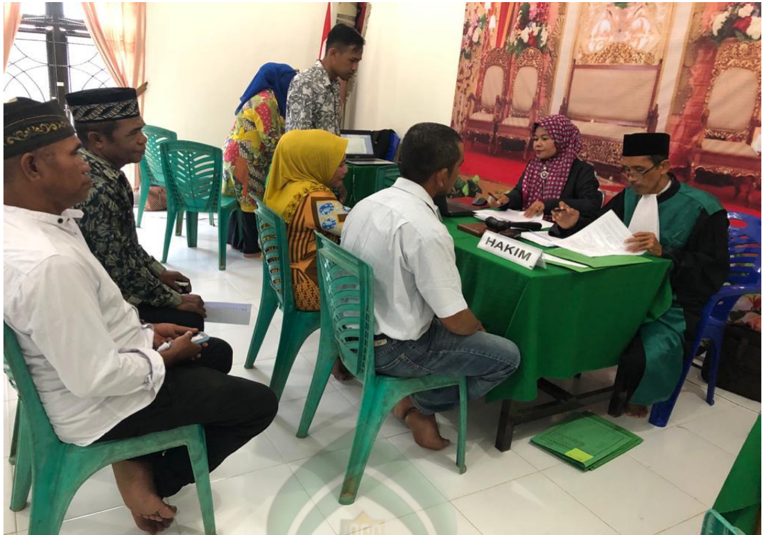
Gambar 7: Suasana pelaksanaan isbat nikah terpadu Pengadilan Agama Kendari Kelas IA