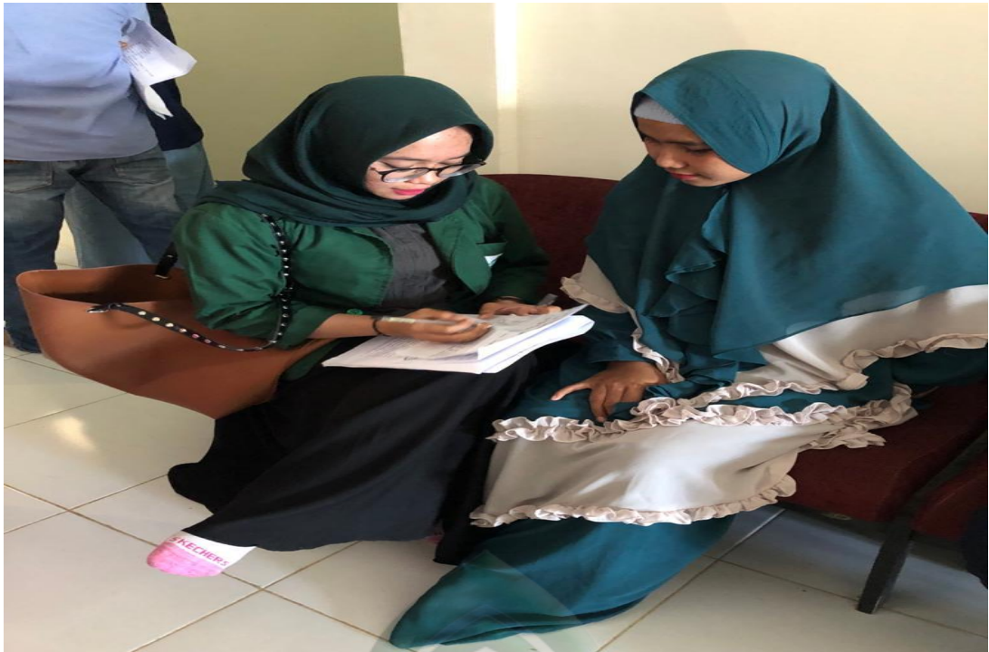
Gambar 3: Wawancara dengan warga selaku pemohon isbat nikah terpadu di Pengadilan Agama Kendari Kelas IA.