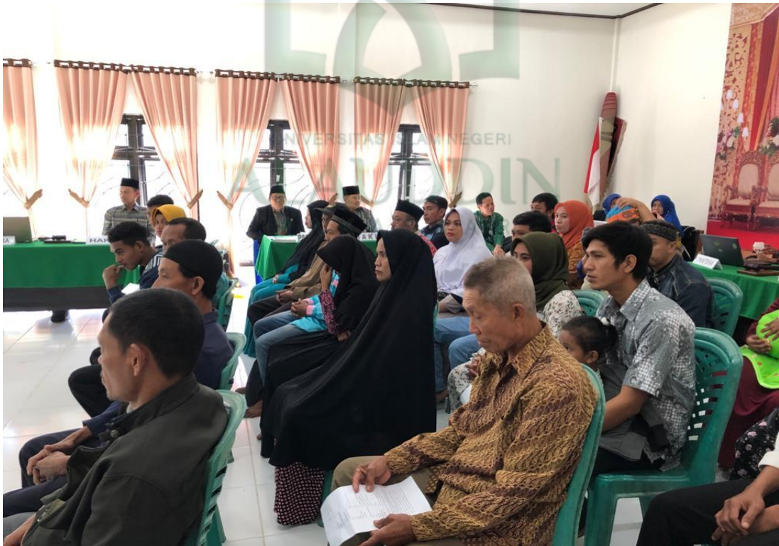
Gambar 6: Suasana pelaksanaan isbat nikah terpadu Pengadilan Agama Kendari Kelas IA