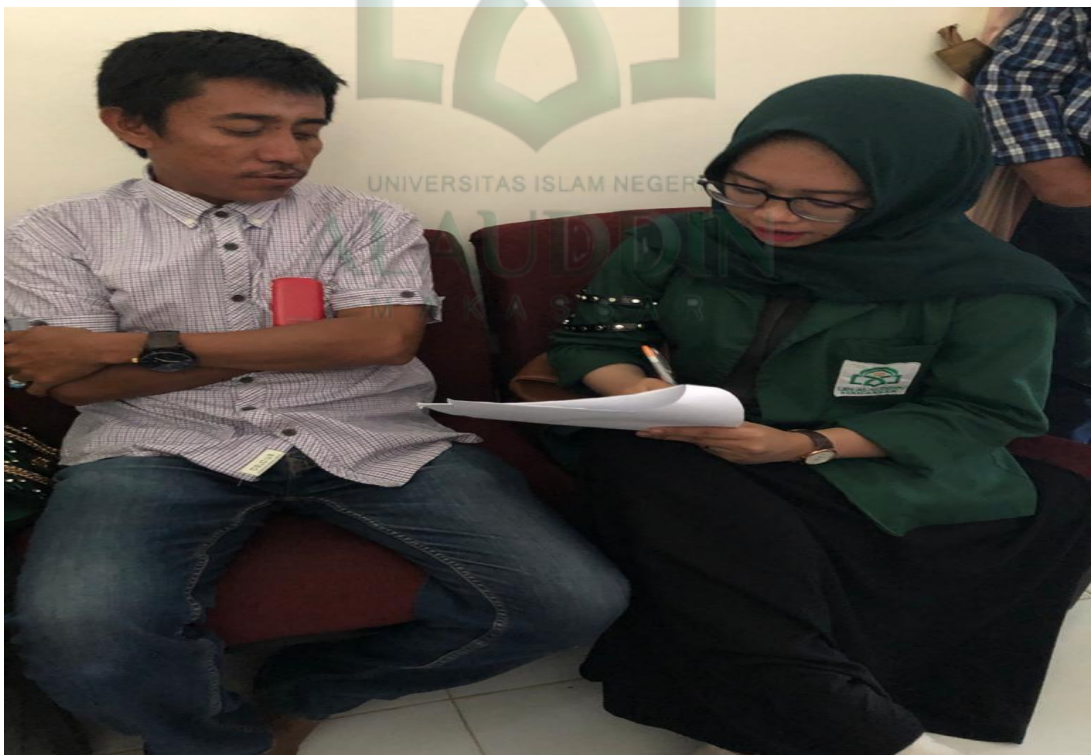
Gambar 5: Wawancara bersama dengan warga selaku pemohon isbat nikah pada sidang terpadu pengadilan Agama Kendari Kelas IA