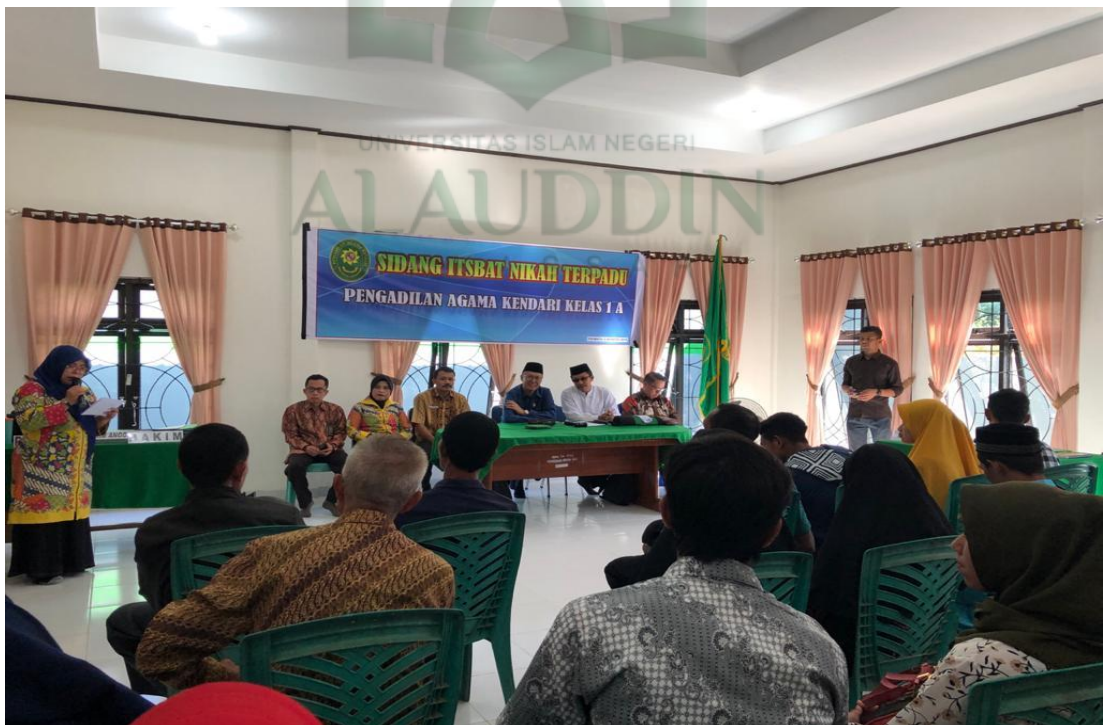
Gambar 8: Suasana pelaksanaan isbat nikah terpadu Pengadilan Agama Kendari Kelas IA