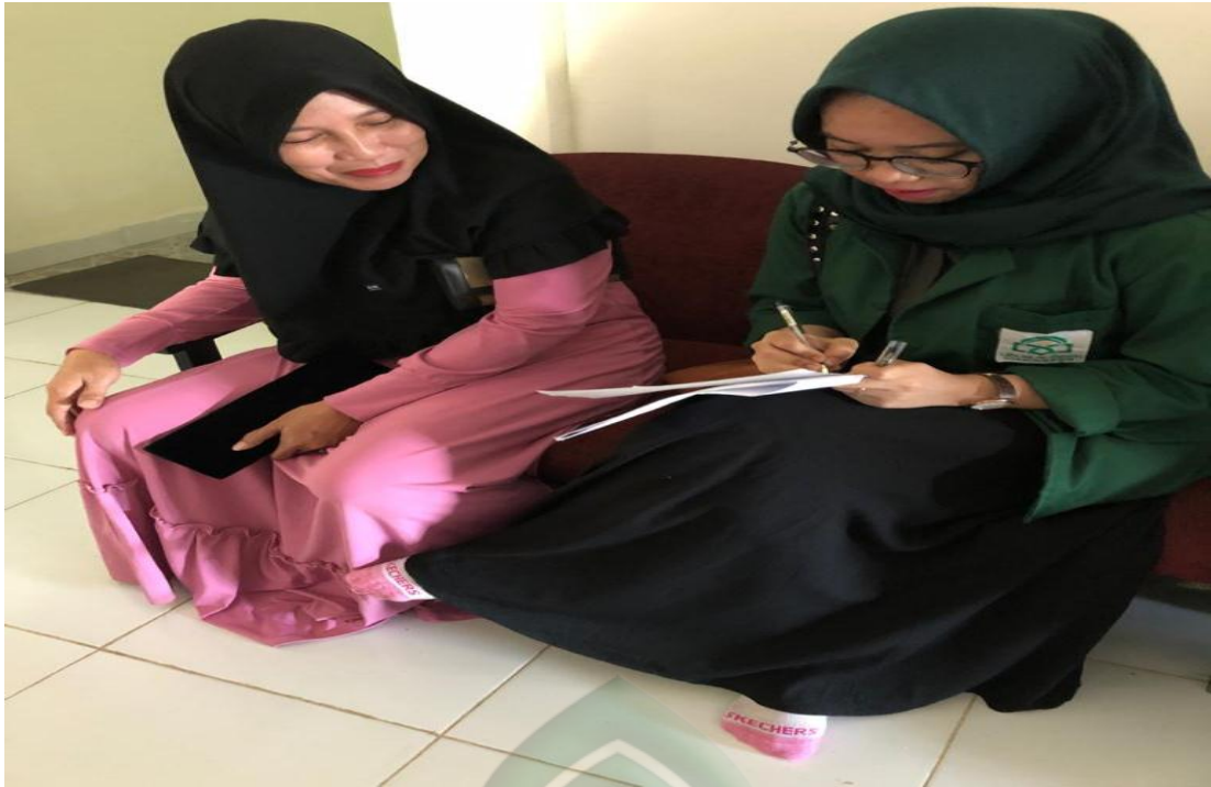
Gambar 4: Wawancara bersama dengan warga selaku pemohon isbat nikah pada sidang terpadu pengadilan Agama Kendari Kelas IA