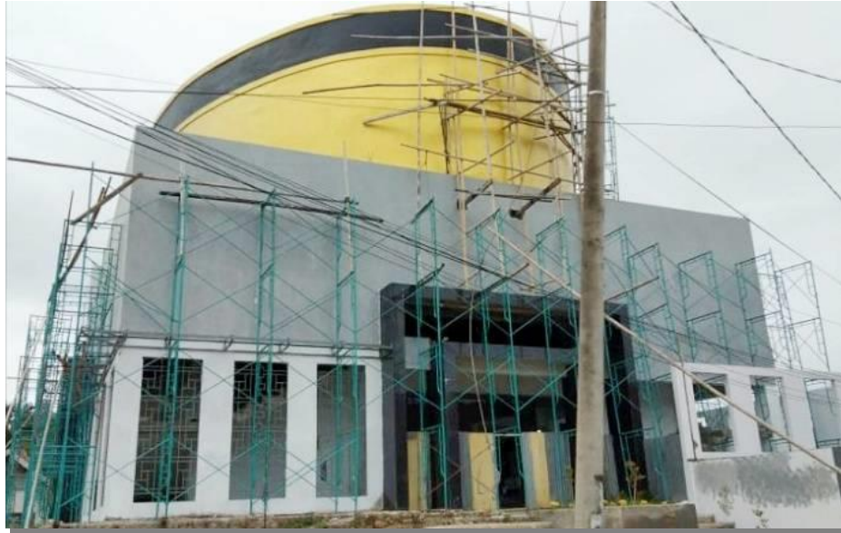
Dokumentasi Proyek Pembangunan Masjid Songkok Recca' di Jl. Ahmad Yani Kabupaten Bone