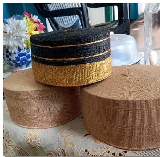
Songkok Recca' dengan berbagai macam model dan warna