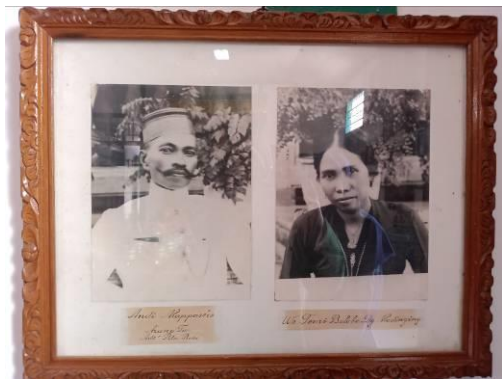
Dokumentasi Raja-raja dan Bangsawan Bone beserta keturunannya mengenakan Songkok Recca'