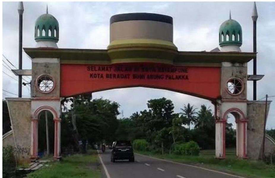
Dokumentasi Portal Perbatasan Kota Watampone dengan Daerah Kecamatan