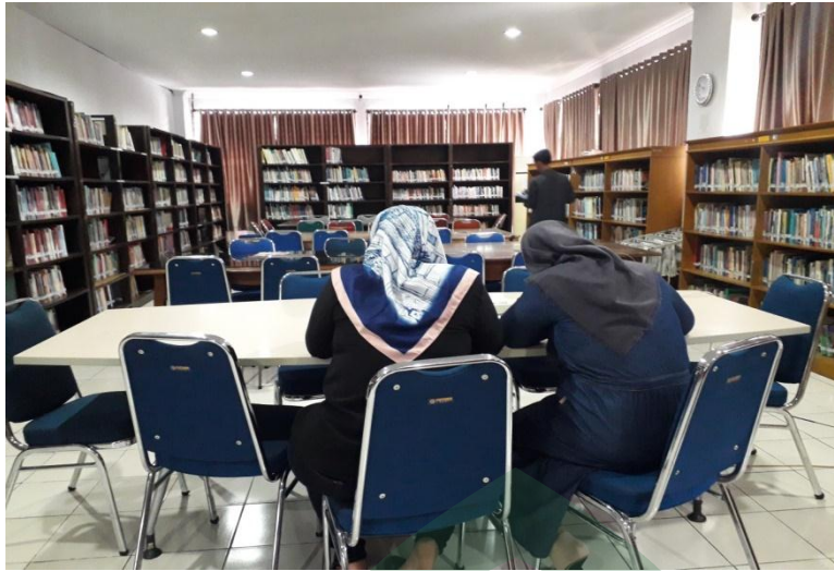
Mahasiswa Saat Mengerjakan Tugas