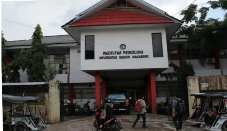
Fakultas Psikologi Universitas Negeri Makassar