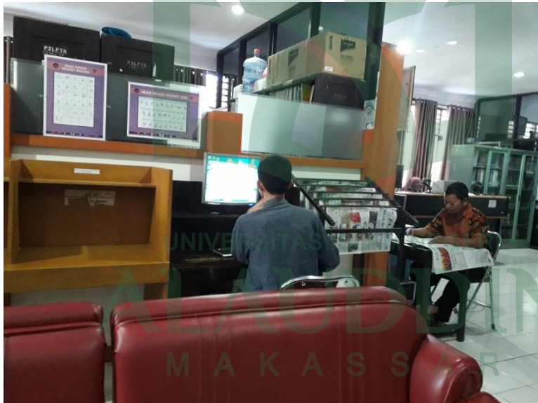
Mahasiswa Pada Saat Menggunakan OPAC