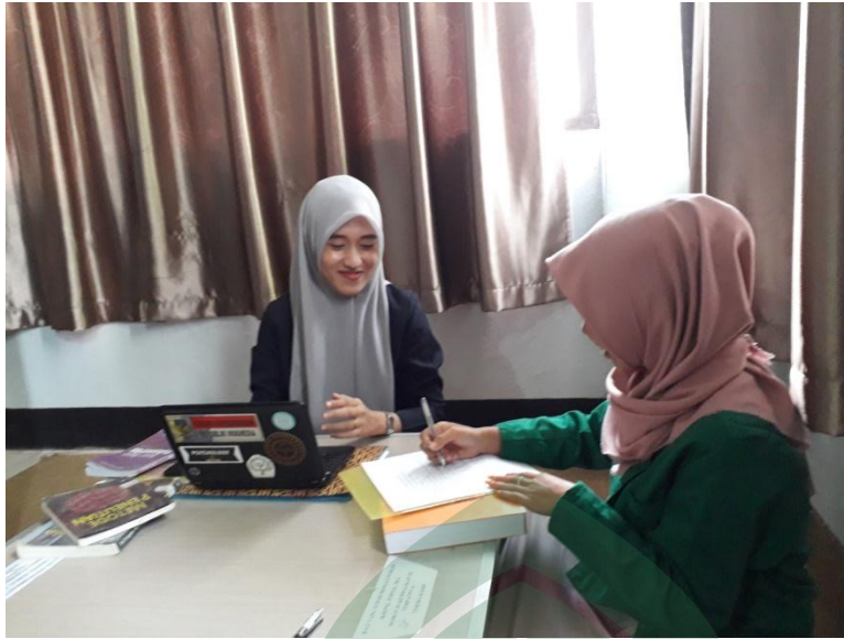
Pada Saat Melakukan Wawancara