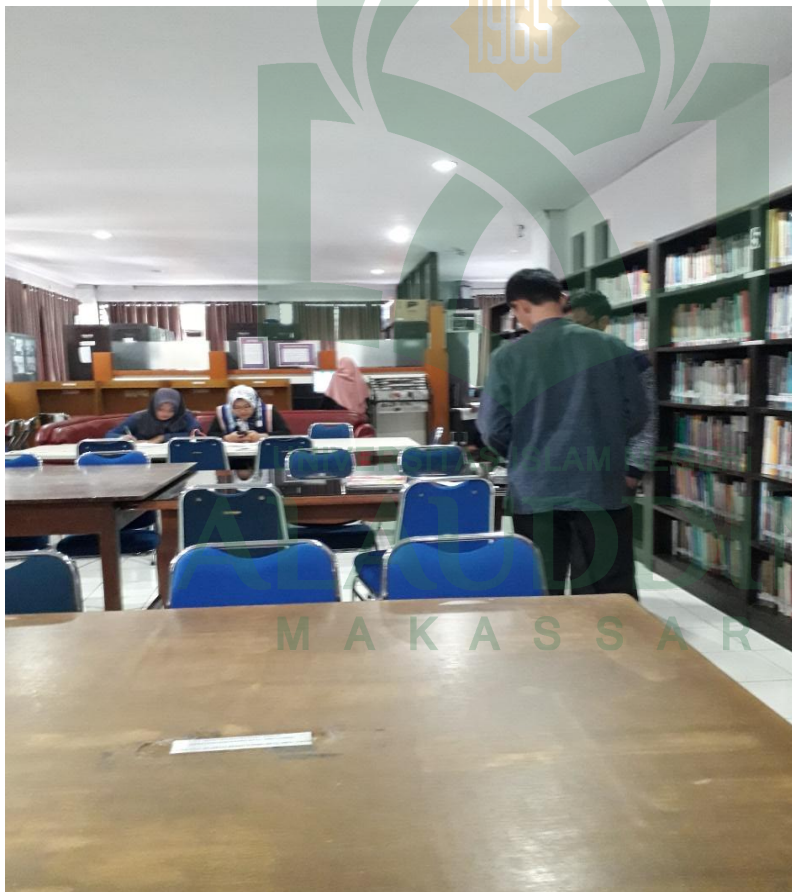
Pemustaka Yang sedang Bertanya Kepada Pustakawan