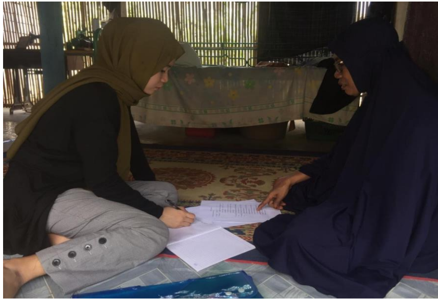
Wawancara dengan Toko Wanita