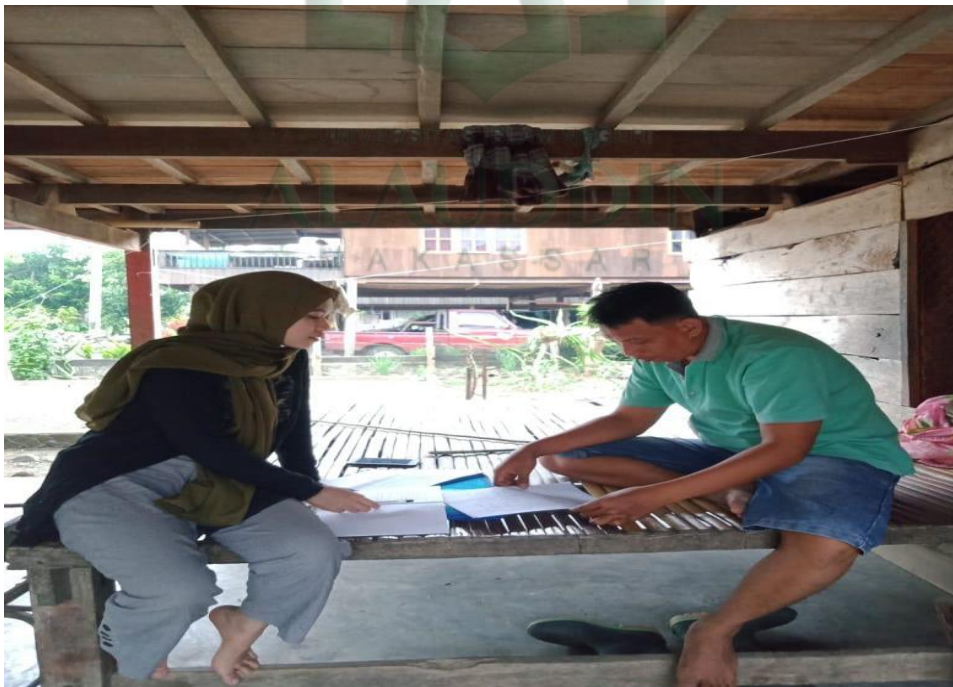
Wawancara dengan Ketua RT