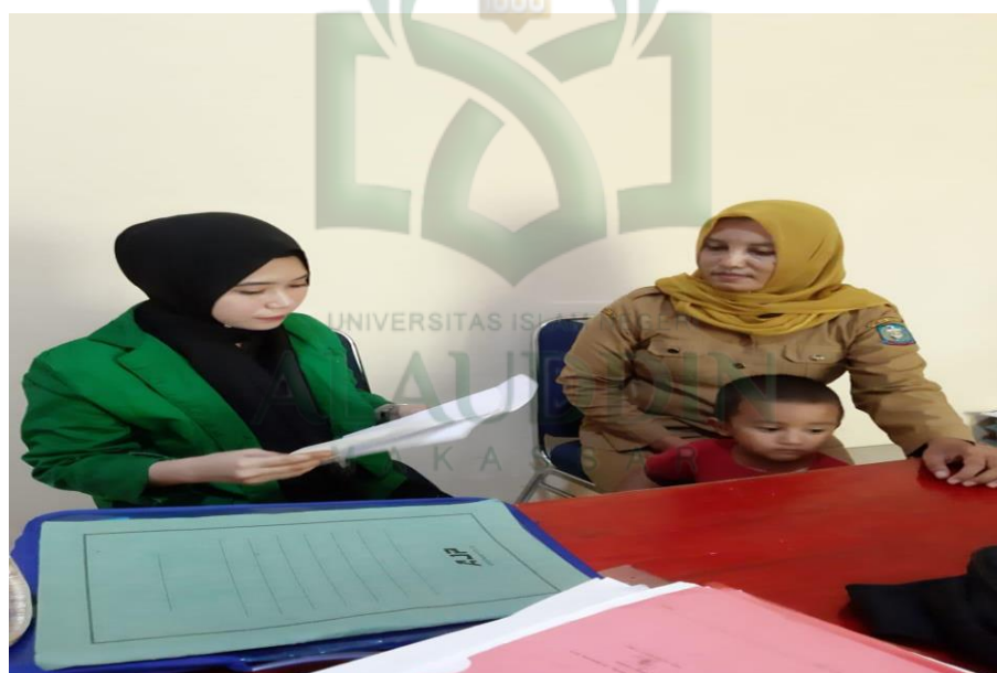
Wawancara dengan Sekretaris Desa Kebo