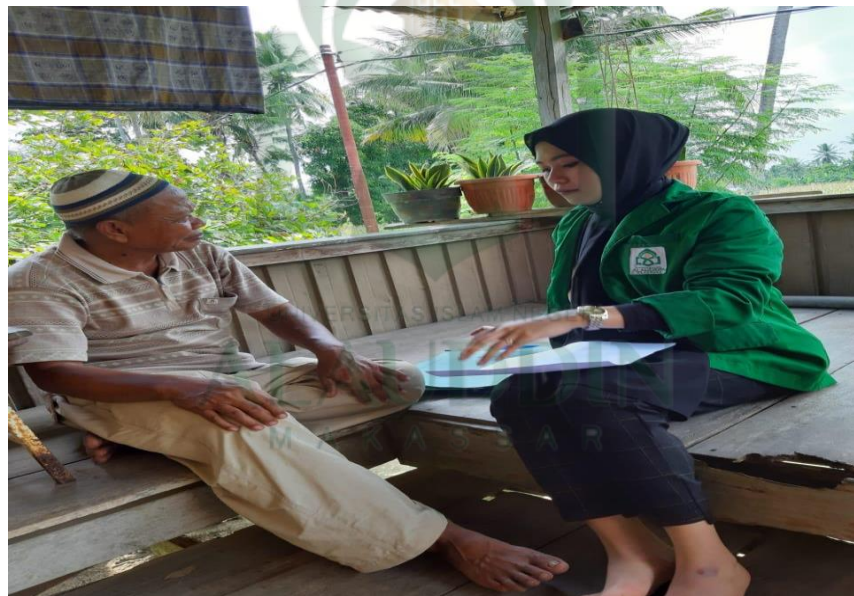
Wawancara dengan Masyarakat