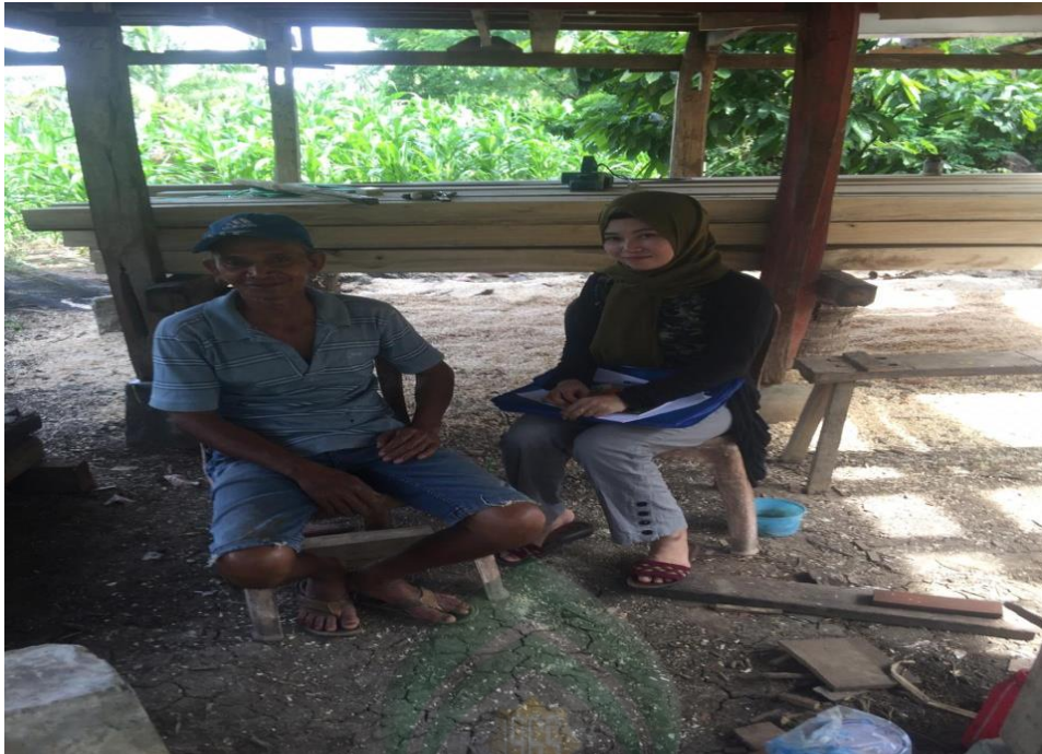
Wawancara dengan Ketua BPD Kebo