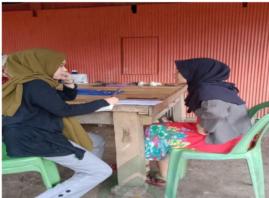
Wawancara dengan Masyarakat