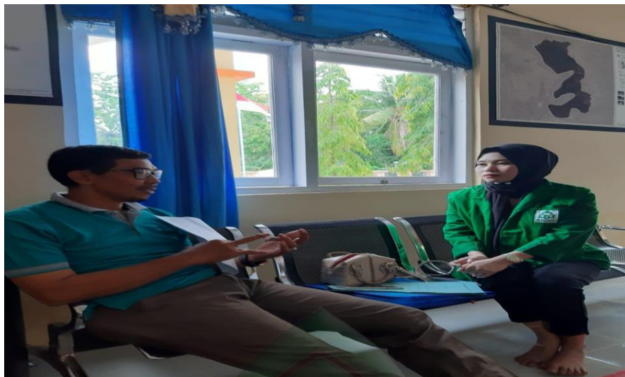
Wawancara dengan Kepala Desa Kebo