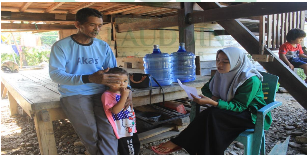
gambar 2: Wawancara dengan Bapak selaku pemegang gadai sawah