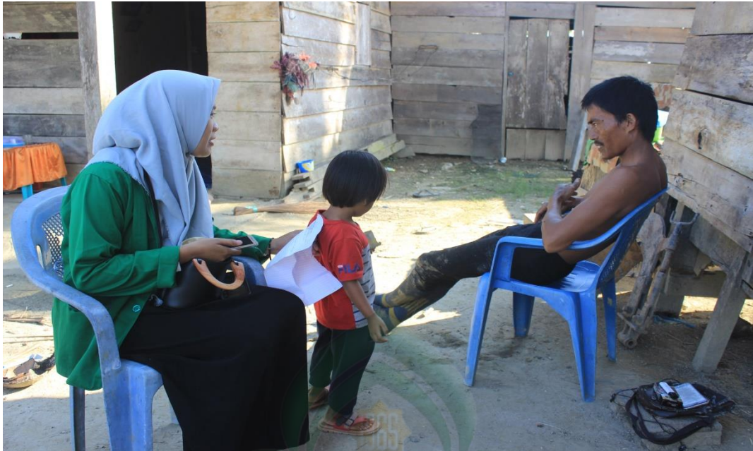
Gambar 1: Wawancara dengan Bapak Melody selaku pemilik sawah