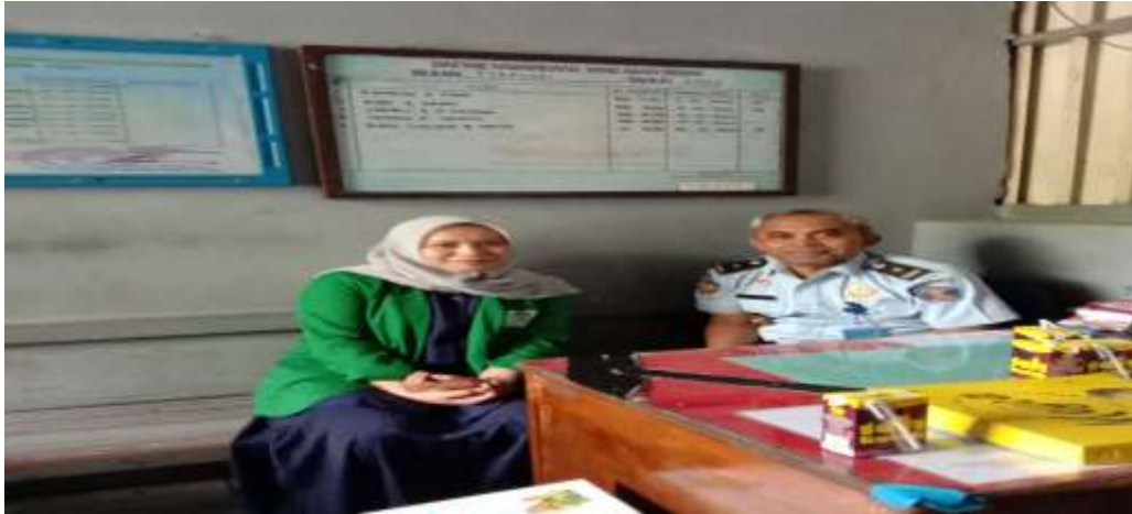
Foto bersama Warga Binaan Rutan Kelas II B Kabupaten Jeneponto