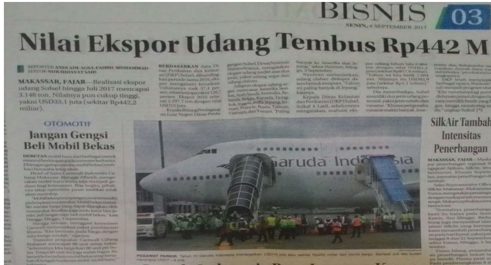
Berita yang mengandung nilai kebenaran