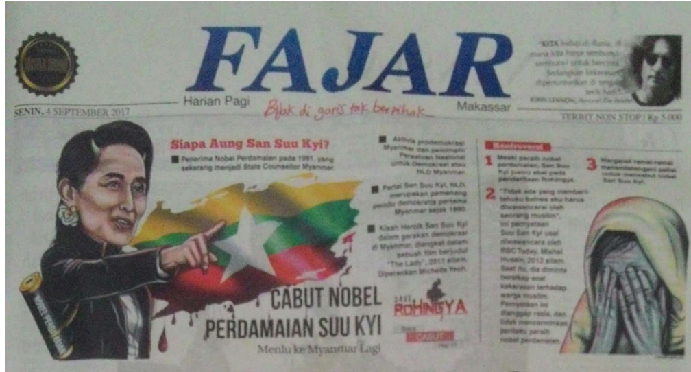
Gambar 4.3 Berita aktual dan faktual