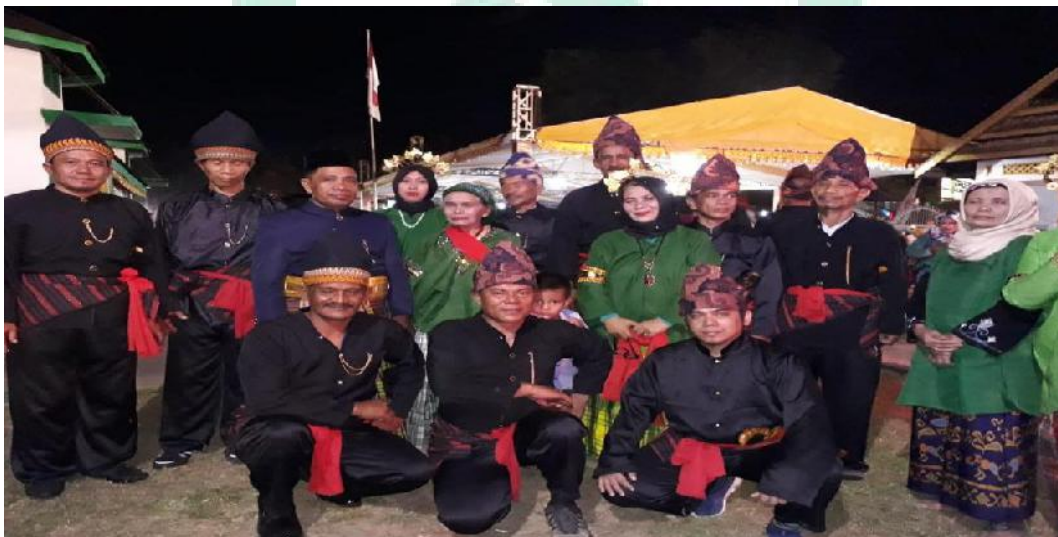
(Kostum tari Pajaga lili dalam kegiatan penjemputan tamu agung di kedatuan Luwu)