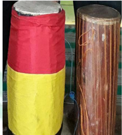
(Gendang tari Pajaga Lili )