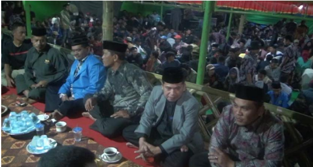
(Para tamu duduk dalam Pasumbungan )