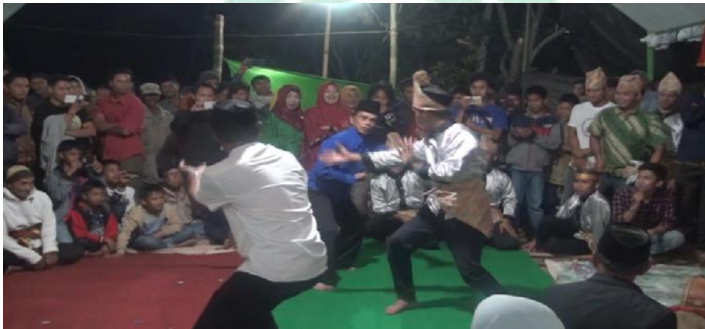
(Pertunjukan pencak silat setelah tarian pajaga lili )