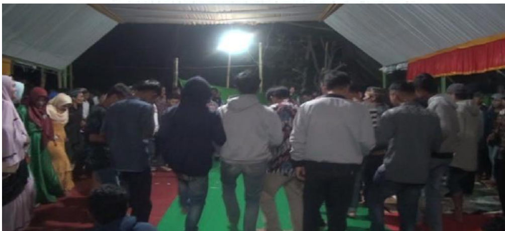
(Penampilan budaya tarian dero oleh rumpun keluarga yang telah menjadi satu ikatan keluarga)