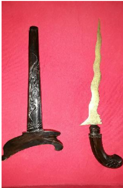
(Badik yang dipakai para Penari Pajaga Lili )