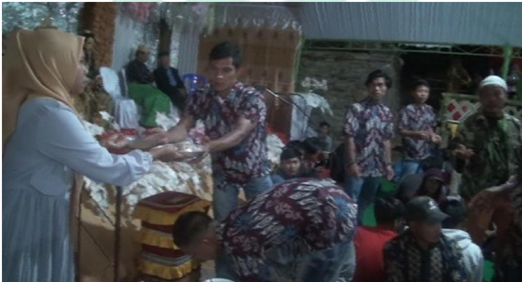
(Pengantaran makanan dengan cara mengangka' baki dihadapan tamu)