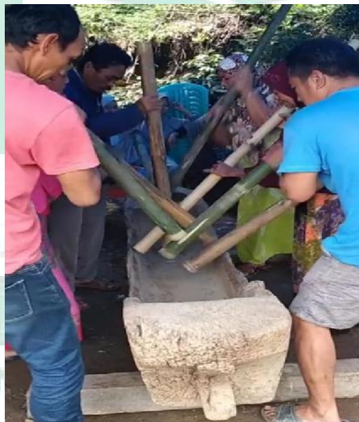
(Masyarakat Desa Ulusalu Memainkan Budaya Balendo Menyambut Kabar Baik Akan Adanya Pesta Pernikahan)