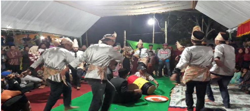
(Para Penari Tari Pajaga Lili dalam adat pernikahan di desa ulusalu)