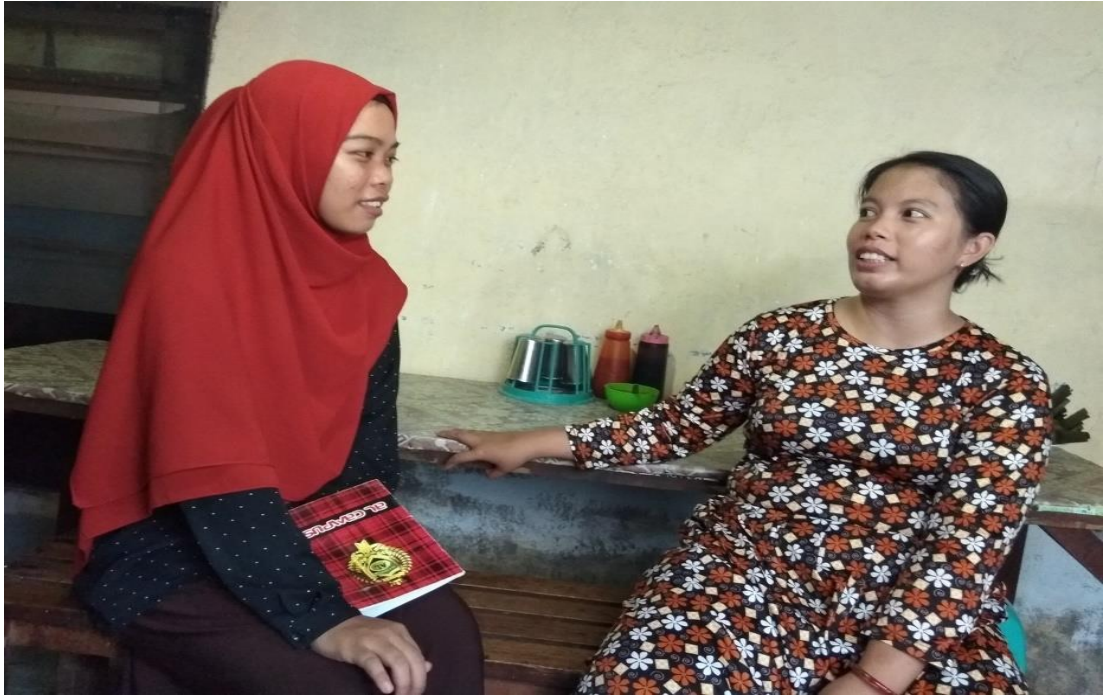
Wawancara ibu Kadaria orang tua yang membina kecerdasan emosional ana, Ulidang