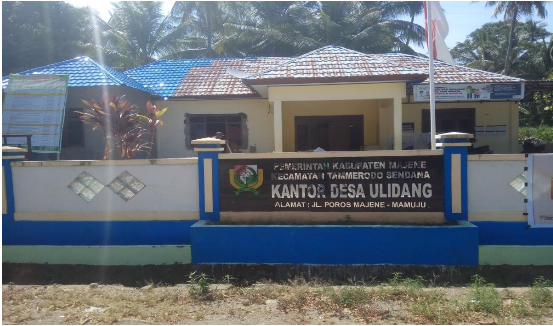
Gambar I: Kantor Desa ulidang

Wawancara Pita, anak yang dibina kecerdasan emosioanal Ulidang pada tanggal 25 Agustus 2018