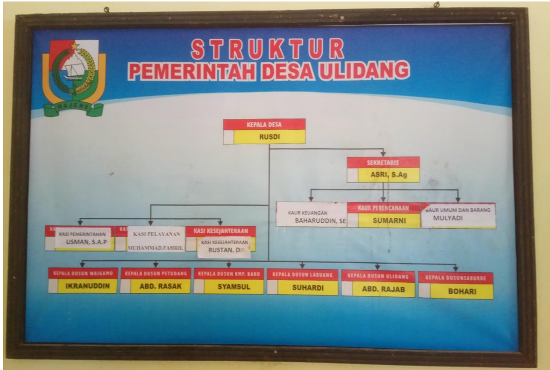
Gambar II: Struktur Organisasi Desa Ulidang