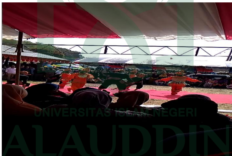
Tari Maddonggi (mengusir burung pipit)