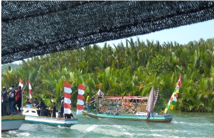
Penulis saat mengikuti tradisi Marrimpa Salo