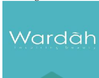
Gambar 4.1 Logo Wardah