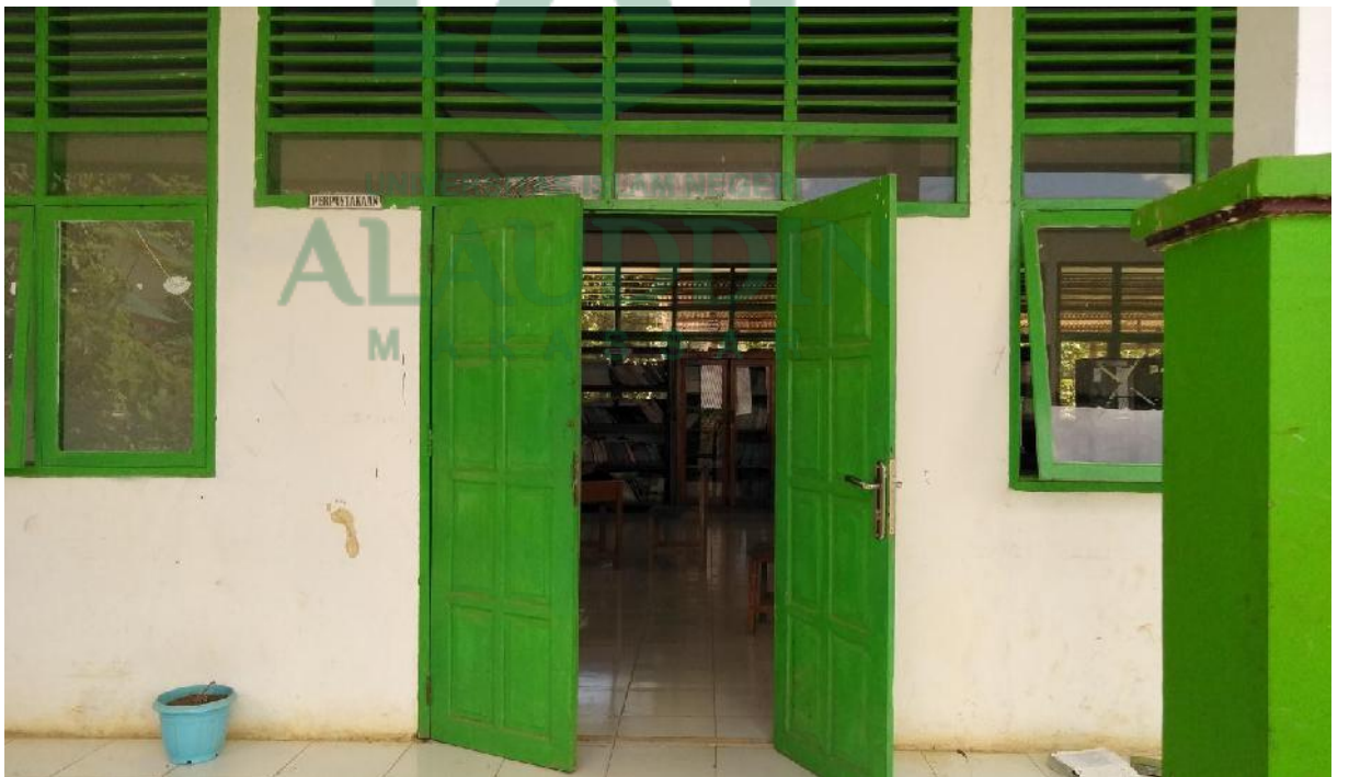
(Gambar Profil Perpustakaan SMA Negeri 6 Enrekang)