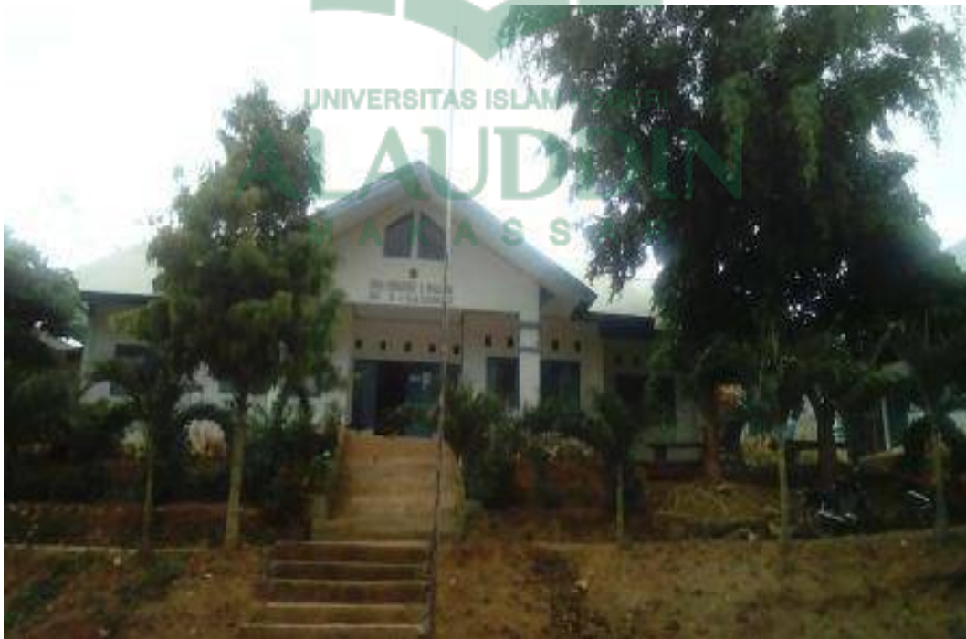
(Gambar Profil Sekolah SMA Negeri 6 Enrekang)