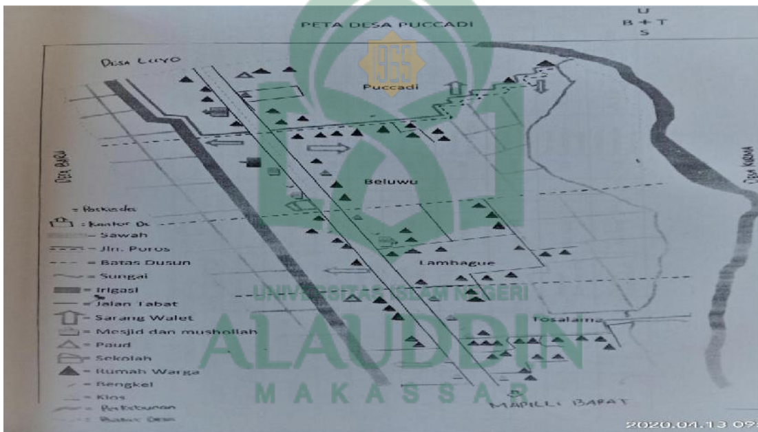
Peta Desa Puccadi

tahun 2009 karena adanya mutasi besar-besaran pada pegawai negeri sipil yang ada di Kecamatan Luyo dan pejabat sementara kepala Desa,atas usulan dari masyarakat sehinggabapak H.Suddin Puasa diangkat menjadi kepalaDesa Puccadi dengan SK bupati nomor tahun 2009,dan menjabat selama 1 tahun 4 bulan. Pada tanggal 26 mei 2010 terjadi pemilihan kepala Desa Puccadidefenitif yang diresmikan melalui pelantikan kepala Desa terpilih atas nama Muhammad Ali periode 2010 sampai 2016 di lantik pada tanggal 4 Juni 2010 dengan SK bupati nomor tahun 2010.