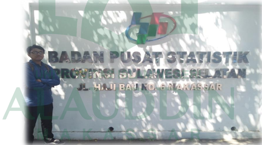
Lampiran 11. Pengambilan data kependudukan kec.kelara kab. jeneponto