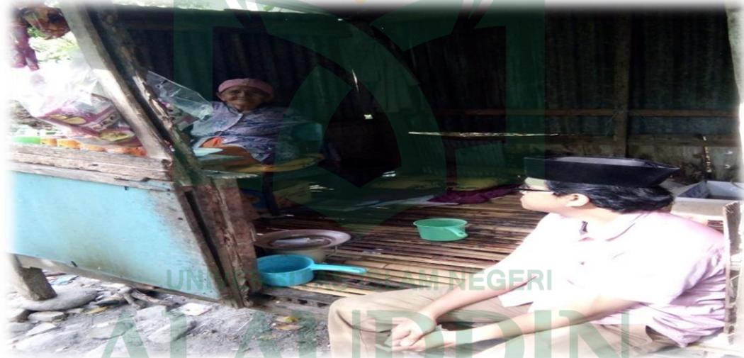
Ket: Dokumentasi saat Bertemu dengan sang juru kunci