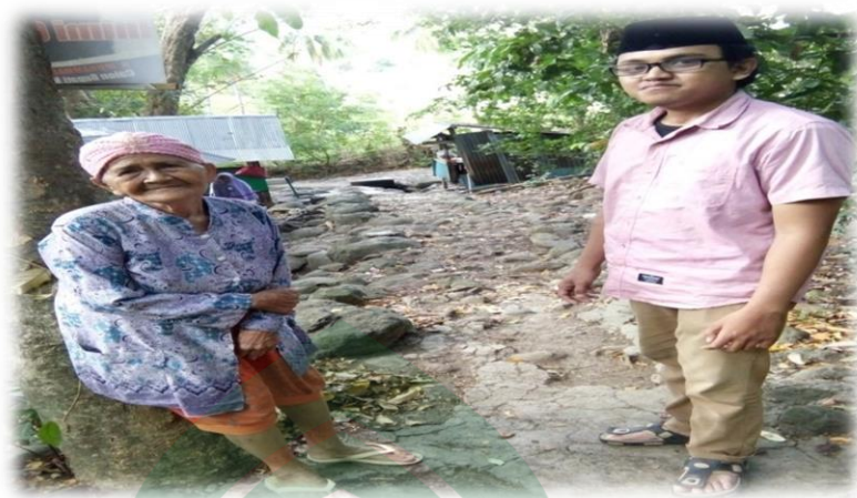
Lampiran 9. Wawancara dengan nenek Bau mengenai Bungung Salapang