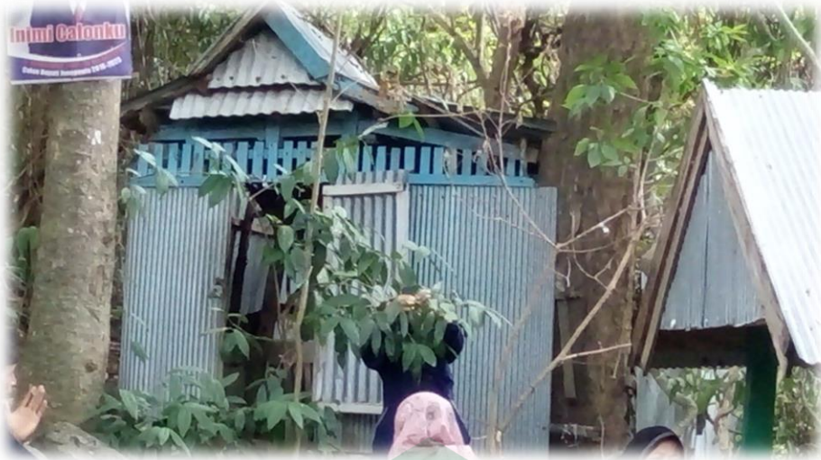
Lampiran 6. Ritual mengikat tali Rumah tempat berdoa yang didalamnya terdapat batu sakral