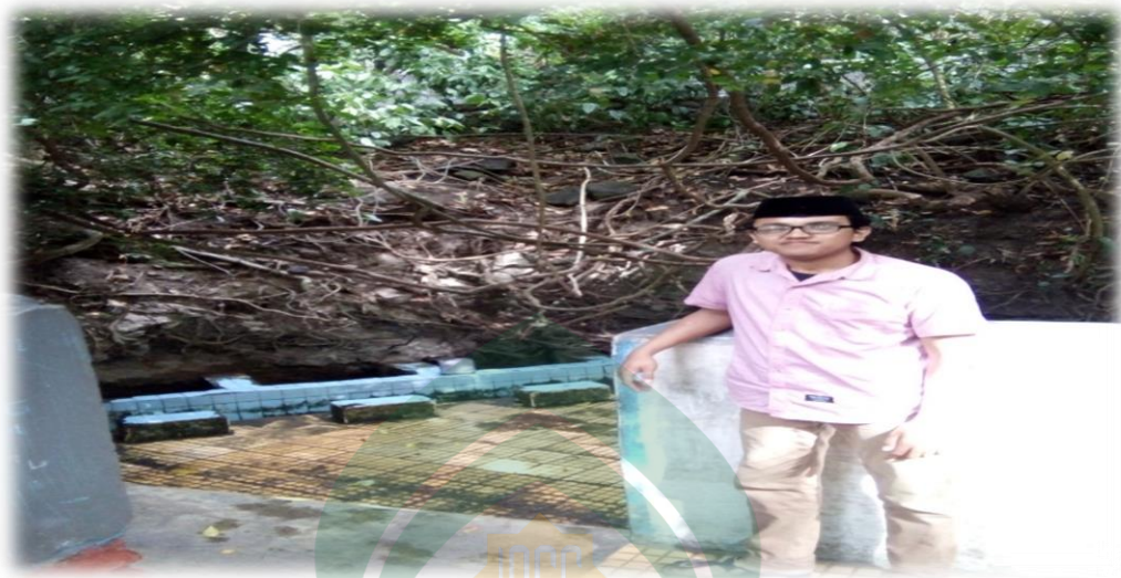
Ket: Letak Bungung Salapang