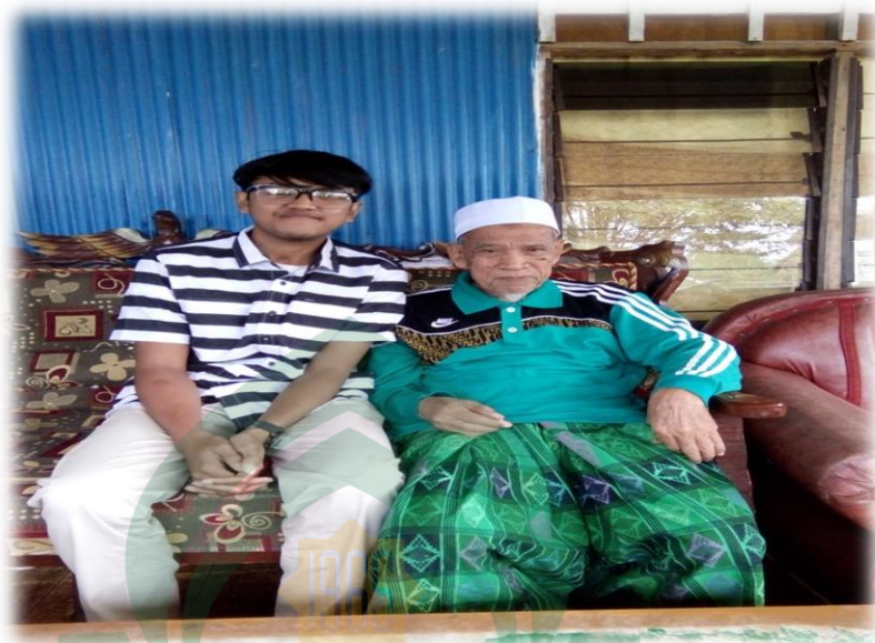
Lampiran 10. Wawancara dengan ulama sekitar mengenai Bungung Salapang