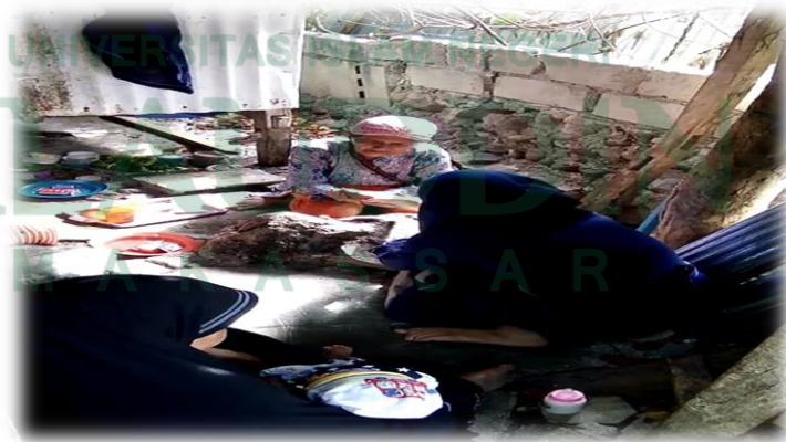
Lampiran 8. Setelah membacakan doa, salah satu pengunjung tampak memberikan uang sebagai imbalan atau ucapan terima kasih