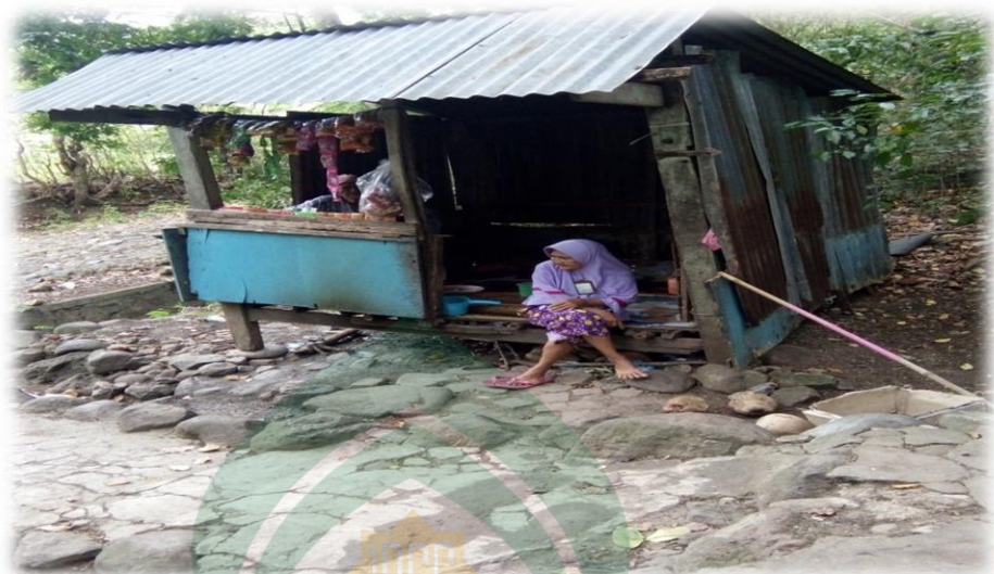
Ket: Tempat tinggal nenek Bau sang juru kunci Bungung Salapang