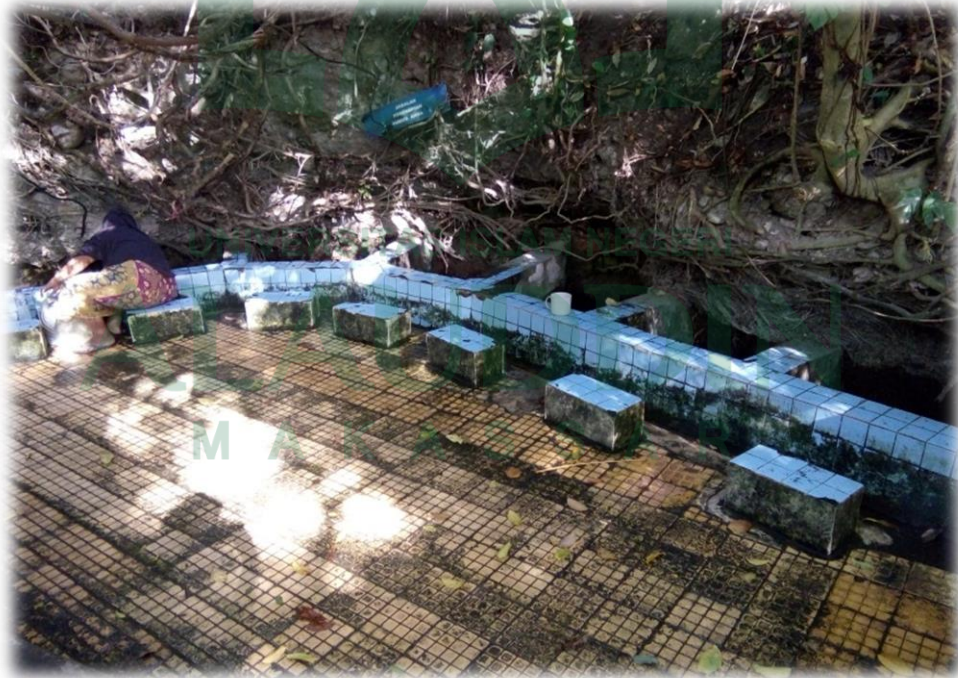
Ket: Bentuk Bungung Salapang