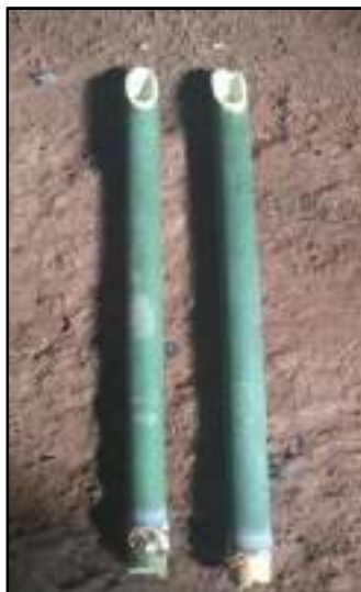
Gambar 7. Suke-suke (Bambu)

Dalam proses pelaksanaan tradisi Ammua'ini, yang membawa suke-suke ini hanyalah seorang pinati karena pinatilah yang memimpin jalannya tradisi Ammua' tersebut.