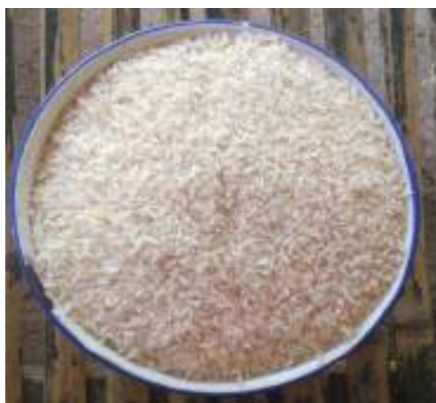
Gambar 3. Berasa' (Beras)

“Angjo berasaka pappisabbiji nipacinikangi ankana ia minne wasselena bungasa parenku anne taunga. Jari nipakioroki pintallung assiagang angjo bentea mangeri kayua” . 18