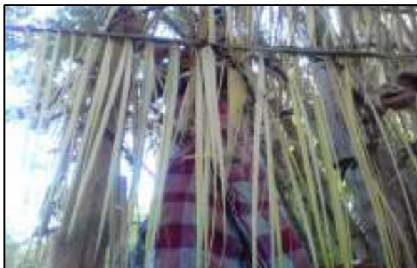
Gambar 8. Bombong (Daun Aren)

Dalam proses pelaksanaan tradisi Ammua' bombong dipersiapkan terlebih dahulu dalam pelaksanaan tradisi Ammua' tersebut, bombong hanya dibawa oleh pinati saja.