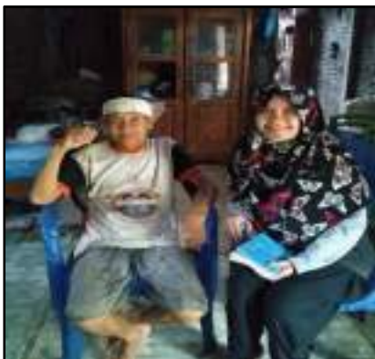
Dg. Mawang Pinati Desa Manuju