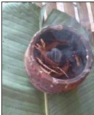
Gambar 2. Dupa

Makna dari do'a ma' Dupa ini ialah masyarakat Desa Manuju membawa hasil panen pertamanya kepada pohon keramat tersebut.