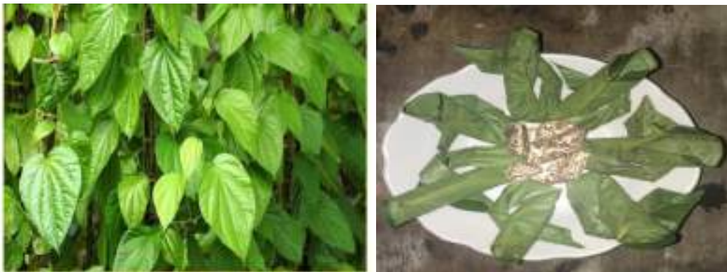
Gambar 6. Leko' Kalomping (Daun Sirih)

Leko' Kalomping disini dimaksud ialah untuk mengikat atau mempererat tradisi Ammua' tersebut agar selalu dilakukan oleh masyarakat Desa Manuju artinya tidak dihilangkan tradisi Ammua' ini. 22 Leko' Kalomping ini tidak bisa dipisahkan dengan Rappo (Buah Pinang).