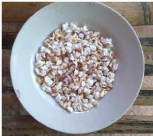
Gambar 4. Bente

Dalam proses pelaksanaan tradisi Ammua' masyarakat Desa Manuju meminta kepada pohon keramat tersebut supaya padi yang masyarakat tanam bisa seperti manisnya seperti bente .