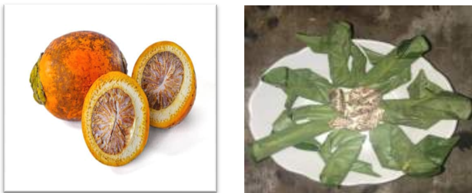
Gambar 5. Rappo (Buah Pinang)

Jadi Rappo (Buah Pinang) dan daun sirih tidak bisa dipisahkan karena tradisi nenek moyang dulu mengunyah buah pinang yang dicampur dengan daun sirih untuk menguatkan gigi dan gusi hal ini diwariskan turun temurun dari generasi tua ke generasi yang lebih muda tetapi seiring berjalannya waktu teknologi semakin canggih maka digantikan dengan adanya Pasta gigi atau sikat gigi.