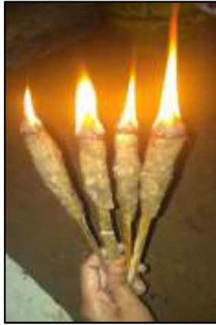
Gambar 1. Kangjoli (lilin)