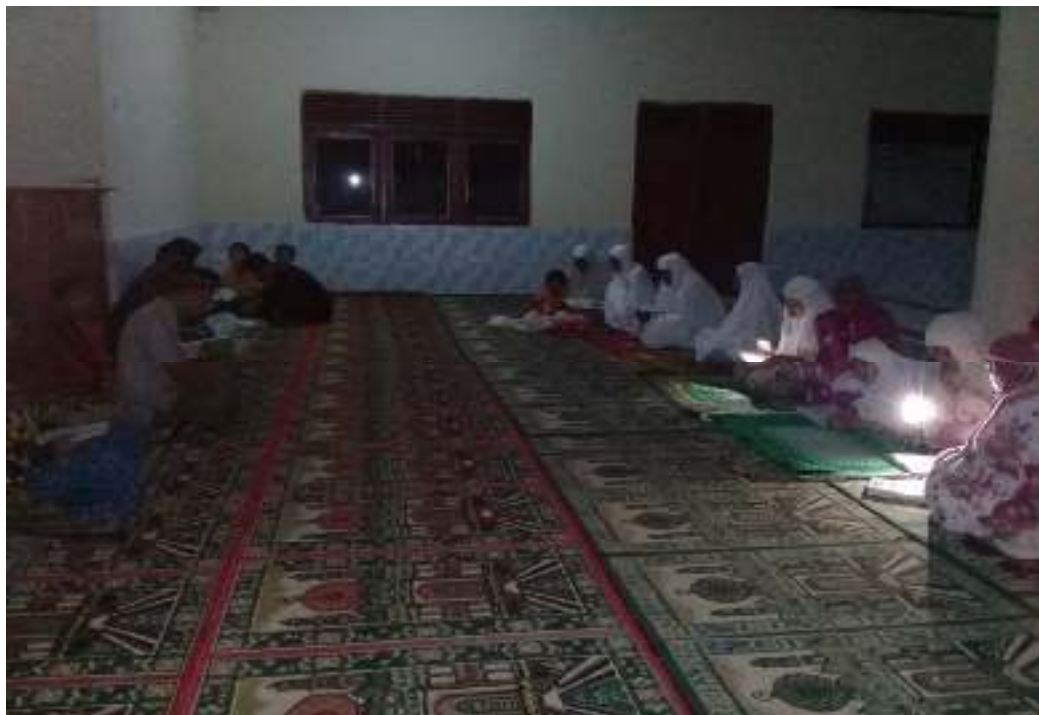
Tadarrusan yang di pimpin oleh Imam Dusun Langkowa