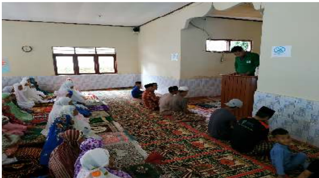
Penjelasan proses penelitian kepada jamaah Akkammisi di Dusun Langkowa