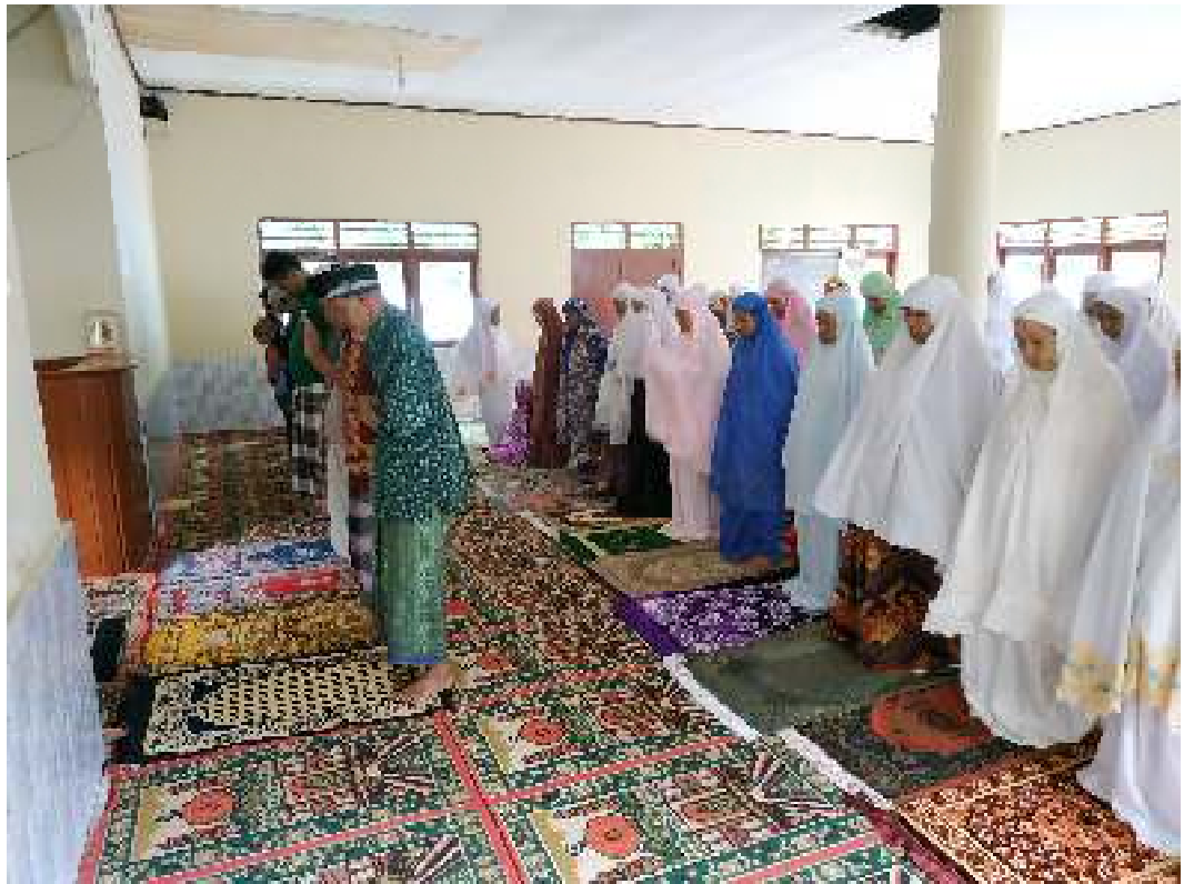
Proses Pelaksanaan Tradisi Akkammisi di Dusun Langkow