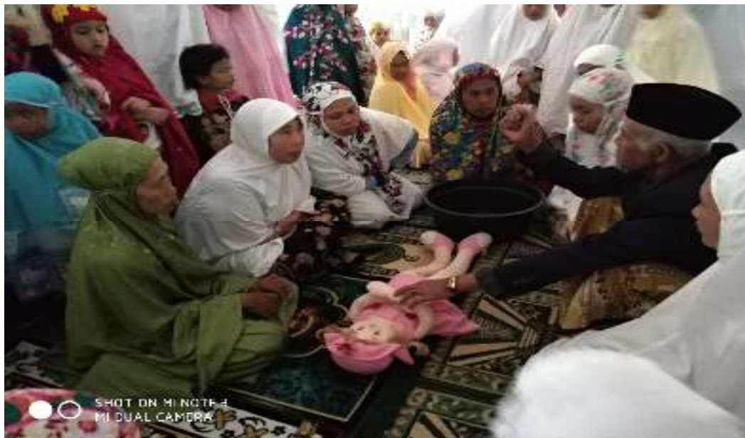
Materi penyelenggaraan Jenazah pada rangkaian Akkammisi