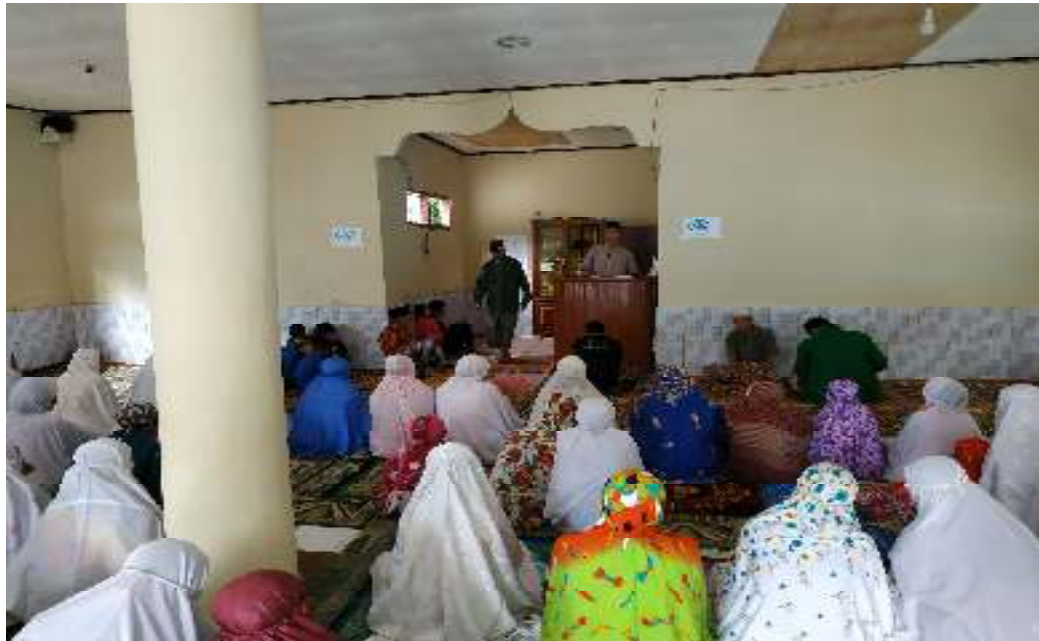
Ceramah yang dibawakan oleh remaja masjid dalam rangkaian Akkammisi