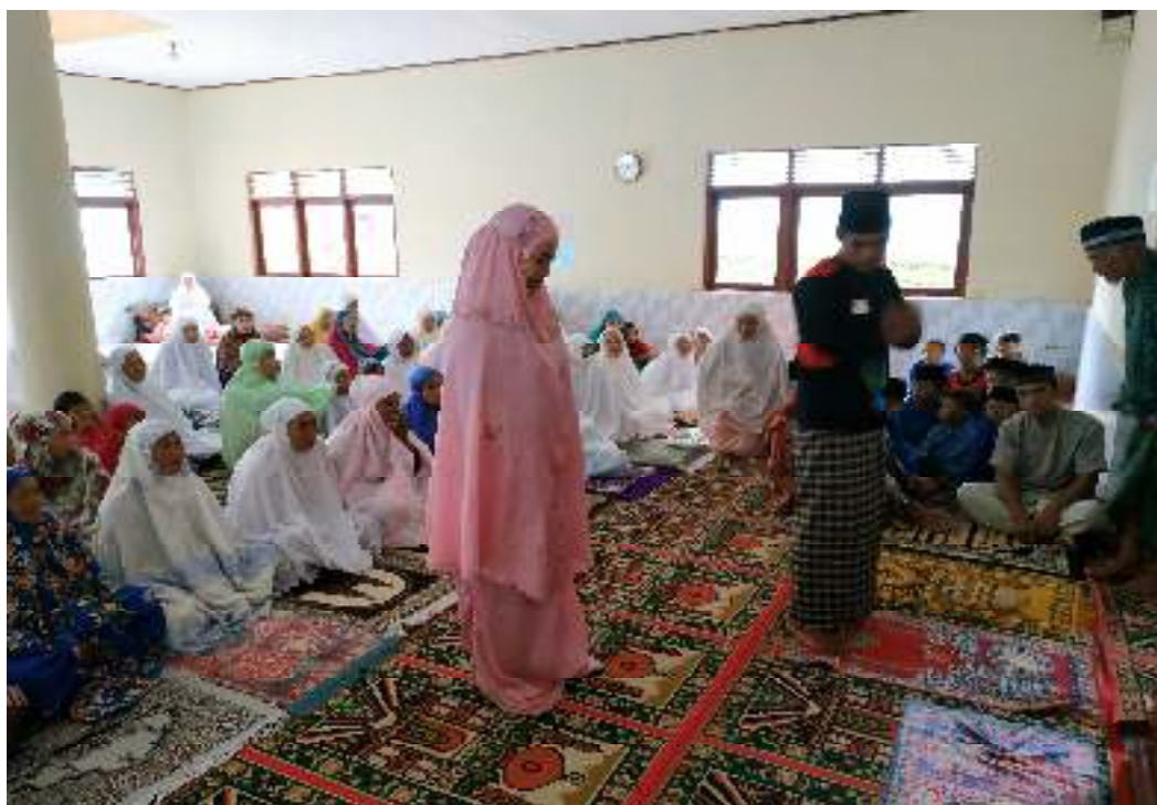
Materi Masbuk dalam rangkaian Akkammisi