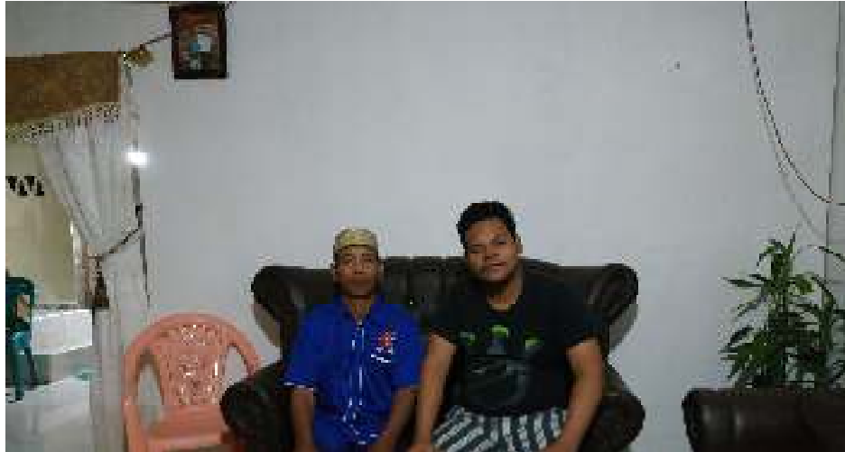
Wawancara Ketua RT 01 Selaku Tokoh Agama di Dusun Langkowa