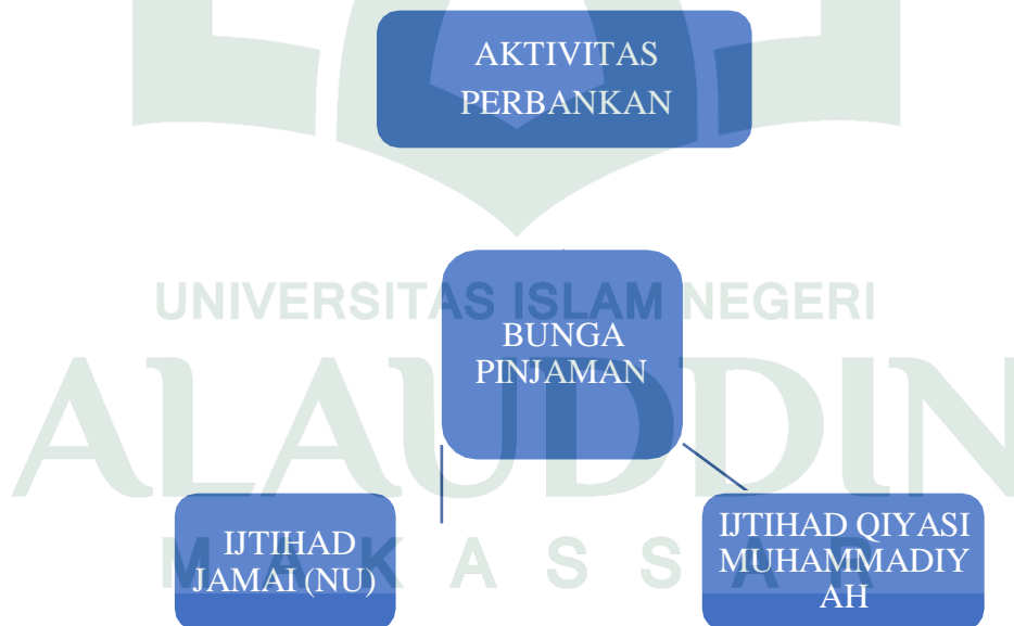
Gambar 2.1 Kerangka Pikir

Secara sederhana, hubungan antara objek yang diteliti dalam penelitian ini dapat digambarkan dalam sebuah kerangka pikir yang memuat objek-objek penelitian serta hubungan masing-masing objek tersebut. Objek-objek yang diteliti dalam penelitian ini yaitu ijtihad jama'i Nahdlatul Ulama ,dan Ijtihad qiyasi Muhammadiyah. Adapun hubungan antara setiap objek dalam penelitian ini dapat dilihat pada gambar berikut: