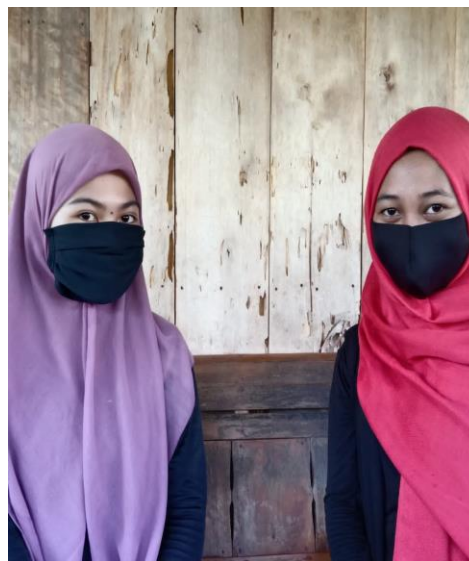
Wawancara dengan Orang tua anak