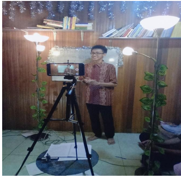
Program Kerja Gen Libels Viksion