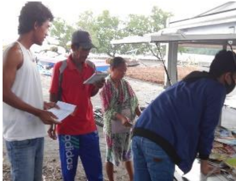
Program Kerja Lapak Baca