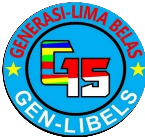
Gambar 4.1. : Logo Gen Libels