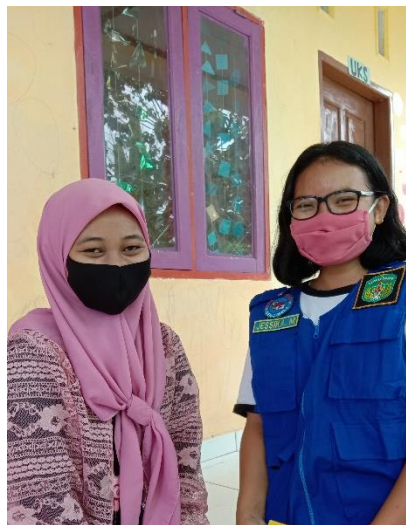
Wawancara dengan pengurus Komunitas Gen Libels