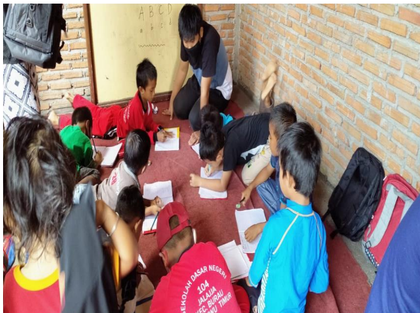
Program Kerja Mappabaca Mappaguru