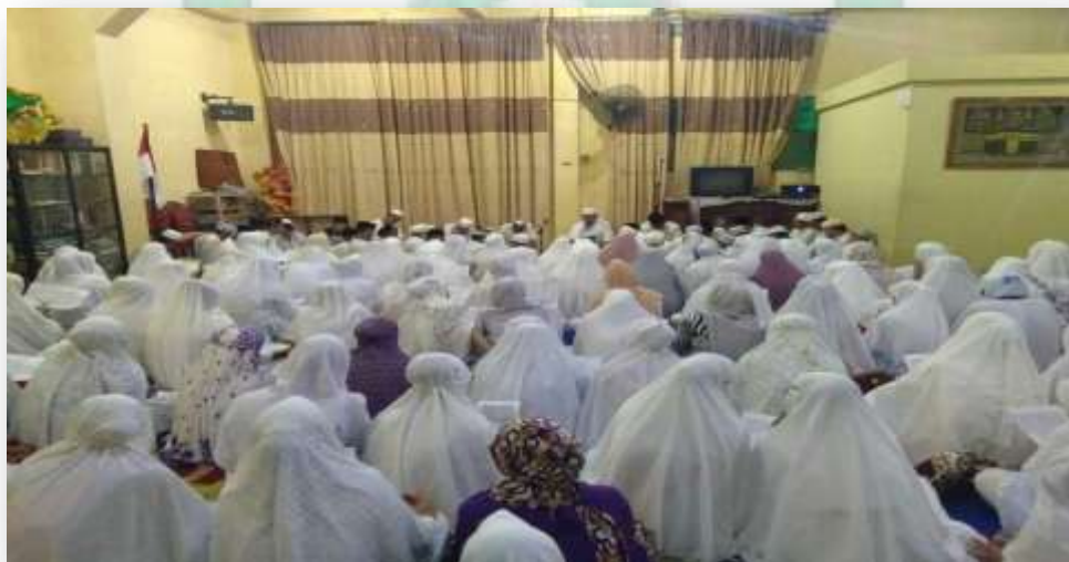
Sumber: Lampiran dari pengurus Pondok Pesantren MDIA Bontoala Makassar, Dzikir 1 Muharram di Aula Pesantren