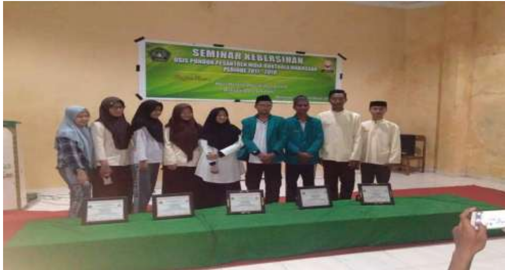
Sumber: Lampiran dari pengurus Pondok Pesantren MDIA Bontoala Makassar, Seminar tentang Kebersihan