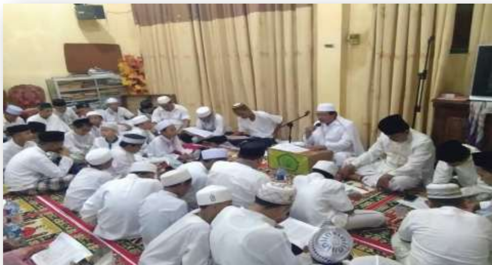
Sumber: Lampiran dari Pengurus Pondok Pesantren MDIA Bontoala Makassar, Pengkajian Kitab Kuning di Aula Pondok Pesantren MDIA Bontoala Makassar