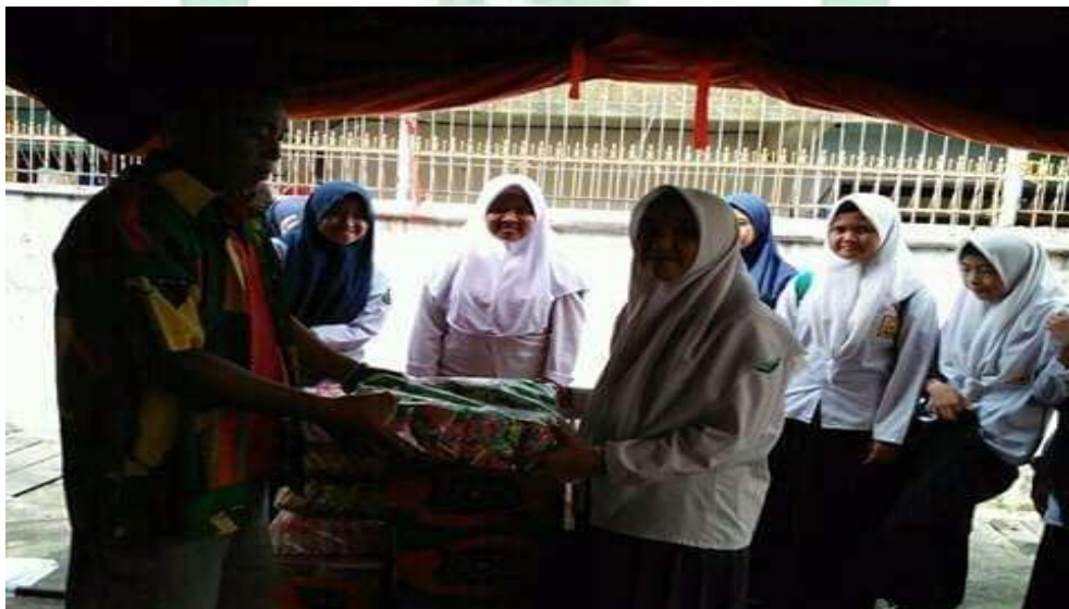
Sumber: Lampiran dari pengurus Pondok Pesantren MDIA Bontoala Makassar, kegiatan bakti sosial