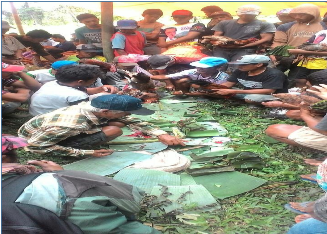
Gambar 6. Prosesi Penyembelihan Ayam, 16 Mei 2021.