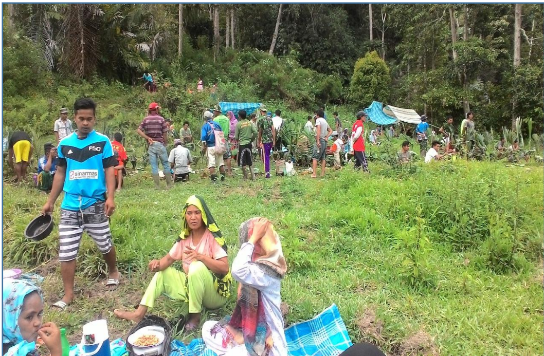
Gambar 8. Prosesi Penusukan Karerang , 17 Mei 2021