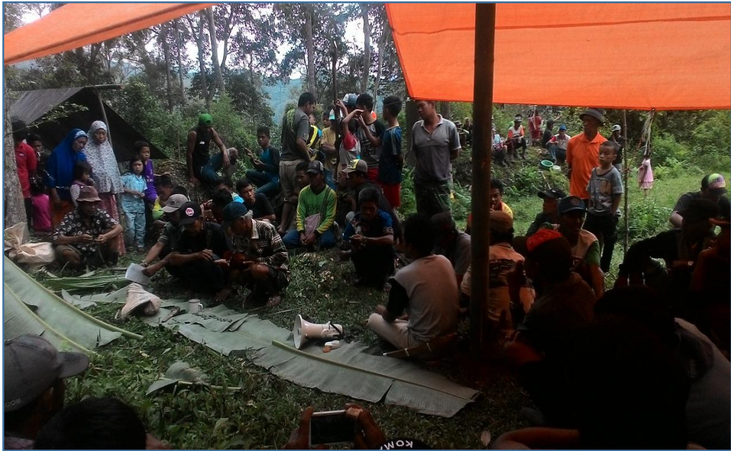
Gambar 7. Persiapan Penusukan Karerang , 17 Mei 2021