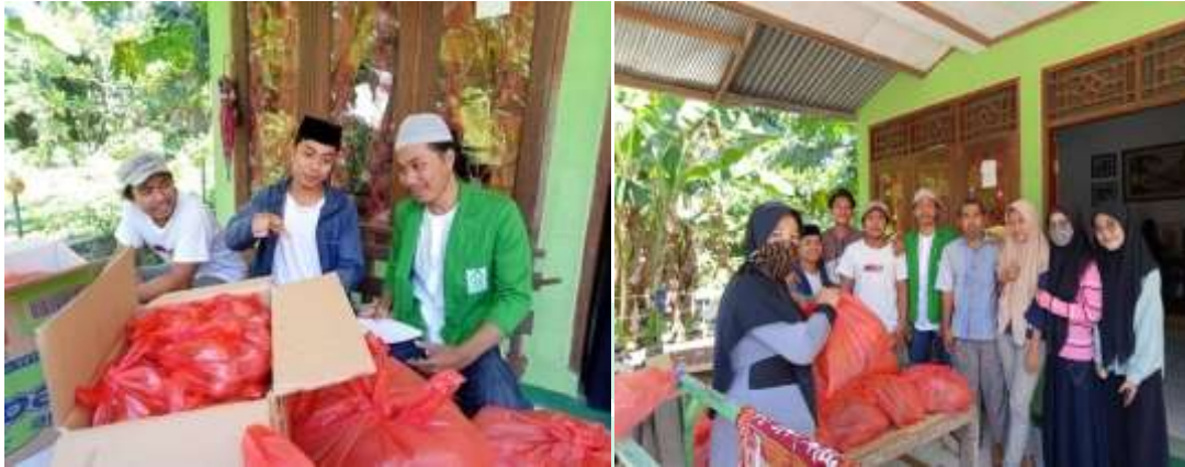
Wawancara dengan Ketua, Pembina, dan Remaja Masjid Alhidayah