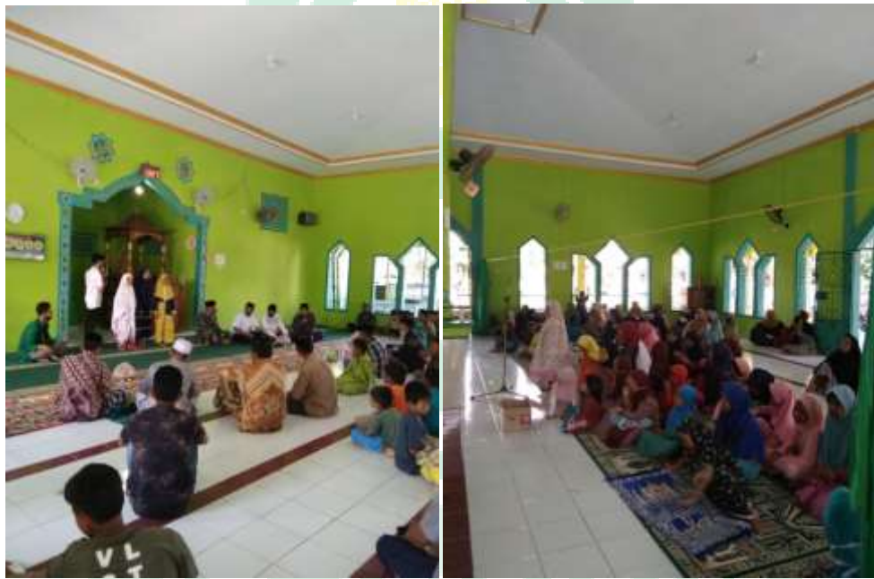
Peringatan Maulid Nabi Muhammad SAW