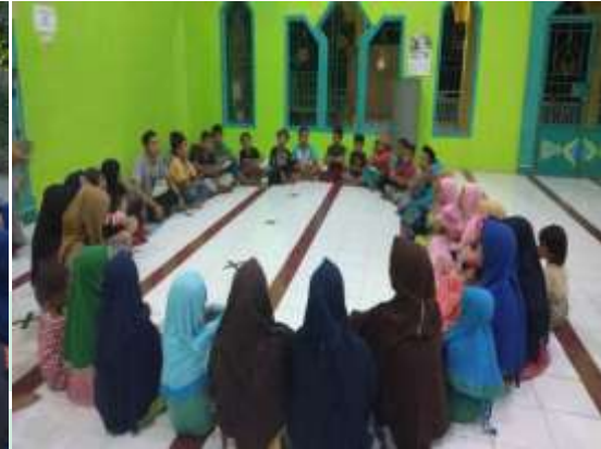
Kegiatan Pesantren Kilat