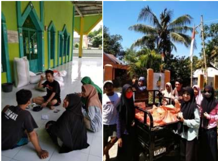
Pengumpulan Sumbangan Gabah oleh Remaja Masjid Alhidayah