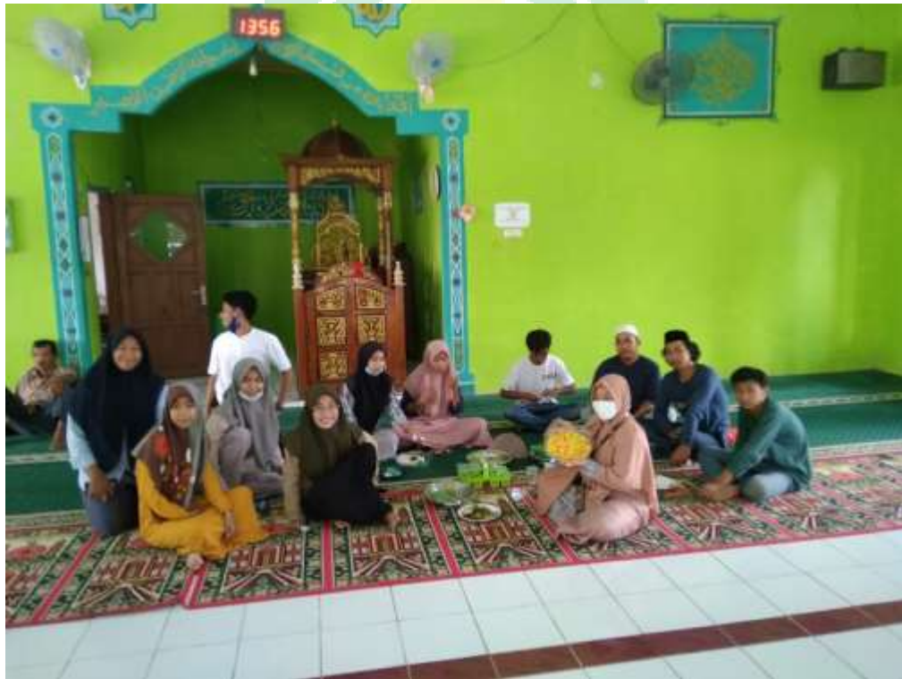
Panitia kegiatan pesantren kilat