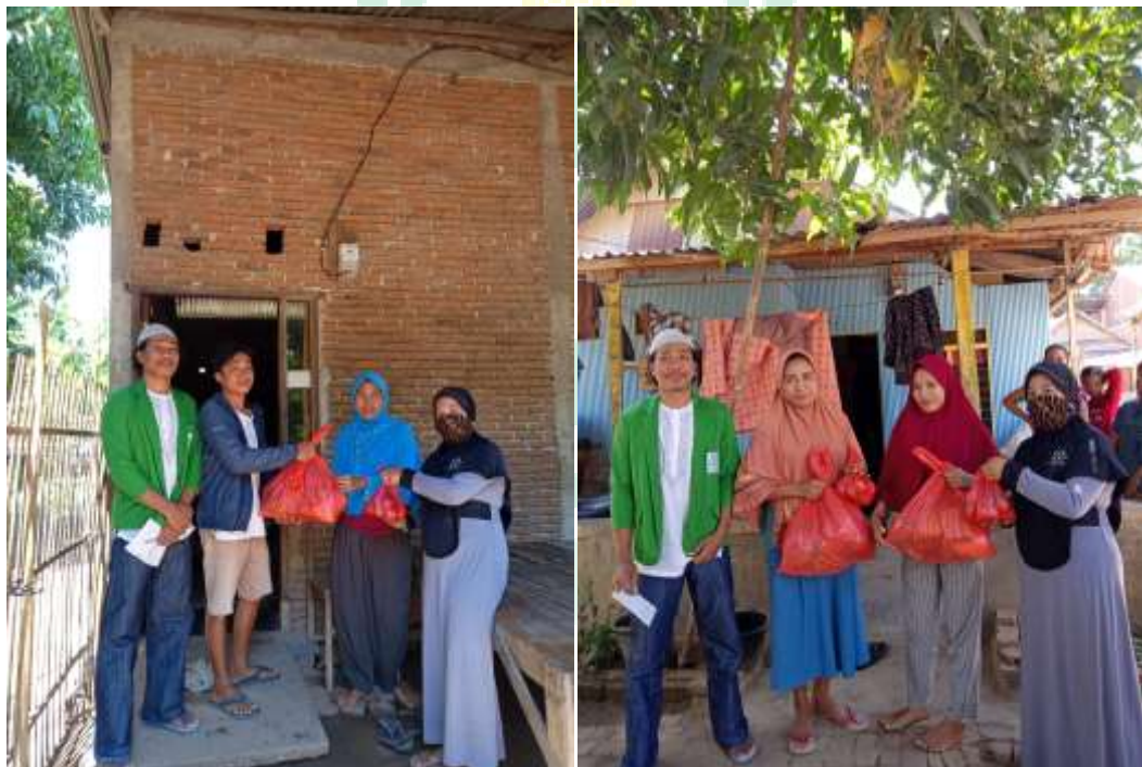
Gerakan Sosial Remaja Masjid Alhidayah Berbagi