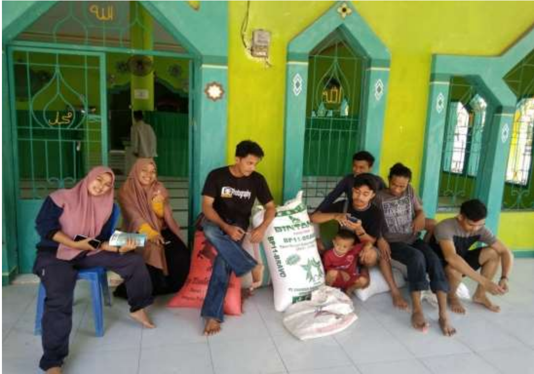
Pengumpulan sumbangan gabah oleh Remaja Masjid Alhidayah