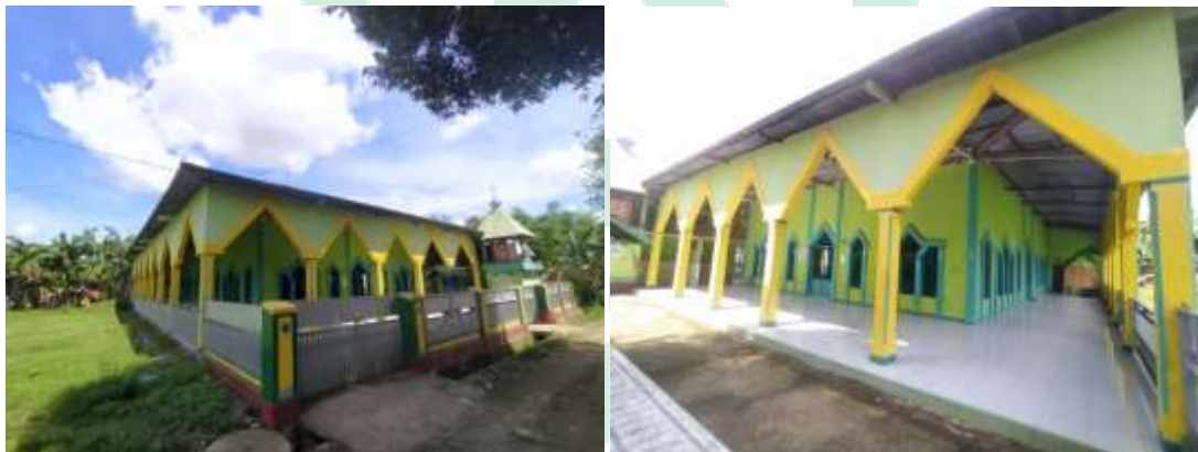
Masjid Alhidayah Kale Anassappu Desa Bontobiraeng Selatan