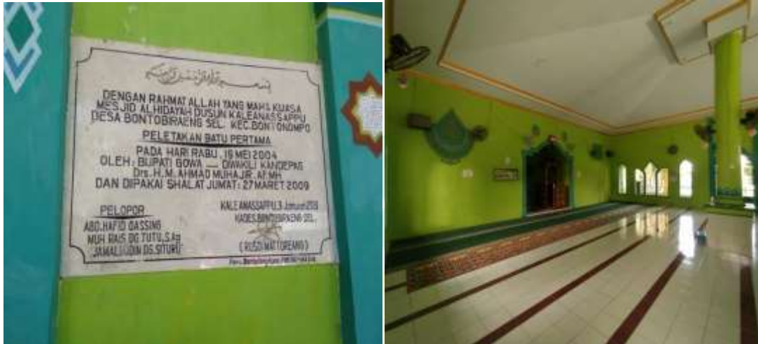
Plakat dan kondisi di dalam Masjid Alhidayah